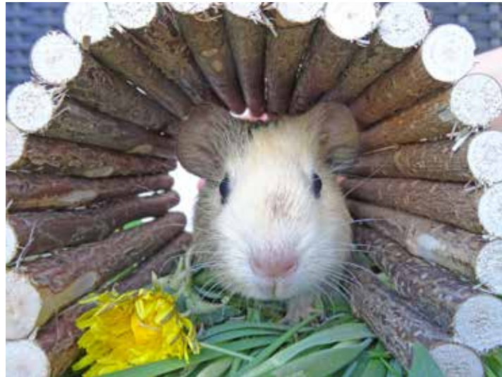
Auch Kleinsäuger benötigen Spiel und Bewegung.

2. Bei Spielspaß für Nager fällt wohl jedem der Klassiker ein: das Labyrinth. Die verwinkelten Gänge und Ecken machen das Labyrinth nicht nur ideal für den „Denksport“. Neben Abwechs-