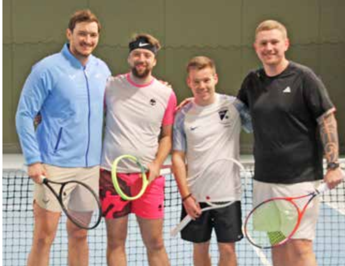
Die Lütjenburger Herren konnten gegen die Kieler punkten.