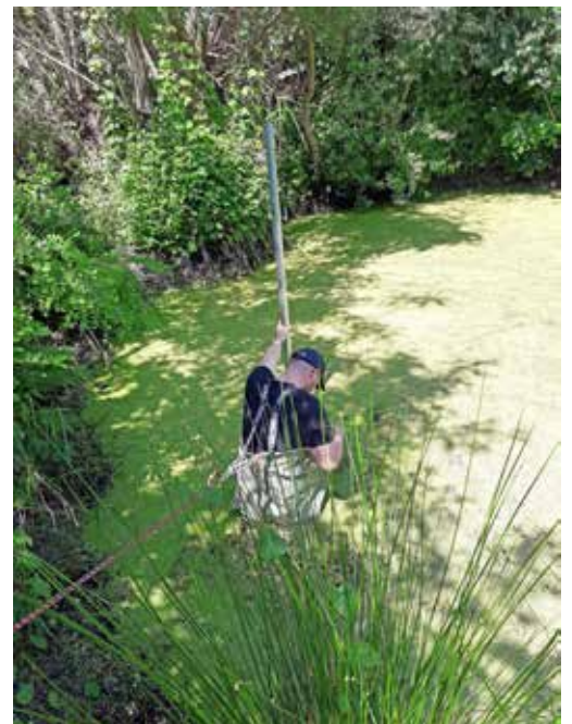
Montage im Teich

sorgen können. Obwohl die Sensorik bereits auf dem Markt vorhanden war, stellte der Einbau in Löschteiche eine besondere Herausforderung dar. Die Verwendung von sogenannter LoRaWAN-Technologie zur Übertragung der Daten ist ein innovativer Ansatz, das Landesnetz dazu befindet sich gerade erst im Aufbau. Der Kreis Plön nimmt hier eine Vorreiterrolle ein. Der Plöner Kreistag hatte frühzeitig die Chancen erkannt, die diese Technologie bietet und einen entsprechenden Beschluss gefasst. Gemeinsam mit der Digitalisierungsmanagerin der Kreisverwaltung wurde das Projekt bereits während der Planungsphase beim Land initiiert und vorangetrieben. Das Landesnetz wird zukünftig dafür sorgen, dass der Kreis Plön bald