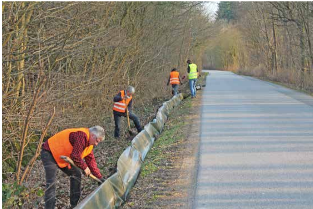
Der Zaun ist bei den entsprechenden Temperaturen und damit Beginn der Krötenwanderung von den ehrenamtlichen Helfern bereits aufgestellt worden.

Lensahn/Damlos. (rw) Wärmere Temperaturen in der Nacht lösen bei Fröschen, Kröten, Molchen Frühlingsgefühle aus und locken sie aus ihren Winterquartieren. In Damlos wurden die ersten Kröten und Kammolche gesichtet. Während der Laichwanderungen sind Amphibien von den Auswirkungen des ständig zunehmenden Straßenverkehrs betroffen. Neben dem direkten Tod infolge des Überrollens durch Autoreifen, sterben viele Tiere, obwohl sie nicht direkt überfahren werden. Autofahrerinnen und Autofahrer bittet der NABU eindringlich, auf Amphibienwanderstrecken maximal 30 km/h zu fahren. „Bei höheren Geschwindigkeiten erzeugen Fahrzeuge einen so hohen Luftdruck, dass die inneren Organe von Fröschen, Kröten und Molchen platzen und die Tiere qualvoll verenden. Nimmt man mehr Rücksicht, wird auch