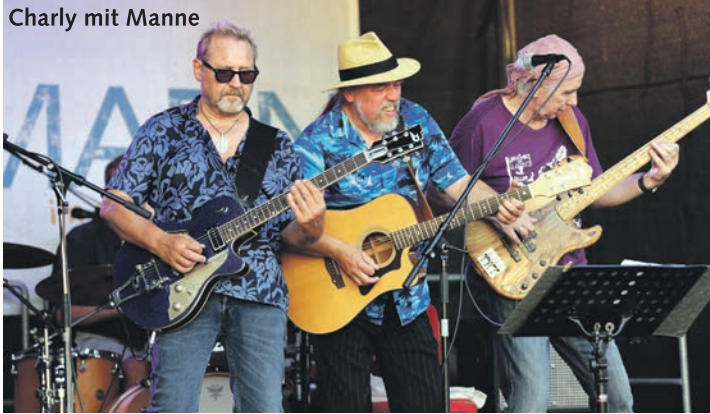
Charly mit Manne

in der „Räucherei“ zum Wanken bringen. Respekt vor der Tradition sowie den Stilrichtungen des Blues und immer wieder innovativ - das Publikum mitreißen, überraschen, begeistern! Das Programm zur Jubiläumsausgabe des Internationalen Kieler Blues Festival kann sich wieder einmal sehen lassen. Die Blues-Rock-Band The Blues Bones aus Belgien hat seit ihrer Gründung im Jahr 2011 in der internationalen Musikszene ordentlich für Furore gesorgt. Mit ihrem Sound, der im Blues verwurzelt ist, aber auch Elemente von Rock, Soul und Funk enthält, hat die Band eine treue Fangemeinde aufgebaut und für ihre kraftvollen, elektrisierenden Live-Auftritte und die qualitativ hochwertigen sieben Alben viel Lob von der Kritik erhalten. Ihr jüngstes Album „Unchained“ begeisterte selbst im Heimatland des Blues Fans und Fachleute. So schrieb das US „Blues Blast Magazine“: „Was dem Hörer bleibt, ist eine geile Blues-Rock-CD mit Blues und R&B vom Feinsten“. Die beiden größten britischen Blues-Magazine urteilen dazu: „Dieses Album ist durch und durch Klasse pur“. (Blues Matters) und „Ich habe keinen Lieblingssong, sie sind alle großartig“ (Blues in Britain). Das Album belegte die Nr. 1 in den UK Blues Charts (IBBA) und landete auch in den US-Blues & Rock Charts auf Platz 3. Drei