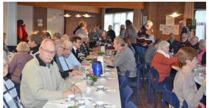
Gut besucht war die diesjährige Jahreshauptversammlung des SoVD Lütjenburg im Gemeindehaus der evangelischen Kirche.

Wichtige Telefonnummern/Notdienste Notruf Polizei 110 Notruf Feuerwehr/Rettungsdienst 112 Polizei in Lütjenburg 04381-906 331, ärztlicher Bereitschaftsdienst 116 117, Gift-Notruf (erste Hilfe) 030-19240