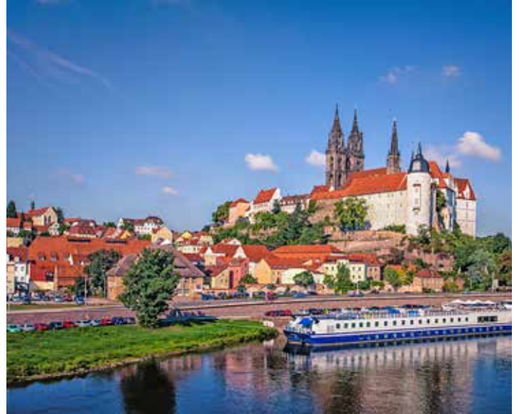
Die weltberühmte Porzellanstadt Meissen an der Elbe erwartet unsere Leser:innen zum genussvollen Ostern-Weekend zum Superpreis.

14. Februar 2024 um 21.00 Uhr herzlich in die Spelunke der Bretterbude Heiligenhafen eingeladen. Der Eintritt dieser Veranstaltung ist frei.