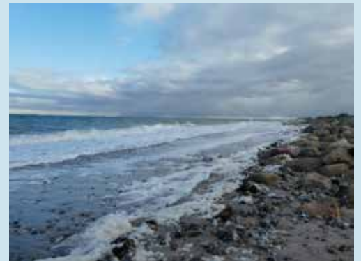
Der Strand in Hohenfelde kurz nach der Sturmflut im Oktober 2023