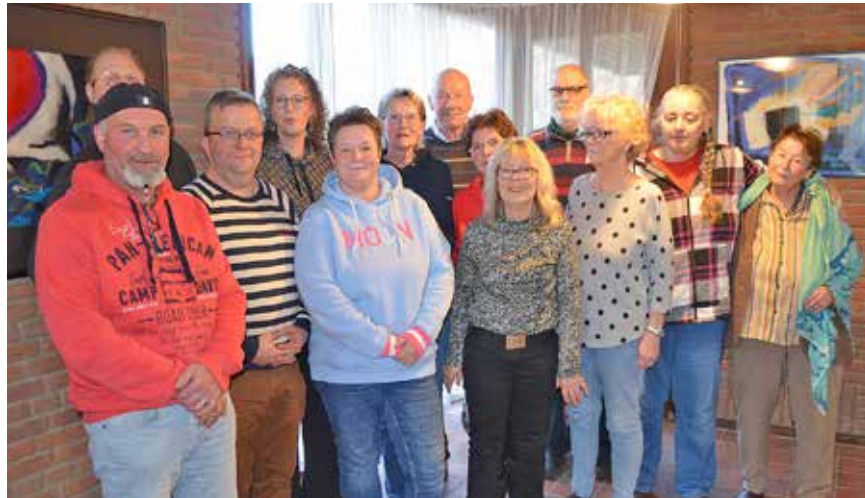
Der neue Vorstand freut sich auf die kommenden Aufgaben.