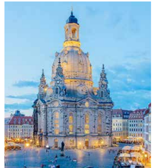
Zum Abschluss der Oster-Reise genießen unsere Gäste in der Frauenkirche einen festlichen Oster-Gottesdienst in Dresden.

wie anschließender Freizeit zum Stadt- & Sightseeing-Bummel in Dresden und am 4. Tag der Besuch des Oster-Fest-Gottesdienstes in der Frauenkirche Dresden.