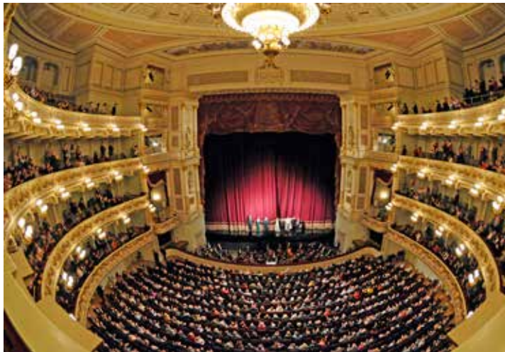
Ein Oster-Musik-Genuss der Extraklasse erwartet unsere Leser:innen in der berühmten Semper Oper Dresden.

Euro mit unserem hochklassigen österlichen Musik-Programm in Dresden und dem berühmten Oster-Markt in der Porzellanstadt Meissen, wo unsere Gäste in direkter Nähe von Dresden im Top-Hotel in der historischen Kla-