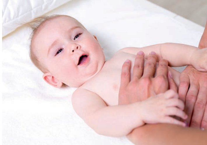
Eine sanfte Massage fördert die Entwicklung des Babys.