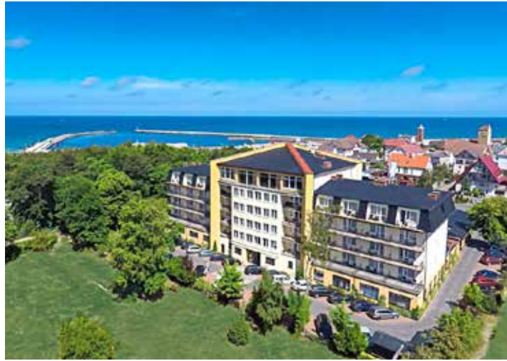
In Top-Lage am Meer befindet sich das exklusive Verwöhn-Hotel „Lidia“ an der Pommerschen Bernsteinküste.

OLDENBURG / LENSahn. (t) Einen Frühlings-Knüller der Extraklasse präsentieren die Kurier-Leser-Reisen zur Saisonöffnung 2024 zum absoluten Superpreis von nur 299,90 Euro mit einer exklusiven Verwöhn-Reise an die weltberühmte Pommersche Bernsteinküste vom 18. bis 23. März 2024: Unsere Leser:innen genießen während der fünftägigen Luxus-Reise das internationale Verwöhn-Hotel „Lidia“ in der historischen Königsstadt Rügenwalde in Top-Lage direkt am Meer und Hafen mit deutschsprachigem Personal und Top-Service. Das alte Seebad mit der großen Geschichte erwartet unsere Leser:innen zum Schlemmen &