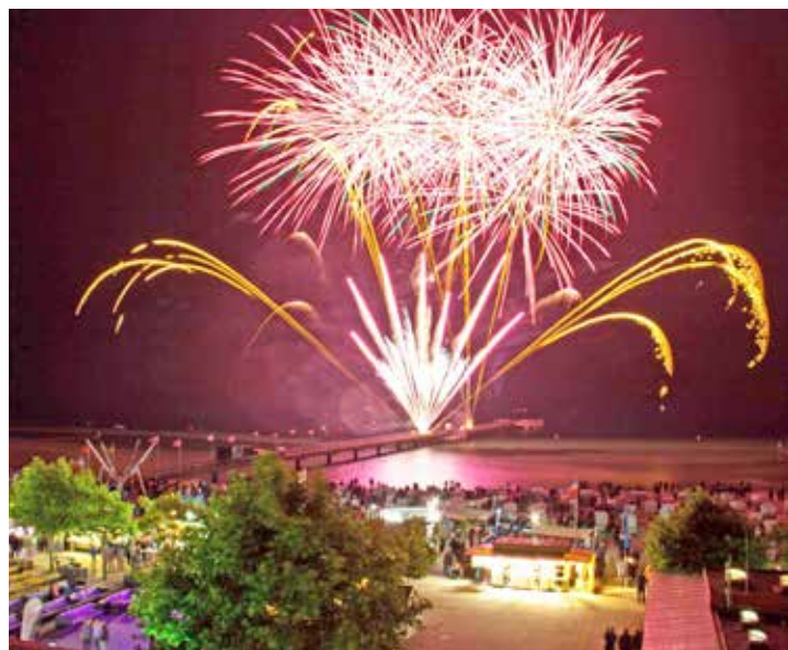
Das neue Jahr wird mit einem farbenfrohen Feuerwerk begrüßt.

Partygesellschaft bis in die Nacht zum Tanzen und Feiern bringen wird. Um Punkt 0.00 Uhr wird ein grandioses, leuchtend-farbenfrohes und musikalisch-untermaltes Silvester-Höhenfeuerwerk auf der Seebrücke das Jahr 2024 „Willkommen“ heißen – und das alles „open-air“ und kostenfrei!