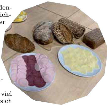
Viele verschiedene Brotsorten galt es für die Kindergartenkinder zu testen.

Die Kinder hatten viel Freude und bedanken sich herzlich für diese leckere Aktion.