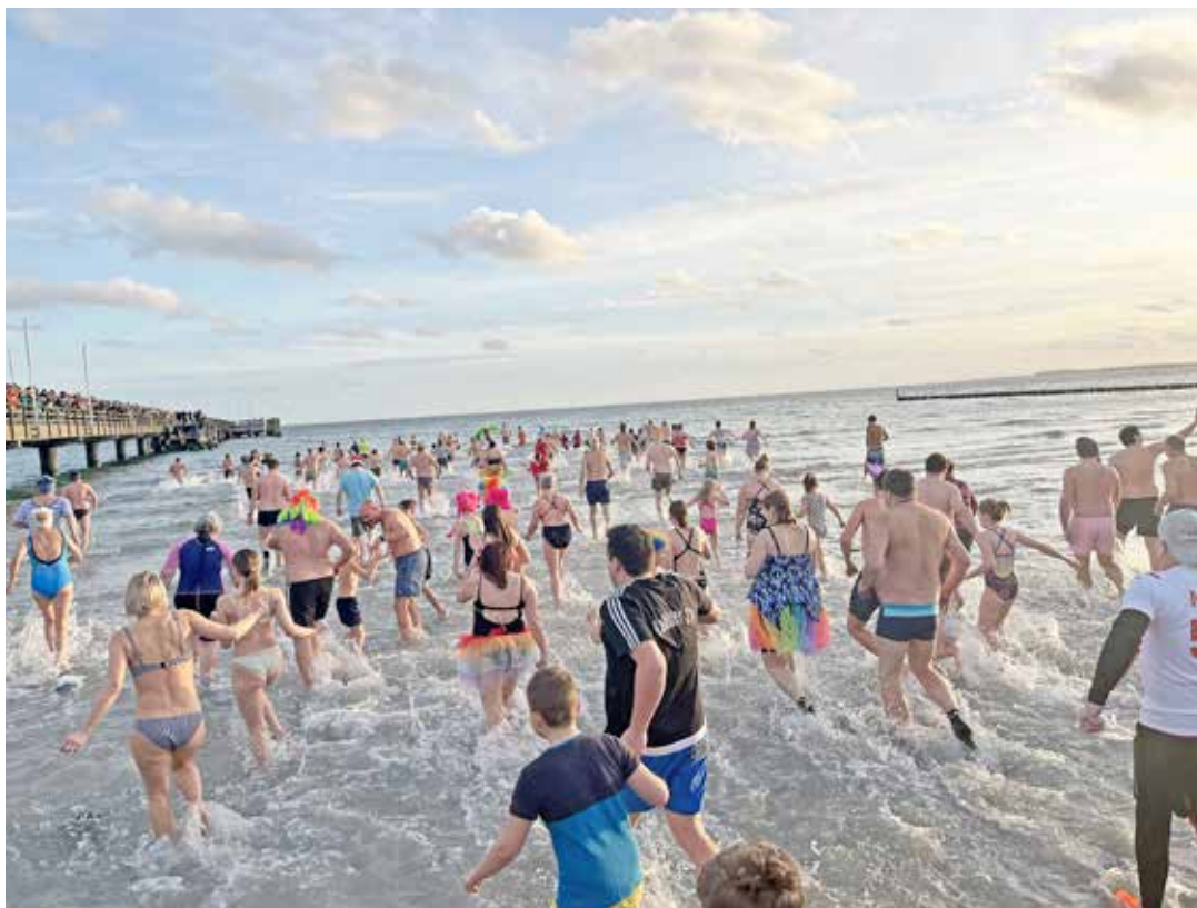
Das traditionelle Anbaden findet am Neujahrstag an der Großenbroder Seebrücke statt.

Großenbrode. (dz) Begrüßen Sie gemeinsam das Jahr 2024 pünktlich um 15.00 Uhr mit einem ausgiebigen Bad in der Ostsee beim Neujahrsschwimmen in Großenbrode mit anschließendem Schwitzen in der Fasssauna. Schüttelt den Kater ab und taucht ab in Neptuns Fluten. Alle Mutigen, die bis zum Hals in der Ostsee baden, erhalten als „Dankeschön“ ein kleines Präsent sowie viel Applaus und... Respekt! Ob Jung oder Alt, in Badehose oder Neoprenanzug, Badekappe oder Pudelmütze, ob mit oder ohne Kostüm: Wir wollen euch ALLE! Nach der Mutprobe laden wir alle Teilnehmer:innen zu einer warmen Suppe auf der Promenade ein. Eine Voranmeldung zum Neujahrsschwimmen ist möglich und kann bis zum 30. Dezember 2023 beim Tourismusservice erfolgen. Alternativ ist auch im MeerHuus ab 14.00 Uhr eine Anmeldung am Veranstaltungstag möglich. Treffpunkt für die Schwimmer:innen ist das Meer