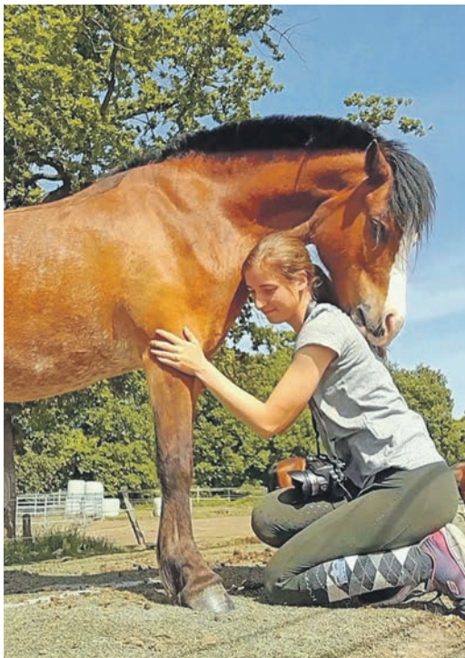
Tieren gehört ihre ganze Liebe.