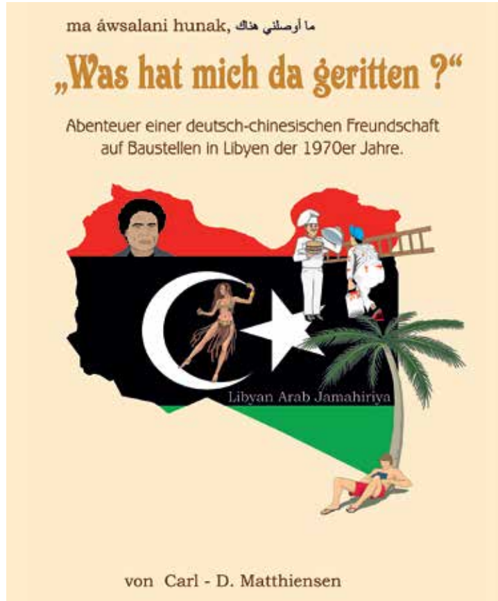
Hinter dem Buchcover stecken 212 Seiten abwechslungsreiche Geschehnisse.