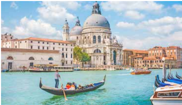
Eines der attraktiven Ausflugsziele der Reporter-Gardasee-Reise ist die weltberühmte Lagunenstadt Venedig.

möglich bei den Reporter-Leser-Reisen des Burg-Verlages in Eutin, täglich von 9 bis 13 Uhr, per Telefon 04521/7011-30 oder direkt im Internet online unter „leserreisen.der-reporter.info“.