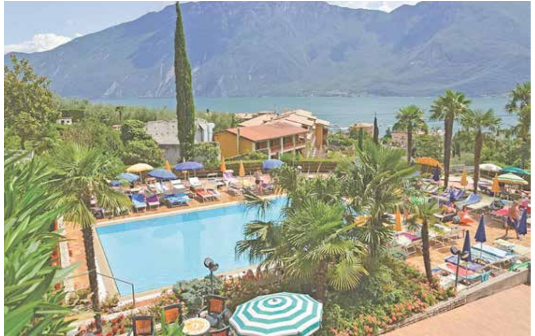
In traumhafter Lage in Limone am Gardasee erwartet das First-Class-Hotel unsere Reporter-Leser:innen.

Zum großen Leistungspaket der Sonderreise gehören neben der Fahrt im erstklassigen Fernreisebus ab Oldenburg, Lütjenburg oder Lensahn je eine Zwischenübernachtung/Halbpension in Bayern auf der Hin- und Rückreise im idyllischen Altmühltal, 4 x Übernachtungen im First-Class-Hotel in Limone