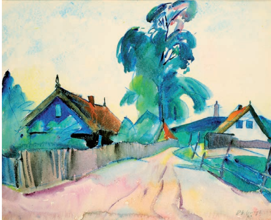
Richard Otto Voigt, Dorfstraße bei Nidden, 1927 Aquarell

Mit seiner besonderen geografischen Lage zwischen Kurischem Haff und Ostsee bot