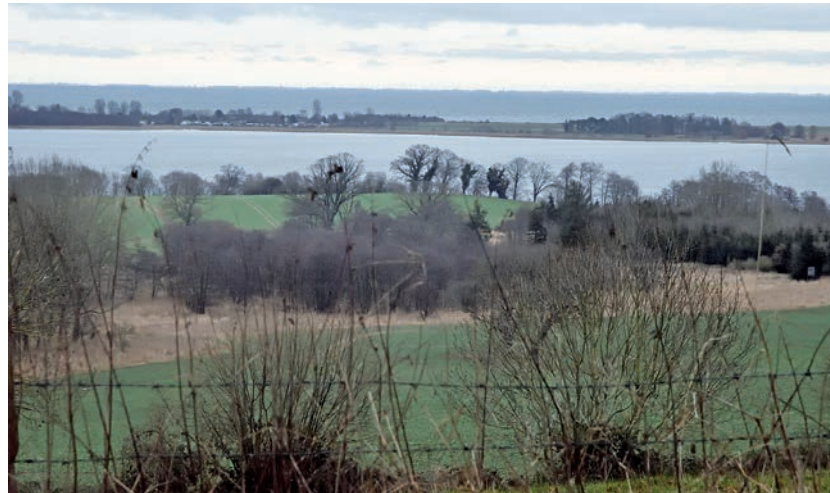
Blick von Stöfs Richtung Lippe. Am kommenden Sonntag genießen die Halbmarathonläufer auf ihrem Weg „Rund um den Großen Binnensee“ eine der schönsten Laufstrecken in Schleswig-Holstein.

Willkommen sind wie immer alle Läufer(innen) und Walker(innen), sowohl sportlich ambitioniert als auch locker und entspannt. Die Zugehörigkeit zu einem Sportverein ist nicht notwen-