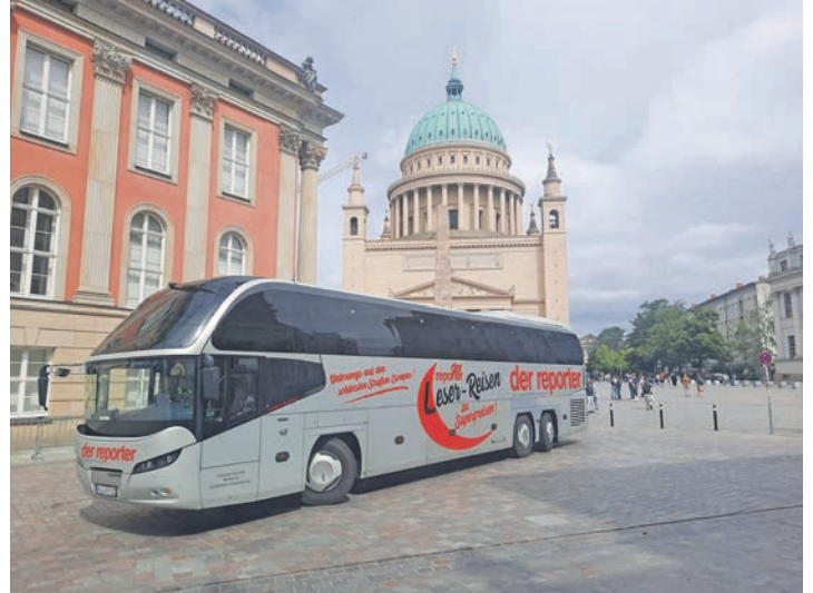
Die ganz besondere Reporter-Leser-Reisen-Geschenk-Idee zu Weihnachten: Mit dem Reporter-Bus zur Kunst-Reise ins Barberini-Museum nach Potsdam

Ein Genießer-Tag für Kunst-Freunde in einem