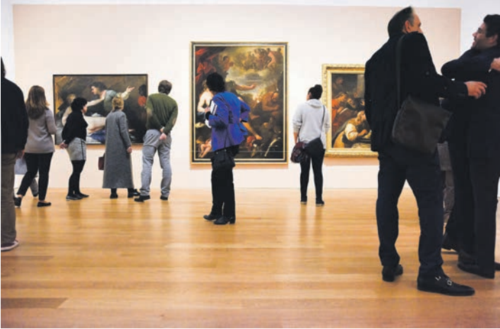
Europas spektakulärstes Kunst-Museum der Gegenwart erwartet unsere Leser:innen in Potsdam zu zwei Kunstaustellungen von Weltrang.

– Lebenslandschaft“. Die einmalige Bilderschau ver- sammelt erstmals mehr als 90 spektakuläre Leihgaben- Kunstwerke aus dem Munch- Museum Oslo, dem MOMA