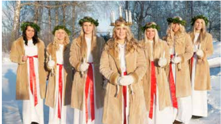
Den großen Lucia-Festumzug in Malmö genießen unsere Leser zum traditionellen schwedischen Lichterfest.

ben während einer besonders preisgünstigen Sonder-Reise ab Lensahn und Oldenburg vom 13. bis 14. Dezember 2023 zum Komplettpreis von nur 159,90 (Einzelzimmer + 49,00€) die einmalige Gelegenheit, umgeben von den typischen Aromen der Weihnachtszeit in Skandinavien mit Glühwein und Pfefferkuchen, eine eindrucksvolle Advents-Reise in zwei Länder mit Schweden und Dänemark zu genießen. Zum großen Leistungspaket der Lucia-Reise gehören neben der Fahrt im 4-Sterne-Reisebus ab Lensahn und Oldenburg die Fährpassagen mit den Großfähren der Vogelfluglinie von Puttgarden nach Rödby und zurück sowie die zweimalige Passage der gewaltigen 16 kilometerlangen Öresund-Brücke zwischen Kopenhagen und Malmö auf der Hin- und Rückreise, sodann eine Komfort-Übernachtung im neueröff-