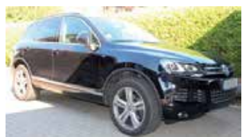
ausschließlich für PRIVATE Kleinanzeigen

Für Chiffre-Anzeige berechnen wir eine zusätzliche Gebühr von 5,- Euro. Bei Familien- und/oder Geschäftsanzeigen wenden Sie sich bitte direkt an: derreporter OLDENBURG Am Rathsländ 3 • 23758 Oldenburg ☎ 04361-63203 mail: info@derreporter.com