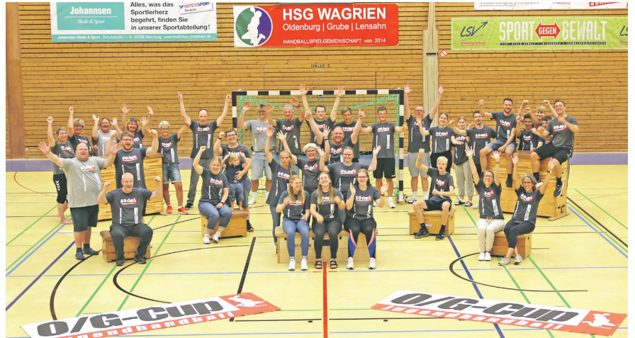
Das O/G-Cup Orga-Team freut sich auf tolle Handballtage.