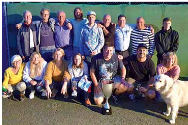
Sieger und Besiegte nach der späten Siegerehrung der 41. Lensahner Clubmeisterschaften