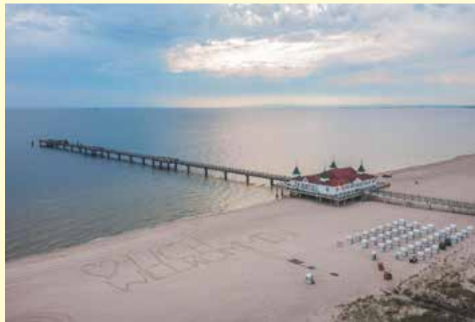
Deutschlands sonnenreichste Ostsee-Insel erwartet die Reporter-Leser*innen zum Top-Termin des Jahres direkt in den Herbstferien

Oldenburg/Lütjenburg/Lensahn. (t) Grenzenlos schlemmen und genießen können unsere Reporter-Leser*innen bei der großen Verlags-Sonder-Reise in den Herbstferien vom 19. bis 22. Oktober 2023 auf Deutschlands sonnenreichste Ostsee-Insel Usedom mit den schönsten Stränden im Ostseeraum für 4 Tage zum Superpreis von nur 269,95 €, inklusive Unterkunft im internationalen Top-Hotel in Swinemünde, mit sehr reichhaltiger Halbpension mit großen Buffets zum Frühstück und Abend-