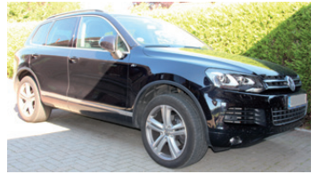
ausschließlich für PRIVATE Kleinanzeigen

Für Chiffre-Anzeige berechnen wir eine zusätzliche Gebühr von 5,- Euro. Bei Familien- und/oder Geschäftsanzeigen wenden Sie sich bitte direkt an: der reporter OLDENBURG Am Rathsländ 3 • 23758 Oldenburg ☎ 04361-63203 mail: info@derreporter.com