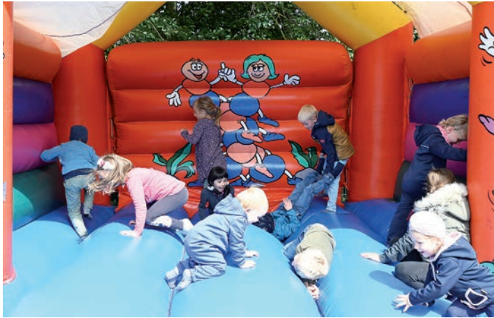
Die Kinder der „Zwergenhöhle“ spielten gut gelaunt auf der Hüpfburg.

auch ein Pflock für den Erhalt der Grundschule eingeschlagen“, teilte Klinckhamer weiter mit. Der Bau der kommunalen Kindertageseinrichtung kostete damals umgerechnet circa 230000 Euro.