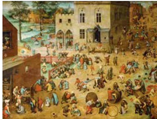
Die Kinderspiele: Auf dem Gemälde „Die Kinderspiele“ aus dem Jahr 1560 stellt der flämischen Maler Pieter Bruegel der Ältere 230 Kinder beim Spiel in 91 Varianten dar. Nicht ganz so viele Spiele aus vergangenen Tagen kann man im Dorf- und Schulmuseum ausprobieren.

Kinder spielten zu allen Zeiten mit dem was sich in ihrer Phantasie dazu eignete.