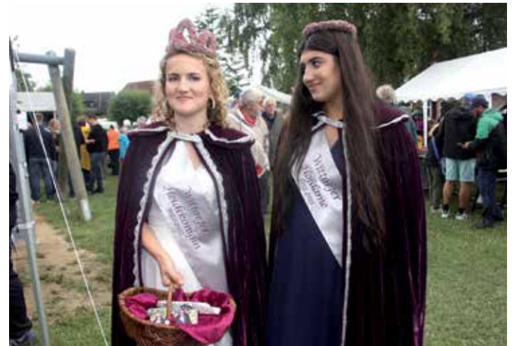
Das Wittorfer Königsduo: die Heidekönigin mit ihrer Hofdame.

Kornprinzessin hat sie sich ein Jahr lang auf die tolle Aufgabe vorbereiten können. Nun ist das Geheimnis gelüftet, wer die neue Kornprin-