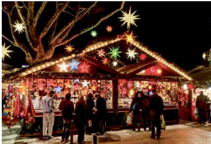
Traumhafte Weihnachtsmärkte mit weltberühmtem skandinavischen Design entdecken unsere Leser in Malmö an den Advents-Weekends.

im erstklassigen Fernreisebus mit Waschraum/WC und Klimaanlage direkt ab Oldenburg und Lensahn die „Ostsee-Kreuzfahrt“ von Travemünde nach Trelleborg mit TT-Line, inklusive der Einladung zum Mittagessen an Bord mit einem schwedischen Spezialitäten-Teller, und die Unterkunft im exklusiven Top-Designer-Hotel mit reichhaltigem Frühstück vom Buffet für 2 Nächte. Viel Freizeit zum Stadt- und Weihnachtsmarkt-Bummel steht zur Verfügung. Am 3. Tag erfolgt die Rückreise zur Einschiffung in Trelleborg auf eines der großen Märchen-Fährschiffe der TT-Line