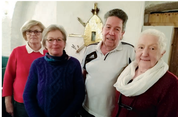
Einige Mitglieder des Fördervereins der St. Marienkirche i.G.