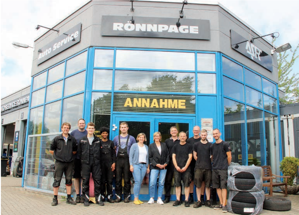
Das Team Ihres Vertrauens vom ASR.