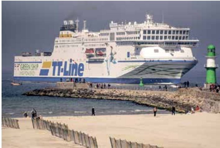
Unterwegs mit den Jumbo-Linern der TT-Line auf großen Jubiläums-Trip Kurs Schweden zum landesweit einmaligen Superpreis. spannen. In Malmö erwartet die Reporter-Gäste sodann ein

Oldenburg/Lensahn. (t) Ein genussvoller Jubiläums-City-Trip direkt ab Oldenburg und Lensahn voller Erlebnisse zum einmaligen Superpreis von nur 199,90 €, der letztmalig zu diesem Superpreis buchbar ist, erwartet die Reporter-Leser*innen zu Top-Terminen des Jahres an den Advents-Weekend-Terminen vom 1. bis 3. Dezember 2023 (1. Advent) und vom 15. bis 17. Dezember 2023 (3. Advent) mit einer 3-tägigen „Jubiläums-Kreuzfahrt“ mit Bus und Jumbofähren zu den traumhaften Weihnachtsmärkten nach Schweden: Die Ein-