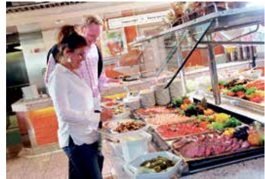
Auch kulinarisch werden die Reporter-Leser an Bord der Märchenschiffe auf dem Hin- und Rückweg rundum verwöhnt.

Zum großen Leistungspaket zum absoluten Jubiläums-Knüllerpreis „60 Jahre TT-Line“ von nur 199,90 € gehören neben der Fahrt