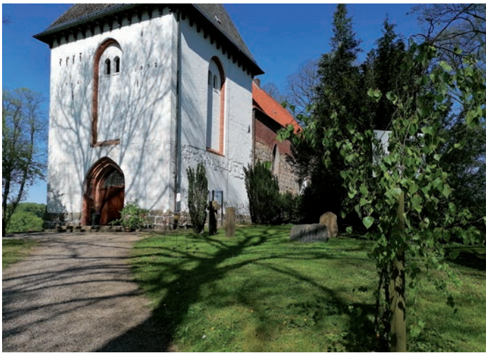
Die St. Marienkirche in Kirchnüchel.