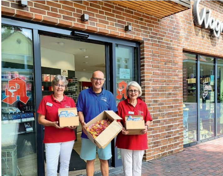
Das Team der Wagrien-Apotheke