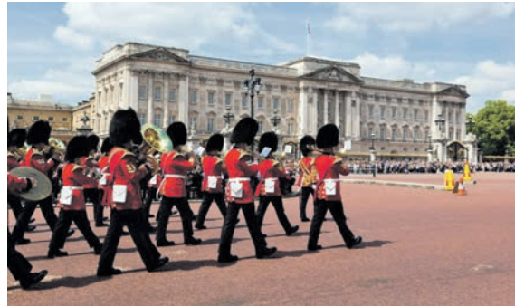
Ein Höhepunkt jeder Stadtrundfahrt: Die große Wachablösung in London am Buckingham Palace

Zum großen Leistungspaket der Sonder-Reise gehören neben der Fahrt im erstklassigen Fernreisebus mit Waschaum WC., Bordküche etc. direkt ab Oldenburg