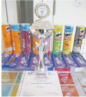
Pokal und Urkunde.

Oldenburg. (ah) Vor kurzem nahmen acht Schüler der Schule Kastanienhof am Landesfinale in der Disziplin Schwimmen in Kiel teil. Dabei holten sie sich erfolgreich den 1. Platz. Die Veranstaltung wurde organisiert von „Jugend trainiert für Olympia“ und den Paralympics.