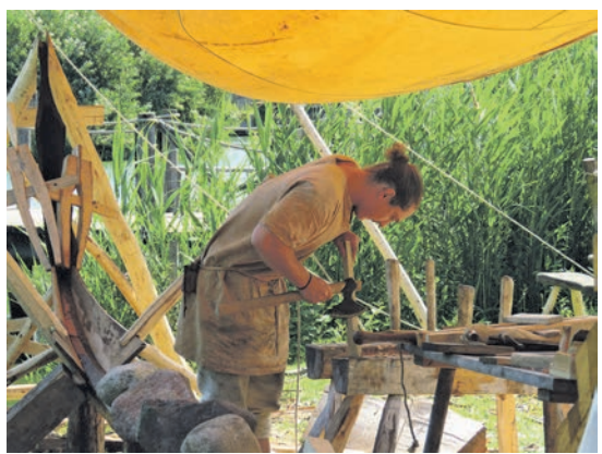
Feuer wickeln. Der Höhepunkt des Besuches ist aber

Für die Besucher bleibt es allerdings nicht nur beim Zuschauen: Sie erhalten die Gelegenheit, vieles auszuprobieren und sich so aktiv zu beteiligen. Gegen einen kleinen