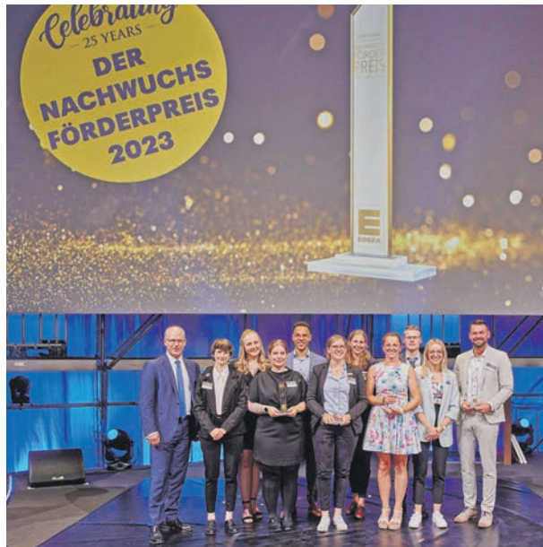
Gewinnerinnen und Gewinner bei der Preisverleihung in Bremen.

Im Rahmen seines Projekts „Azubitag - EDEKA mein neuer Lebensmittelpunkt“ haben sich alle neuen Auszubildenden von EDEKA Jens zum Start ihrer Ausbildung am Strand getroffen. Gegenseitiges Kennenlernen, Netzwerken, Spiel und Spaß standen im Fokus des Azubitags.