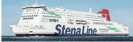
Mit den größten Stena Fähren Europas mit echtem Kreuzfahrt-Feeling an Bord geht es Kurs London

City zum grenzenlosen Shopping-Erlebnis. Ein Reisepass ist erforderlich. Anmeldungen sind ab sofort möglich im Leser-Reisen-Büro des Burg-Verlages in Eutin, täglich von 9.00 bis 13.00 Uhr, unter Telefon 04521/7011-30 oder direkt per im Internet unter leserreisen.der-reporter.info .