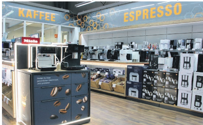
Bei einer Kaffeevorführung inklusive Verkostung wird echter Kaffeegenuss zelebriert.

Das Sommerfest bietet Unterhaltung für die ganze Familie. Beim Torwandschießen heißt es, exakte Treffer in Waschmaschinentrommeln zu erzielen, um die Chance auf den Gewinn einer hochwertigen Waschmaschine der Marke Bosch zu haben. Für die kleinen und junggebliebenen Besucher wird eine Hüpfburg aufgebaut, die für jede Menge