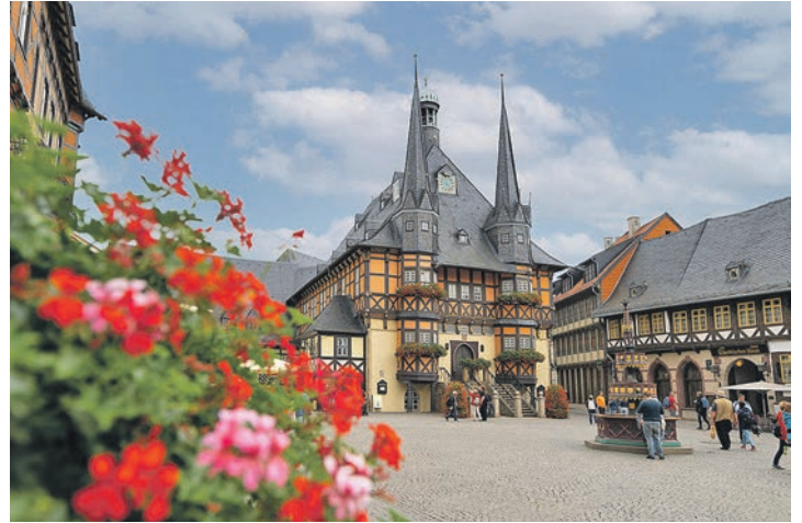
Auf zwei großen Harz-Rundfahrten entdecken unsere Leser auch die Perle des Ostharpes mit dem malerischen Wernigerode

direkt Buchungen möglich in Eutin, Montag bis Freitag sind, genauso wie auch bei 9 bis 13 Uhr, unter Telefon den Reporter-Leser-Reisen 04521/701130.