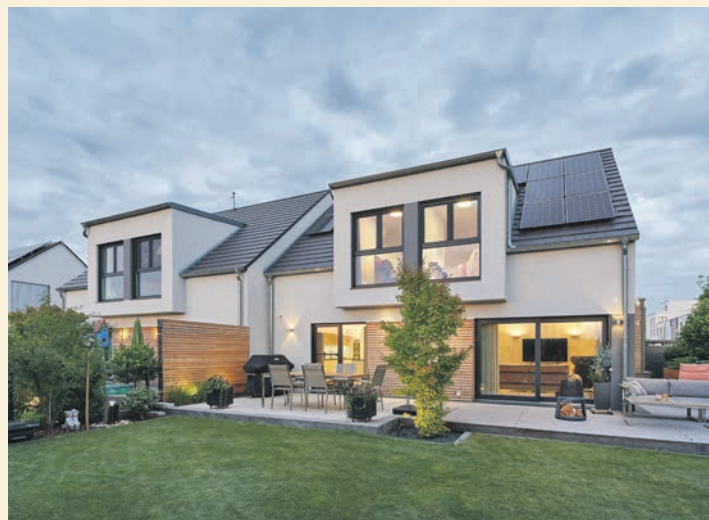
Klimafreundliche Fertighäuser werden in ganz verschiedenen Größen und Ausführungen individuell geplant.

langlebige Holzprodukte wie Fertighäuser, die ihren Ursprung in nachhaltig bewirtschafteten Wäldern haben und die über Jahrzehnte CO 2 binden, hilft das unmittelbar auch dem Klima. Denn gemeinsam entlasten unsere Wälder und nachhaltige Holzprodukte die Umwelt am besten“, sagt Georg Lange, Geschäftsführer des Bundesverbandes Deutscher Fertigbau (BDF).