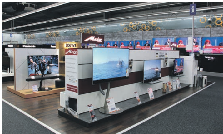
Besonders im Fokus werden am Samstag auch die hochwertigen Fernsehgeräte von Metz stehen.