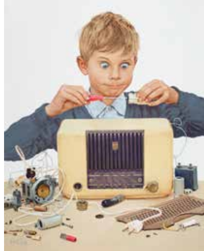
Eine Schraube locker, 1968, Gouache auf Künstlerpappe