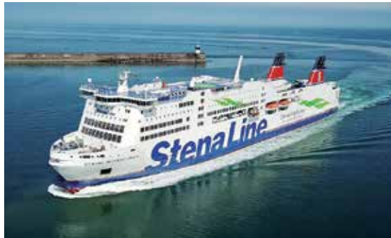
Mit dem Reporter in den Herbstferien zum Superpreis von nur 129,90 auf Schweden-Kreuzfahrt nach Göteborg.

von Kiel nach Göteborg inklusive 2-Bett-Kabinen mit DU/WC, TV, WLAN kostenlos etc. an Bord (Ausseekabinen gegen Aufpreis von 38,00 € p. P. für Hin- und Rückfahrt buchbar!) und 2 x großes skandinavisches Frühstücks-Buffet an Bord, das bereits im Preis inklusive ist. In Göteborg erwartet unsere Leser am 2. Tag von 9.00 bis 17.30 Uhr während der Freizeit Schwedens 2. größ-