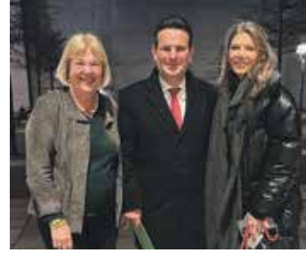
Bettina Hagedorn mit Bundesarbeitsminister Hubertus Heil und der engagierten Schauspielerin Ursula Karven

Hagedorn: „Die Internationale Arbeitsorganisation (ILO)