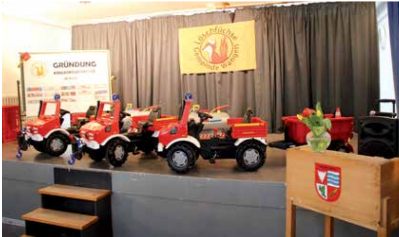
Gründungsurkunde, Löschfuchse-Logo und die altersgerechten Einsatzfahrzeuge der Kinderfeuerwehr