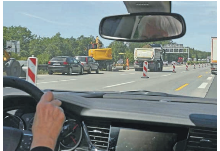
Unfall auf der BAB: Fließender Verkehr ein Risiko

Zum Verkauf: Honda CBF 600 SA (PC43), Bj. 2008, 11700 km. Sehr gepflegt. TÜV und Reifen neu. Zubehör: Originale Seitenkoffer in Fahrzeuglack (rot), 12 V Steckdose, Sturzpads, Sportauspuff extra im Karton dazu. VHB 4200 €. Tel.: 0162/9420528