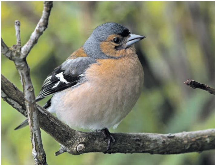
Der farbenprächtige Buchfink bestellt gern ein würziges Bier

Wer bei der NABU-Exkursion mitmachen möchte, trifft sich am 14. Mai 2023 um 10 Uhr in Hohwacht auf dem großen Parkplatz am Ende der Straße „Am Buchholz“, Höhe Krähenholt. Die Veranstaltung soll etwa zwei bis drei Stunden dauern.