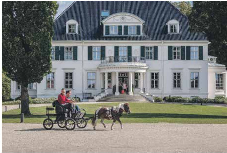
Kochen, wo andere Urlaub machen: Am 20. Mai können sich junge Gastro-Talente davon ihr eigenes Bild machen.

im Hotel Gut Immenhof findet am 20. Mai in der Zeit von 10 bis 16 Uhr statt. Eine Voranmeldung ist nicht nötig. Weitere Informationen übers Hotel Gut Immenhof unter www.gut-immenhof.de