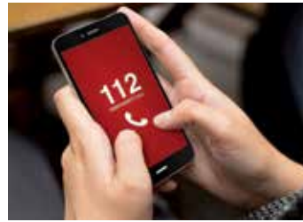
Bei Notfallsymptomen sollte nicht gezögert und umgehend der Notruf 112 gewählt werden.

Der Schlaganfall ist ebenso wie der Herzinfarkt ein medizinischer