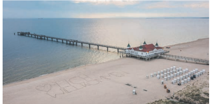
Deutschlands sonnenreichste Ostsee-Insel erwartet die Reporter-Leser zum Top-Termin des Jahres zu Pfingsten.

mit Hafen-Rundfahrt Swinemünde, Panoramafahrt auf der Swine zum Vogelreservat & Kreuzfahrt auf der berühmten „Kaiserfahrt“ mit einem Sonderschiff zum Aufpreis pro Person von nur 14,90 €, gefolgt am Nachmittag von einer Kaffee-Fahrt zur Bernstein-Insel Wollin mit Besuch im legendären Seebad Misdroy. Auf der Rückreise erfolgt eine Mittagspause in Warnemünde. Die Kurtaxe ist direkt vor Ort im Hotel zu zahlen. Anmeldungen zu dieser einmaligen Sonder-Reise sind ab sofort