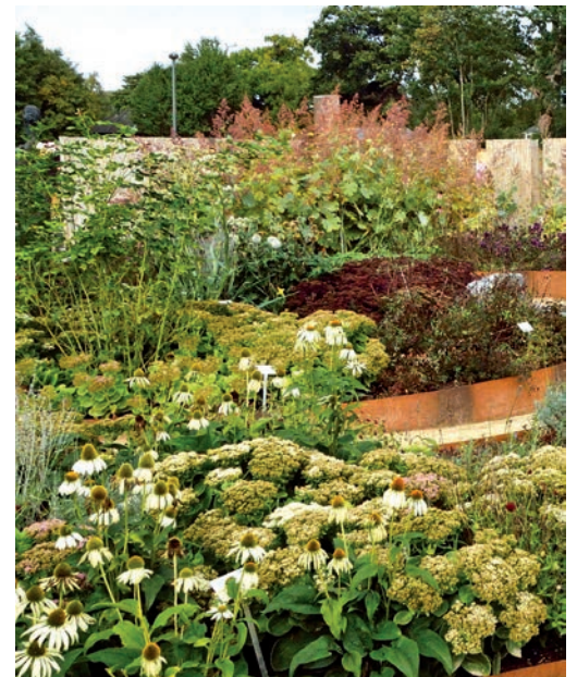
Darauf fliegen Biene & Co: Schein-Sonnenhut (Echinacea) und üppig blühende Fetthenne (Sedum telephium) in verschiedenen rötlichen und graugrünen Blattfarben.

Bei Wildbienen beliebt sind zudem Sträucher wie Kornelkirsche, Alpenjohannisbeere,