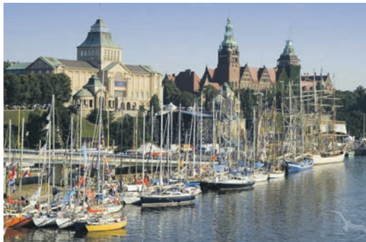
Die alte Hansestadt Stettin entdecken unsere Leser bei der großen Stadtrundfahrt mit Reiseleitung

im Hotel, 3 x großes Schlemmer-Frühstück vom Buffet sowie 3 x Abendessen im Hotel als Schlemmer-Buffet oder 3-Gang-Menü. Bereits auf der Anreise erfolgt der Besuch der alten Hansestadt Stettin mit großer Stadtrundfahrt mit Reiseleitung und Freizeit, am 2. Tag eine große Insel-Rundfahrt Usedom mit perfekter Reiseleitung unter dem