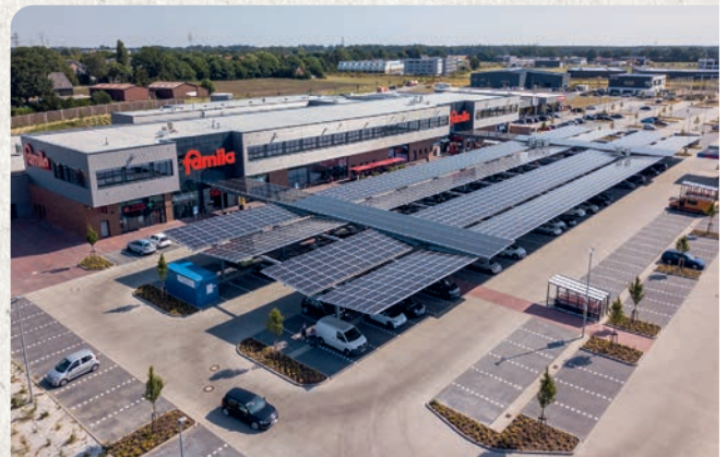
Das familia-Warenhaus in Ahrensburg

Schon jetzt produzieren wir insgesamt 1,4 Millionen kWh Sonnen-Strom pro Jahr – dem Klima zuliebe wollen wir diese Menge bis zum Ende des Jahres verdoppeln!