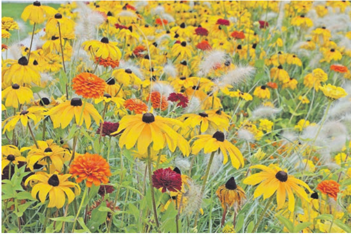
Sonnenhut und Zinnien locken zahlreiche Insekten mit kräftigen Farben.

Felsenbirne, Feldahorn, Holunder, Sal-Weide, Schneebere, Spitzblättrige Mispel und Efeu (Altersform), das im späten Herbst ergiebige Blüten bildet. Bienen wie auch alle anderen Insekten brauchen außerdem Wasser. Gibt es im Garten keinen Teich, sollten Hausbesitzer eine flache Insektentränke einrichten. Es eignet sich zum Beispiel ein Tonteller mit Wasser und Steinchen, auf denen die Tierchen gut Platz nehmen können.