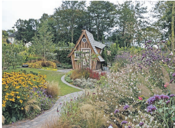
Bienenweide mit Sonnenhut (links) und einem Ensemble aus Präriekerze und Patagonischem Eisenkraut als Schmetterlingsmagnet.

Während die Westliche Honigbiene nicht ernsthaft im Bestand gefährdet ist, sind manche Wildbienenarten akut vom Aussterben bedroht. Wer aber Bienen und andere Insekten in seinen Garten locken will, sollte ihn naturnah und vor allem