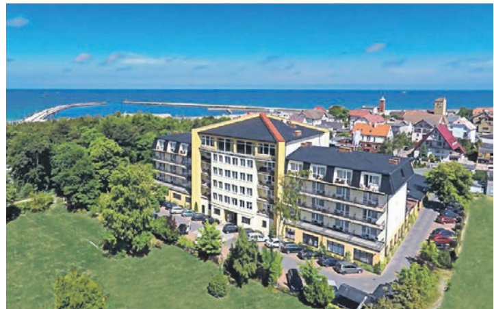
In Top-Lage am Meer befindet sich das exclusive Verwöhn-Hotel „Lidia“ an der Pommerschen Bernsteinküste

Zum großen Leistungspaket der Saison-Eröffnungs-Reise gehören neben der Fahrt im erstklassigen Fernreisebus ab Oldenburg, Lensahn und Neustadt vier Übernachtungen im 4-Sterne-Top-Hotel Lidia mit sehr grosszügigen und reichhaltigen Schlemmer-Buffets zum Frühstück und Abendessen, die kostenlose Benutzung der großen Wellness-Abteilung mit 2 Schwimmbädern, Whirlpool, Dampfbad & Aussen-Whirl-