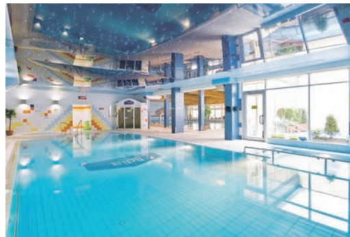
Herrliche Entspannung bietet die große Wellness- und Schwimmbad-Abteilung des Hotels Lidia.

Personal und Top-Service. Das alte Seebad mit der großen Geschichte erwartet unsere Leser zum