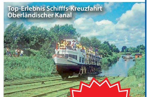
Top-Erlebnis Schiffs-Kreuzfahrt Oberländischer Kanal