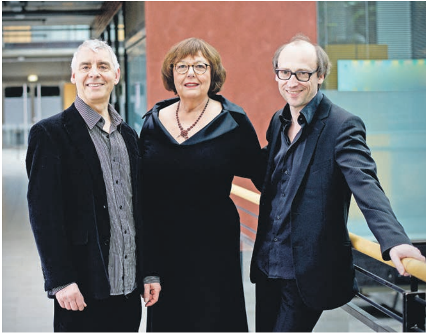
Shendli 14: WAKS Jiddische Lieder am 9. Februar in der Oldenburger KulTour.

Oldenburg. (hm) Jiddische Stimmen aus einer versunkenen Welt „Life“ mit dem Ensemble WAKS - ein besonderes musikalisches Projekt bringt das Ensemble WAKS am Donnerstag, 9. Februar 2023 um 19 Uhr im Rahmen von „Kultur am Donnerstag“ in die Göhler Straße 56. Wachswalzen-Phonographen (daher WAKS), das waren die ersten Geräte zur Konservierung von