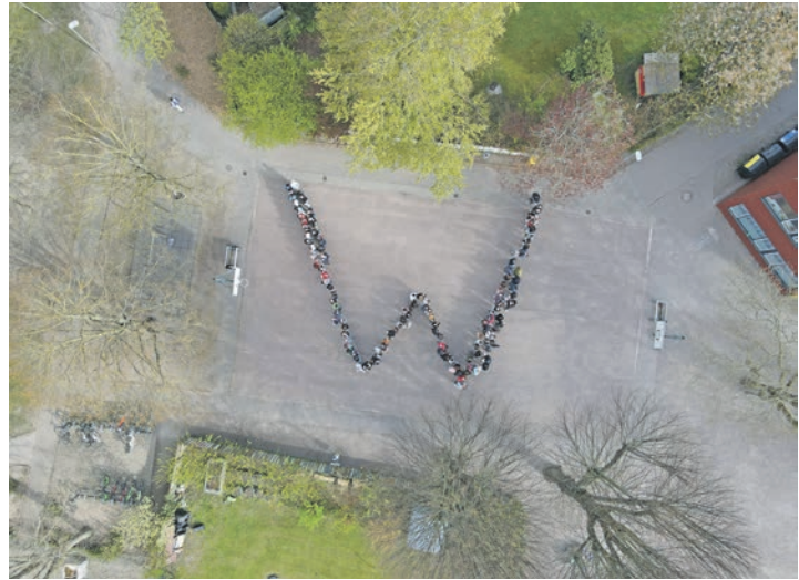
Die Schüler der Wagrienschule

Die Fachräume stehen offen, Aktionen laden zum Mitmachen ein und viele Lehr- und Lernmaterialien können angeschaut und ausprobiert werden. Für das leibliche Wohl sorgt unser Cafeteria-Team. Wir freuen uns auf den Abend und ein Kennenlernen.