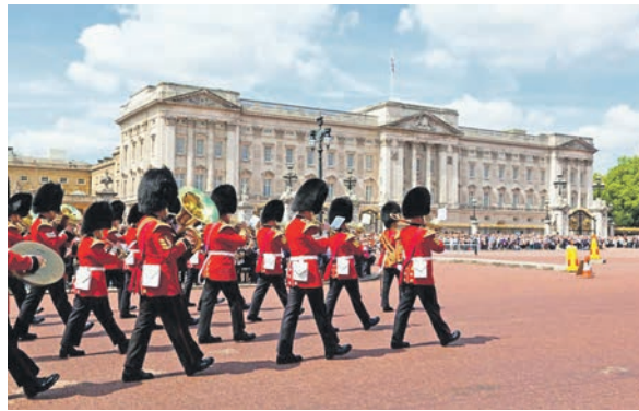
Ein Höhepunkt jeder Stadtrundfahrt: Die große Wachablösung in London am Buckingham Palace

Zum großen Leistungspaket der Sonder-Reise gehören neben der Fahrt im erstklassigen Fernreisebus mit Waschraum WC., Bordküche etc. direkt ab Oldenburg und Lensahn die erlebnisreiche Mini-Kreuzfahrt mit den größten Fährschiffen Europas der Stena Line von Hol-