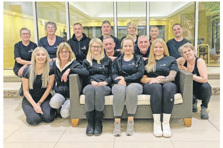
Das neue, motivierte Team des StrandSpa in Dahme.

ten motiviert ins neue Jahr und heißen den fitness- und gesundheitsorientierten Gast mit einigen Neuheiten willkommen. So ist der Softpackraum mit dem Schwebepad in Gänze umgezogen. In diesem Zusammenhang wurden