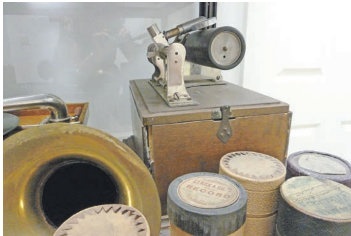
Wachswalzen-Phonographen (daher WAKS), das waren die ersten Geräte zur Konservierung von Klängen.