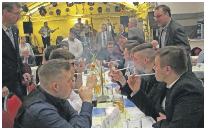
Die Tonpfeifen sind entzündet.