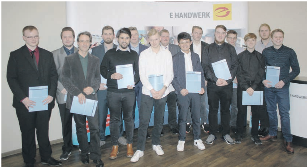
Die Junggesellen des Schulstandortes Oldenburg.