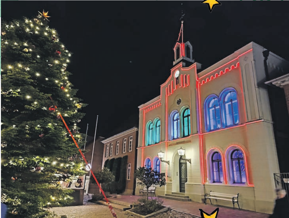
Das Oldenburger Rathaus.