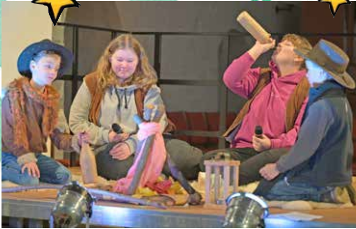
Kinder und Jugendliche beim diesjährigen Krippenspiel.

sie einen kräftigen Schluck Alkohol. Sie erschrecken gewaltig, als die Engel ihnen erscheinen. Im Stall von Bethlehem kommen dann noch die drei Weisen an, die nicht zum jüdischen Volk gehören. Sie sind verwundert: „Ein König in einem Stall? „Das ist doch unglaublich!“, meint der andere. An der Krippe versammeln sich alle. Ein Kind kommentiert: „Und noch heute, mehr