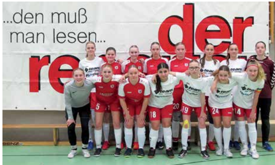
Die Zweitplatzierten: SV Wahlstedt