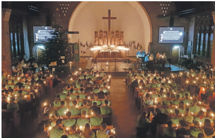
Friedenslicht-Gottesdienst des REGP in Kiel - das Licht wird an die Ring-Pfadfinder in Schleswig-Holstein weitergegeben.

vor dem 3. Advent wird die kleine Flamme der Hoffnung in einer ökumenischen Aussendungsfeier in Österreich an die internationalen Pfadfinder:innen-Delegationen weitergegeben. Pfadfinder*innen tragen das Licht von dort aus weiter – nach Europa und darüber hinaus in viele Länder der Welt.