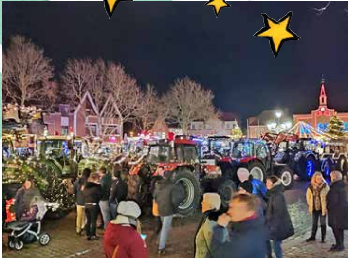
Die diesjährige Treckerparade endete am 17. Dezember auf dem Oldenburger Marktplatz und begeisterte die Besucher.

Fahrzeug-Technik Lensahn Kfz-Meisterbetrieb Inh. Stephan Lustig