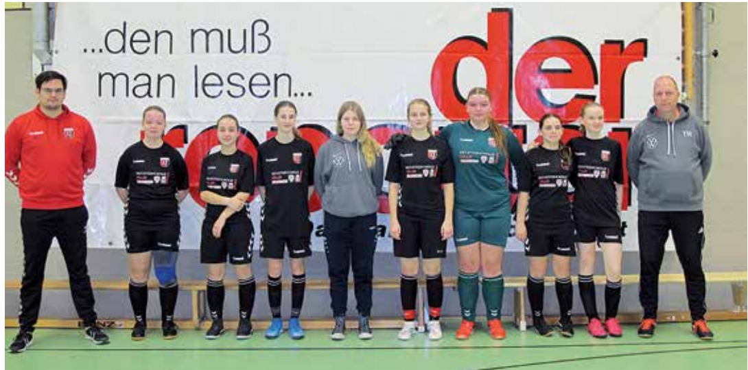
Die Turniersieger: SC Union Oldesloe

Oldenburg. (eb) Zum wiederholten Mal organisierte Volkmar Herbst auch in diesem Jahr den Reporter-Cup mit gutem Erfolg. Teilgenommen an diesem Fußballturnier für Mädchenmannschaften von der D-Jugend bis hinauf zur B-Jugend haben 10 Teams aus Oldenburg und der näheren sowie fernerer Umgebung. Austragungsort war traditionell die Großsporthalle in der Carl-Maria-von-Weber-Straße und zum wiederholten Male gelang um 11.00 Uhr pünktlich der Anpfiff zum Eröffnungsspiel, in diesem Jahr vom SV Wahlstedt und der Fortuna Lübeck bestritten. Von Anbeginn stand das Spiel, ausgetragen in Anlehnung an das Futsal-Regelwerk, unter Einsatzfreude und dem