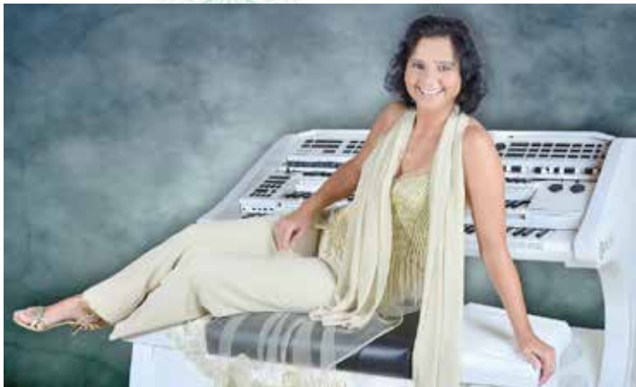
Weihnachtliche Klänge gibt es im Heiligenhafener Pavillon.

verschmilzt dabei harmonisch mit der Magie des strahlenden Soprans und lädt das Publikum gleichermaßen zum Träumen, Mitsingen und Feiern ein.