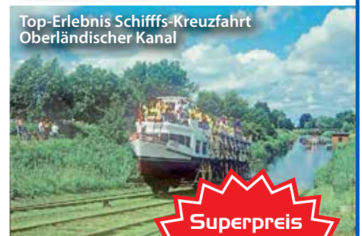
Top-Erlebnis Schiffs-Kreuzfahrt Oberländischer Kanal