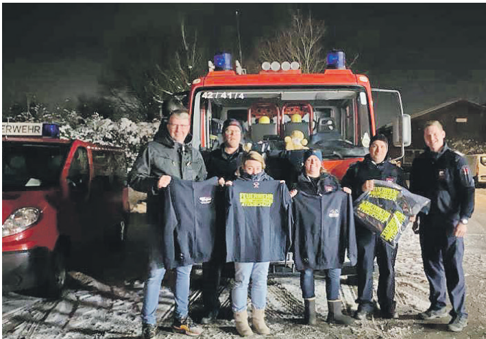
Neukirchens Feuerwehr freut sich über neue Trainingsanzüge für die Atemschutzgeräteträger

träger überreicht, damit diese sich nach einem Feuer-Einsatz umziehen können und die kontaminierte Einsatzkleidung nicht mit in die Fahrzeuge kommt. Die Feuerwehr Neukirchen bedankt sich recht herzlich bei allen Bürger:innen, die der Einladung gefolgt waren.