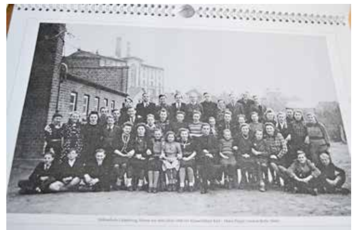
Die Volkshochschulklasse von 1948, vielleicht erkennt sich noch jemand wieder oder einen Verwandten / Elternteil?

Wichtige Telefonnummern/Notdienste Notruf Polizei 110 Notruf Feuerwehr/Rettungsdienst 112 Polizei in Lütjenburg 04381-906 331, ärztlicher Bereitschaftsdienst 116 117, Gift-Notruf (erste Hilfe) 030-19240