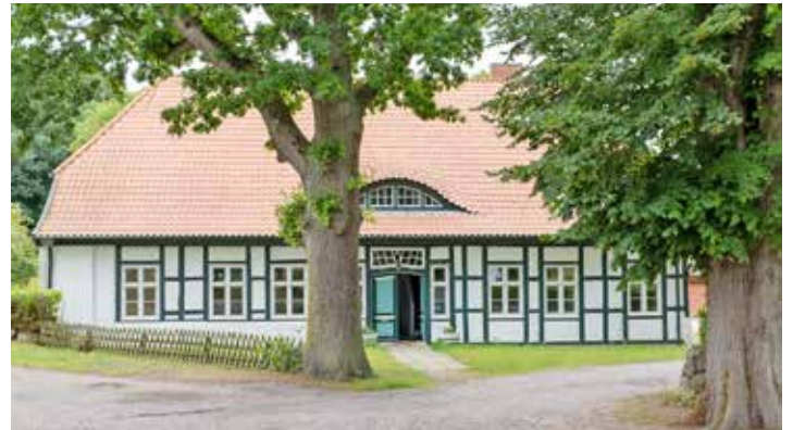
Das alte Pastorat in Hansühn

holstein. Seitens der Kirchengemeinde Hansühn wird das Projekt nach Kräften unterstützt. Mit der beschlossenen Kooperation kann das denkmalgeschützte Pastorat auf Dauer erhalten und genutzt werden. Zum Campus gehört neben dem Pastorat ein nahezu fertiggestelltes „Multifunktionsgebäude“, das im Rahmen der Ortskernentwicklung gefördert wurde. Mit Aufnahme der Arbeit in Hansühn wird das Versorgungsgebiet der ambulanten Sozialstation Oldenburg den neuen Rahmenbedingungen angepasst: Die Verwaltung des Oldenburger Büros zieht nach Hansühn. Das Gebiet nördlich von Oldenburg wird zukünftig aus Heiligenhafen abgedeckt, der südliche Bereich aus Hansühn betreut. Auf diese Weise vergrößert die Diakonie ihr Einsatzgebiet deutlich, stellt ihre