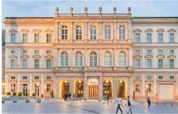
Europas spektakulärstes Kunst-Museum: Das „Barberini“ im Herzen von Potsdam

OLDENBURG / LENSahn / LÜTJENBURG (t). Weltklasse-Kunst vom Feinsten genießen unsere Leser:innen auf Grund großer Nachfrage bei der dritten großen Zusatz-Kunst-Weekend-Sonder-Reise direkt ab Oldenburg, Lensahn und Lütjenburg nach Potsdam und Berlin vom 09. bis 10. März 2024 zum Sonderpreis von nur 199,90 Euro mit Europas derzeit spektakulärstem Kunst-Museum in Potsdam mit dem Barberini-Museum mit der sensationellen nagelneuen großen Sonder-Ausstellung „Munch – Lebenslandschaft“. Die einmalige Bilderschau versammelt mehr als 90 spektakuläre Leihgaben-Kunstwerke aus dem Munch-Museum Oslo, dem MOMA New York, dem Dallas Museum sowie zahlreichen deutschen Top-Museen. Außerdem lockt