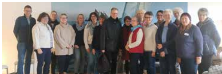
Der erste „Letzte Hilfe Kurs“ fand in Neustadt in den Räumen des Hospivereins statt

Kurzreferaten gewürzt mit praktischen Übungen sowie regem Austausch. Am Ende gab es nicht nur eine Teilnahmebestätigung, sondern auch das Resümee: Bereichert um „Neues und Altes Wissen“, ein gelungener Kurs. Der nächste „Letzte Hilfe Kurs“ ist für das erste Quartal 2024 vorgesehen. Wer möchte, kann sich bereits auf der Warteliste im Ambulanten Hospizdienst Neustadt, Am Holm 30 vormerken lassen oder uns über 04561/5130258 erreichen.