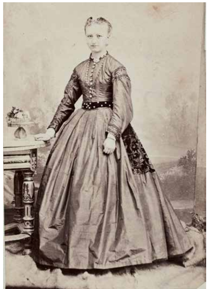
Abb.: Frau in Probsteier Übergangstracht mit Reifrock

tung der Tracht in Norddeutschland näher, hat aber auch etliche spannende Anekdoten aus der Welt der Trachten und der frühen Fotografie zu erzählen. Das Team vom Probstei-Museum bietet an diesem Nachmittag von 14.00 - 17.00 Uhr auch Kaffee und Kuchen an. Es gelten die regulären Eintrittspreise. Die Gemeinde Schönberg und der Museumsverein freuen sich über Ihren Besuch und wünschen eine besinnliche Adventszeit. Anschließend geht das Probstei Museum Ende November in die Winterpause, in der erneut an einem abwechslungsreichen Kulturprogramm für das Jahr 2024 gearbeitet wird, mit span-