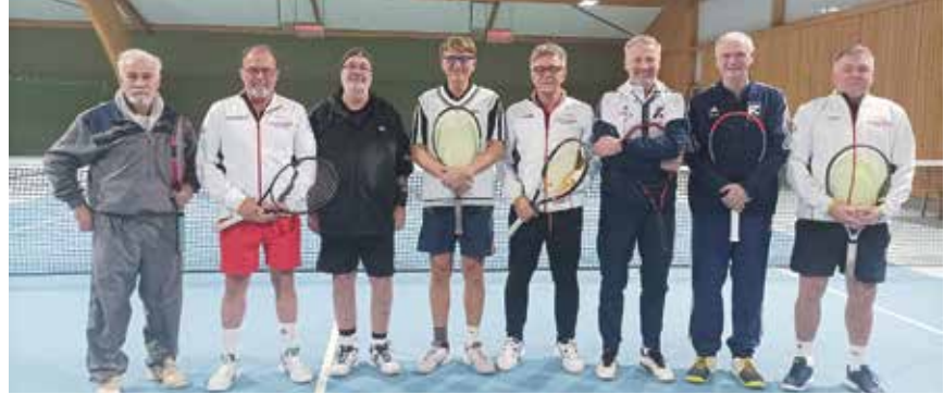
Die Herren 60 der Tennisclubs TCP Schönberg und TC Lütjenburger trafen im „Heimspiel“ aufeinander, das die „Gäste“ mit 4:2 für sich verbuchen konnten.