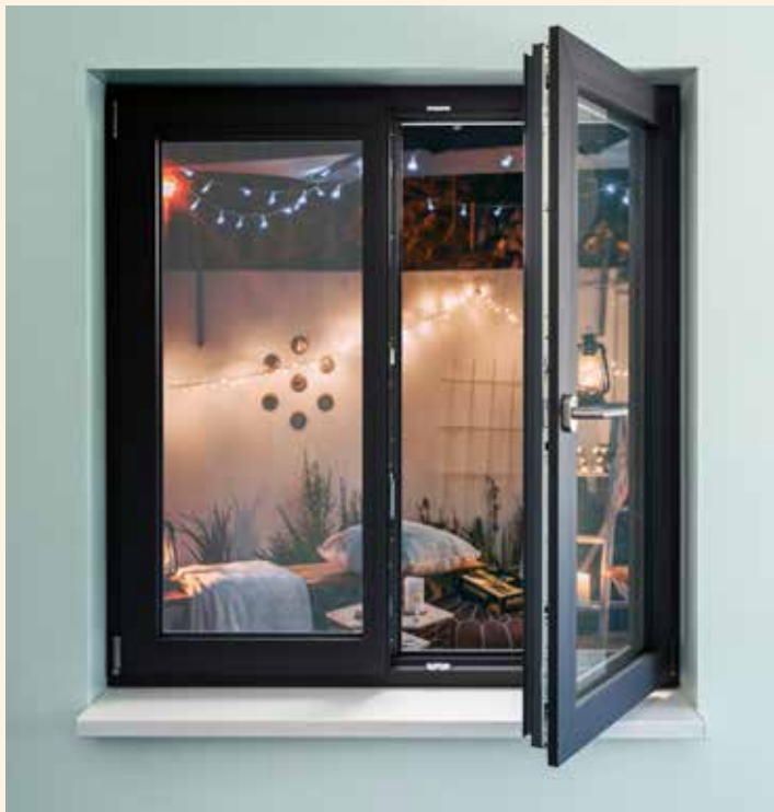
Im Winter gilt: Fenster kurz ganz auf und Heizung aus.

Das Wichtigste ist der gründliche Luftaustausch, ohne dass die Wohnung auskühlt. Immerhin gibt ein Vier-Personen-Haushalt täglich etwa sechs bis zwölf Liter Wasser ab. Zu viel Feuchtigkeit kann Schimmel auslösen, wenn diese auf zu ausgekühlten Innenraumbooberflächen kondensiert und nicht zügig nach außen gelangt. Wer lüftet, sollte daher am besten stoßlüften und querlüften – also die Fenster so weit wie möglich öffnen. Das sorgt schnell für frische Luft und geringere Luftfeuchtigkeiten. „Andererseits als häufig befürchtet, werden die Innenwände durch umsichtiges