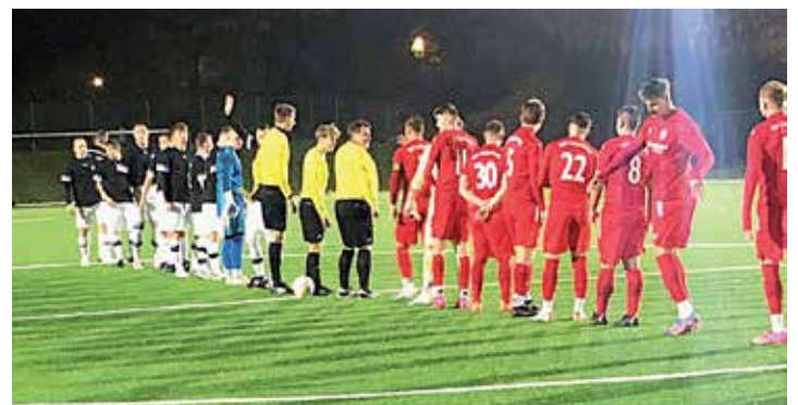
Die Zweite vom Heikendorfer SV und der TSV Lütjenburg standen sich am Freitagabend gegenüber.

man kaum Chancen zu. Offensivaktionen hörten vor dem 16er auf, keine 100%igen zu vermerken.