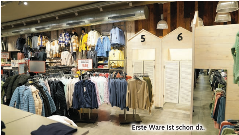
Erste Ware ist schon da.

26. – 28.10.: 9 bis 20 Uhr 29.10.: 11.00 bis 17.00 Uhr 30.10.: 9.00 bis 20.00 Uhr 31.10.: Reformationstag 11.00 bis 17.00 Uhr