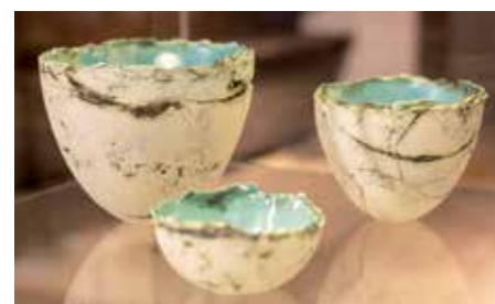
Paperclay-Schalen von Renate Löding in der Ausstellung „Vielschichtig“ im Probstei Museum Schönberg

die Gemeinde Schönberg und der Museumsverein freuen sich über Ihren Besuch.