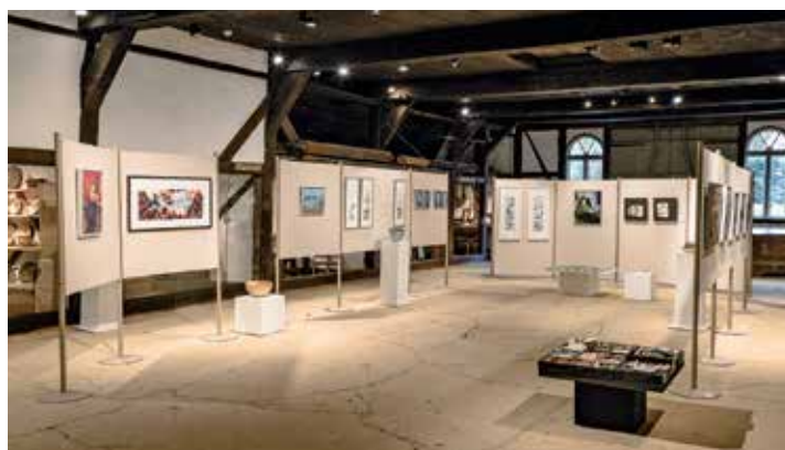
Blick in die Ausstellung „Vielschichtig“ im Probstei Museum Schönberg

steht, Kunstgespräche zu führen und nähere Informationen zu den ausgestellten Arbeiten aus erster Hand zu erhalten. Weiterhin ist im Probstei Museum auch die Sonderausstellung „Im Sonntagsstaat zum Fotografieren – Historische Ansichten norddeutscher Trachten“ mit einzigartigen Fotos von Men-