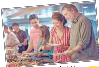
Skandinavische Spezialitäten in allen Hotels

Traum-Rundreise mit Hardangerfjord • Geirangerfjord mit Kreuzfahrt • Sognefjord • Hansestadt Bergen • Oslo • Kopenhagen • 2-Bett-Kabinen auf den Fähren