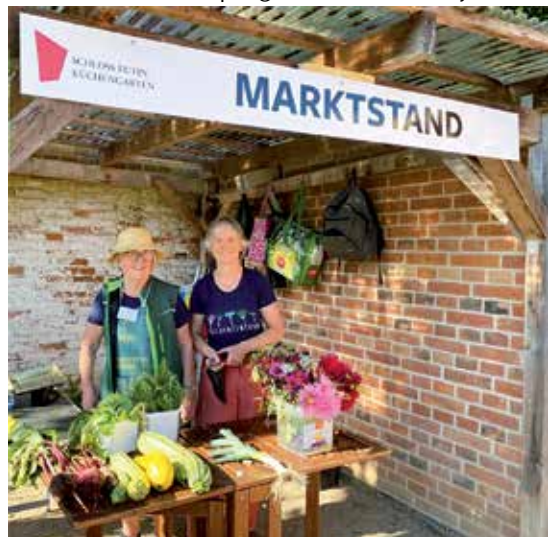
Am Marktstand gibt es die herbstliche Ernte aus dem Küchengarten.

den 6. Oktober, 15 Uhr ist der letzte Termin für die herzlichen Gespräche und Fachsimpeleien. Die Arbeit im Küchengarten ist damit jedoch nicht beendet.