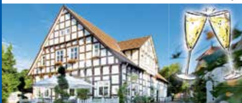
Histor. Fachwerk-Hotel in Top-Lage