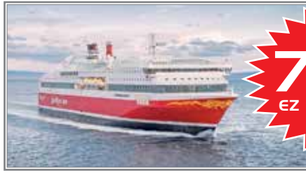
Norwegen-Kreuzfahrt direkt nach Bergen