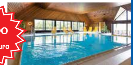
Hallenbad im Hotel