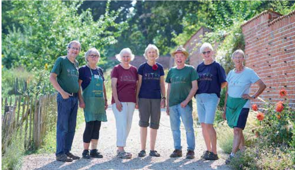
„Der Küchengarten stellt sich vor“ - Zum letzten Mal in diesem Jahr stehen die ehrenamtlichen Gärtnerinnen und Gärtner in ihren Beeten bereit für Gespräche, Austausch und Fachsimpelei.

Der Küchengarten versorgte einst das Schloss mit frischem Gemüse, Kräutern, Obst und prächtigen Blumen. Seitdem der Küchengarten restauriert und Beete mit alten, historischen Sorten wieder revitalisiert wurden, pflegen eh-