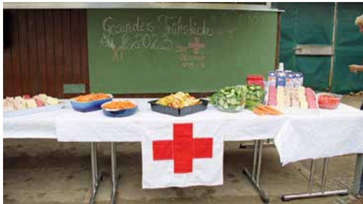
Das Buffet auf dem Schulhof der Grundschule Hansühn

eins mit den liebevoll zubereiteten Speisen und frischer Milch auf. Freuen konnte sich eine Woche später auch der Hansühner Kindergarten „Räuberhöhle“. Diesen beglückte der DRK-Ortsverein