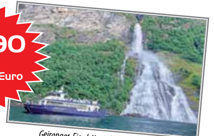
Geiranger-Fjord-Kreuzfahrt zu den weltberühmten Wasserfällen im Reisepreis bereits enthalten!