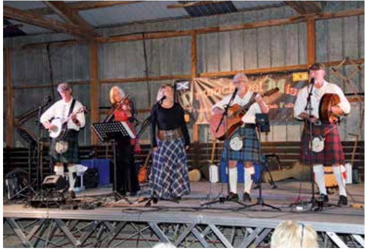
Die Band „Drumchapel Mist“

fer zurück: „Wir sind begeistert von der Organisation vor, während und nach dem Konzert. So wird es uns leicht gemacht, hier aufzutreten“. Mit Geschichten stimmten Kogel & Co. die Zuhörer auf die jeweiligen Lieder ein, um den Zugang zur Musik zu erleichtern. So wurde der Abend zu einer Reise über die Grüne Insel - wobei auch einige Abstecher in die schottischen Highlands nicht fehlten. Passend zum musikalischen Programm sorgten die Veranstalter für das leibliche Wohl: So durfte das Guinness natürlich nicht fehlen. Zu essen gab es typische Suppe mit Lamm und Gemüse.