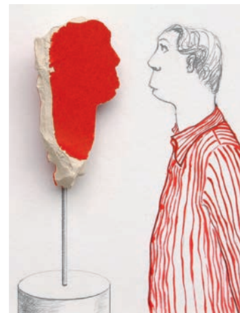
Im Atelier Weifenbach-Siefer in der Marktwiese in Lütjenburg finden Sie Objekte, Fotoarbeiten und Installationen