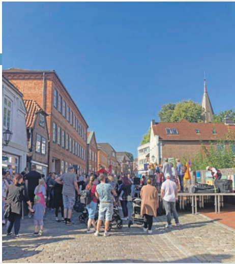
Schon gleich morgens war das fröhliche Fest gut besucht

WIR SIND MITGLIEDER DER WIRTSCHAFTS VEREINIGUNG HANDWERK – HANDEL UND GEWERBE E.V.