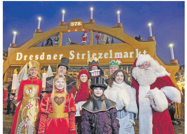
Einer der schönsten Weihnachtsmärkte in der Nähe des Kurier-Hotels ist der weltberühmte Striezelmarkt in Dresden.

Hotel in Best-Lage direkt an der Altstadt mit 3 x reichhaltigem Schlemmer-Frühstück vom Buffet, 2 x Abendessen im Hotel als 3-Gang-Menü, 1 x festliches Weihnachts-Buffet am Heiligabend, ein Begrüßungscocktail mit der Direktion & ein kleines Weihnachtspräsent aus Dresden, sowie der Heiligabend-Kaffee-Nachmittag mit Glühwein & Original Dresdener Stollen. Weiter gehört eine große Stadt-