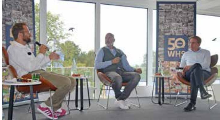
In der kurzweiligen Talkrunde wurden die wichtigen Themen für die Tourismusregion Schleswig - Holstein diskutiert