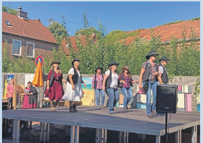
Bestens unterhalten wurden die Zuschauer:innen von dieser Line Dance Gruppe

war etwas dabei, ob es nun die Hüpfburgen für die Kleinsten waren, der Flohmarkt oder die Kirchenführungen. Und natürlich wur-