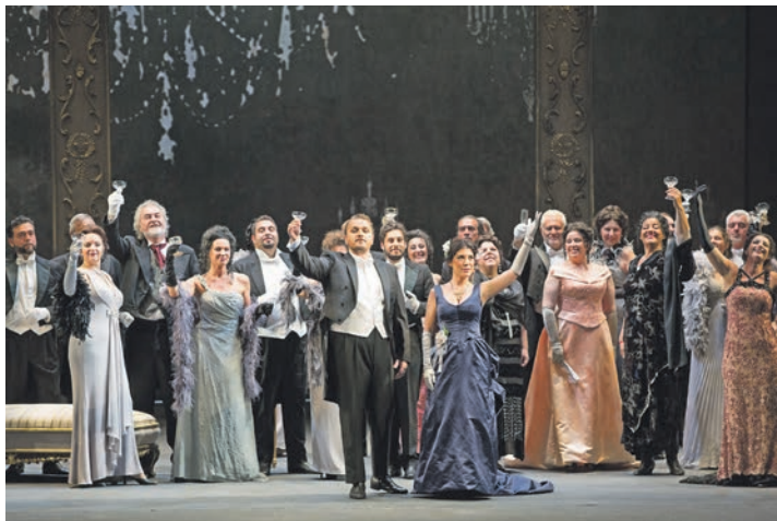
Glanzvoller Opern-Genuss in der Semper Oper erwartet unsere Leser*innen mit Puccinis „La Bohème“.

Aufpreis in allen Kategorien buchbar! Zum großen Leistungspaket zum sehr günstigen Komplettpreis von nur 399,90 Euro (Einzelzimmer + 99,00 Euro) gehören die Fahrt im erstklassigen Fernreisebus ab Oldenburg, Lütjenburg und Lensahn, sowie 3 Übernachtungen im Komfort-