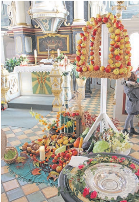
Kirchenraum zum Erntedankfest

Kiel. (do) Der goldene Herbst bricht an, die Blätter färben sich bunt, es wird neblig und kühler. In dieser Jahreszeit ist eine Tour auf dem 530 Kilometer langen Radfernweg Mönchsweg besonders abwechslungsreich und farbenfroh. Denn rund um das Erntedankfest am 1. Oktober wird im Norden die Dankbarkeit für das Gedeihen und Einbringen der Früchte, des Gemüses und des Getreides gefeiert. Überall am Mönchsweg von Bremen bis Fehmarn finden Erntedank-Gottesdienste statt. Die Kirchen und Altäre sind mit frischen Feldfrüchten und Erntekronen herrlich geschmückt. Vielerorts können sich BesucherInnen auf plattdeutsche Gottesdienste und besondere musikalische Begleitung freuen. Die Nordkirche bietet auf ihrer Website eine Übersicht der Erntedank-Gottesdienste an. Rund um das Erntedankfest können Radreisende auf dem