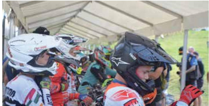
Die Junioren bereiten sich auf den Lauf vor.

Spies abtreten, der in Tensfeld brillierte. Schon in der Qualifikation konnte er seine erste Pole-Position erreichen und fuhr im ersten Wertungslauf auch gleich den Sieg ein. Der zweite Wer-