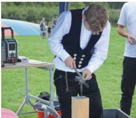
an den vielen Ständen konnten die Gäste unter anderem ihr handwerkliches Geschick versuchen.