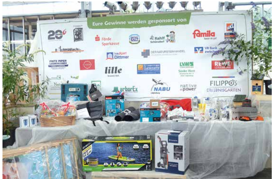
Bei der Tombola gab es tolle Preise von vielen Geschäftspartnern zu gewinnen.