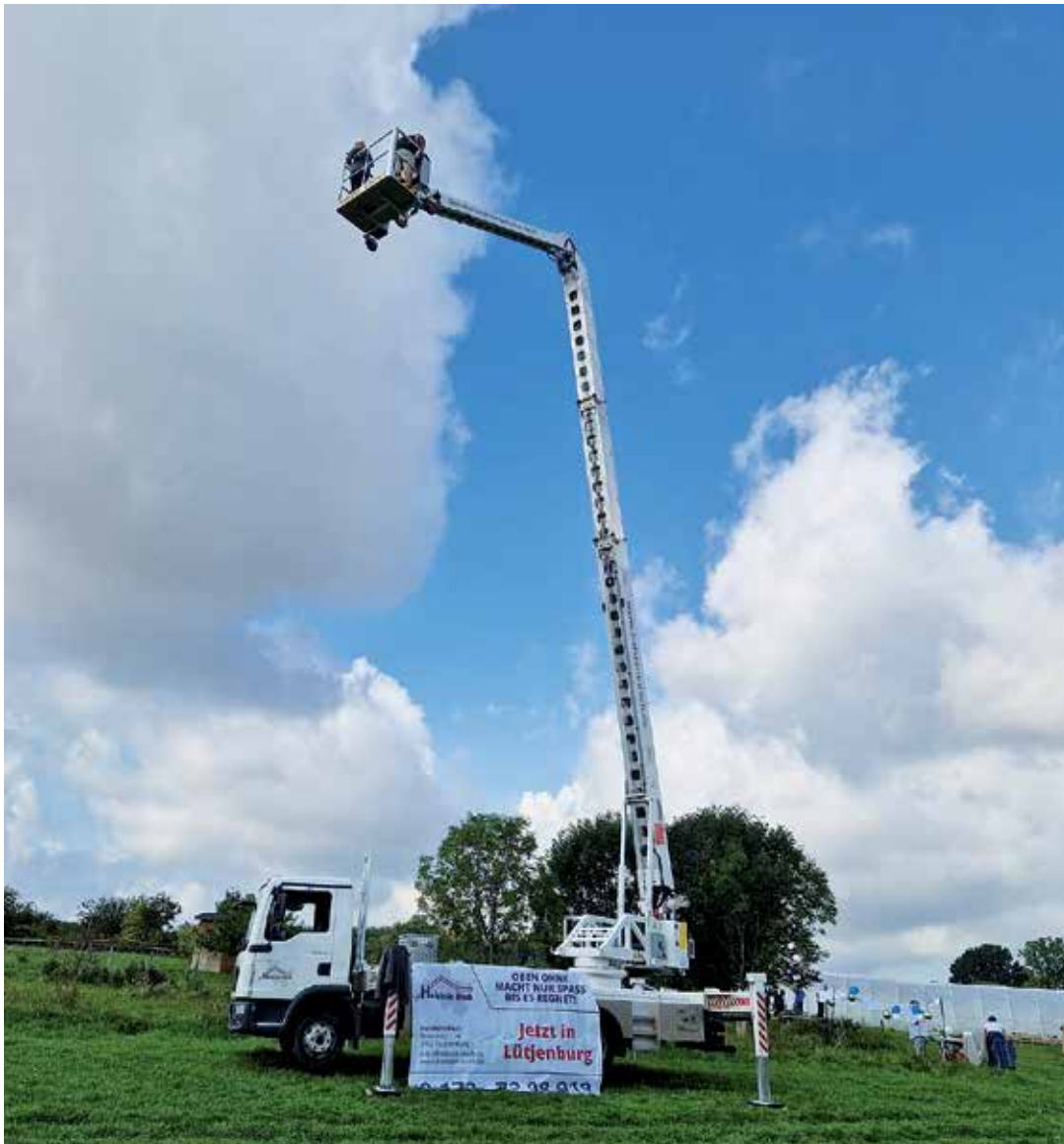
Hoch hinaus ging es mit Holstein Dach.