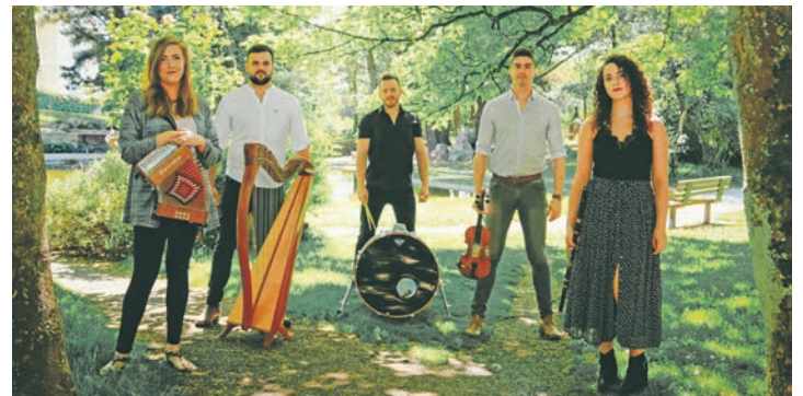
Billow Wood

Die fünf Musiker der Band schreiben den überwiegenden Teil ihrer Songs selbst. Die Songs werden