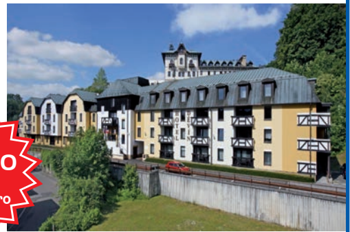
Comfort-Hotel in Marienbad