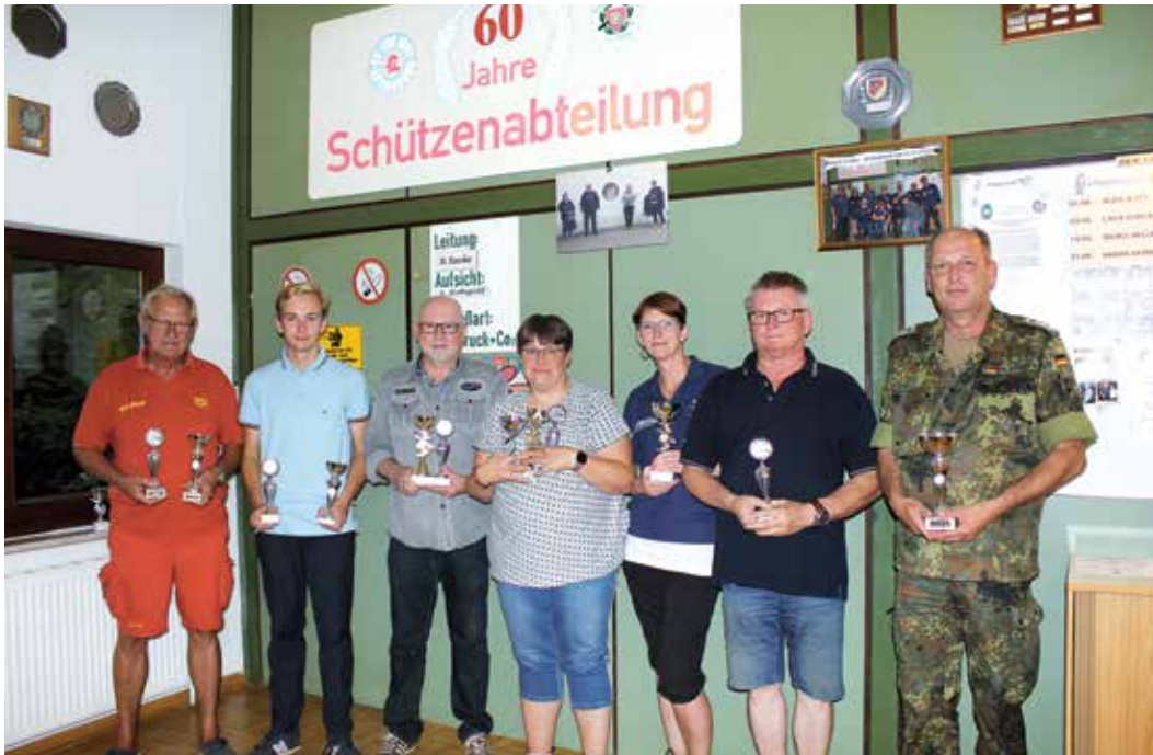
Die Gewinner des Vorjahres

Lütjenburg. (sr) Die Schützenwochen starten in diesem Jahr am 23.08. – 25.08. für die Schützenvereine aus dem Kreis Plön und befreundete Vereine außerhalb des Kreises. Diese Vereine kämpfen um die zahlreichen Pokale. Im Anschluss folgt in der darauffolgenden Woche vom 29.08. – 01.09.2023 das Pokalschießen für die Firmen, Verbände, Gilden, Jugendgilden, Feuerwehren, Jugendfeuerwehren und der Bundeswehr. Geschossen wird jeweils von