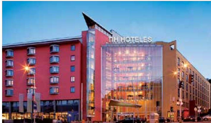
Eines der besten Hotels der Stadt erwartet unsere Leser*innen mit dem luxuriösen NH-Hotel in Prag.

Genießen Sie auf Schritt und Tritt Geschichte und Kultur, denn nirgendwo auf der Welt ist ein historischer Stadtkern in derar-