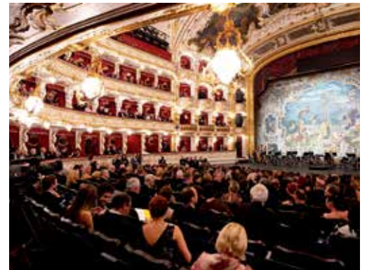
Eines der schönsten Opernhäuser in Europa: Die komplett restaurierte Oper Prag im Herzen der Stadt.

04521/7011-30, Montag bis Freitag von 9 bis 13 Uhr, oder per Mail unter „leserreisen.der-reporter.info“.