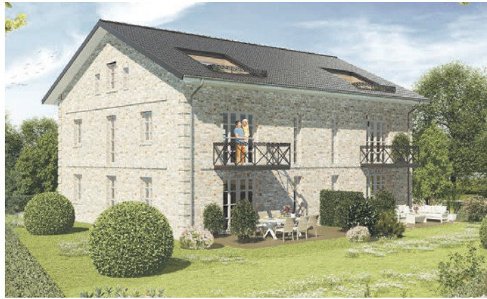
Südsicht mit Garten. (Grafik: Simon-Wohnkonzepte).

kleines Bistro/eine Eventlocation für private Feierlichkeiten sowie Veranstaltungen umgebaut und ein „Treffpunkt zum Wiederkommen“ werden. Auch Co-Working + Workaction ist möglich, somit können Synergien durch Gemeinschaft in vielfältiger Form geschaffen werden. Durch dieses Gesamtkonzept wird eine Option ermöglicht, gemeinsam, aber räumlich etwas getrennt, Urlaub mit Freunden/Partner und Familie individuell zu gestalten. Meer, Zeit, Ruhe, Entspannung und Natur wird hier an erster Stelle stehen. Einfach die Seele baumeln lassen und sich wie zu Hause fühlen in gemütlich eingerichteten Feriendomizilen mit einer sehr persönlichen Betreuung vor Ort. Die Organisatoren und Veranstalter von „Simon Wohnkon-