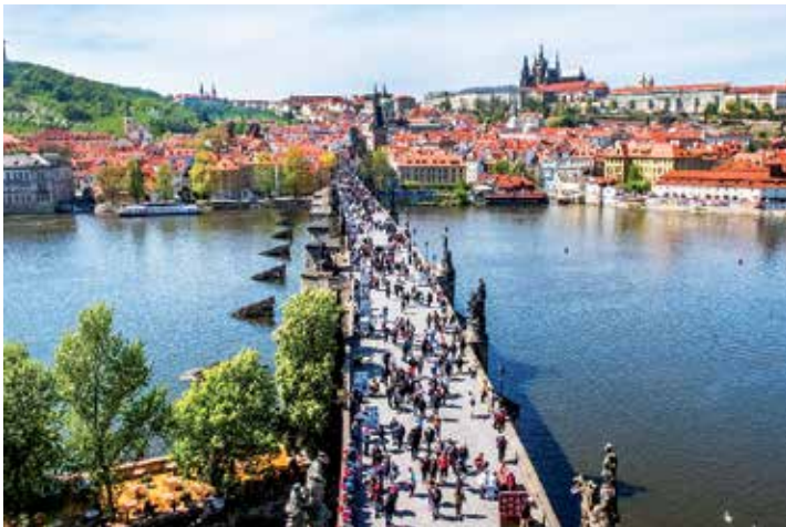
Die „Goldene Stadt“ Prag genießen unsere Leser*innen zum Superpreis zu Top-Terminen.

Anmeldungen und Buchungen sind ab sofort möglich bei den Kurier-Leser-Reisen des Burg-Verlages in Eutin per Telefon