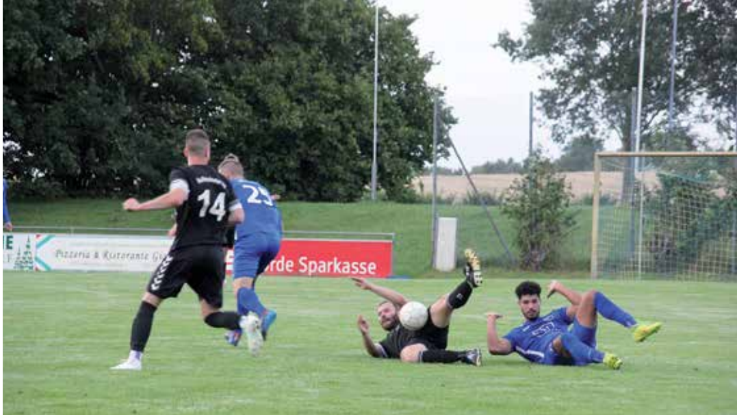
Spannende Zweikämpfe beim Spiel Dobersdorf-Heikendorf I

Auswärtsdreier. Putlos hatte an den letzten Spieltagen gegen die SG Dobersdorf/P'hagen Stärke bewiesen und trat mit einem 5:1 die Heimreise an. Das Match beim noch Tabellenzweiten machte das deutlich. Nun standen die Dobersdorfer auf dem eigenen Dieter von Borstel Sportplatz in Tökendorf der zweiten Mannschaft des Heikendorfer SV gegenüber. Beide waren noch Nachbarn im Mittelfeld mit jeweils drei Punkten. Mit einem 5:2 (2:1) wurde das geändert. Bereits nach drei Minuten musste die Zuschauer