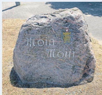
Moin, moin Berliner Eck