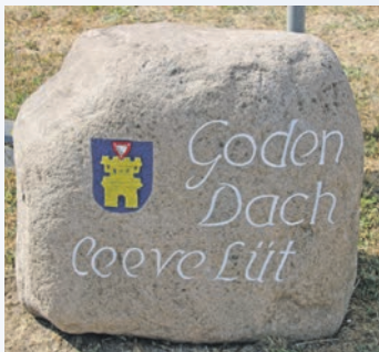
Der Stein bei Familia