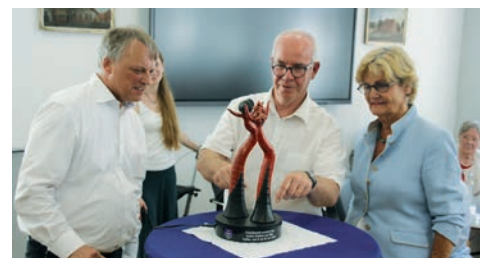
Von der französischen Delegation gab es als Geschenk eine schöne Skulptur.