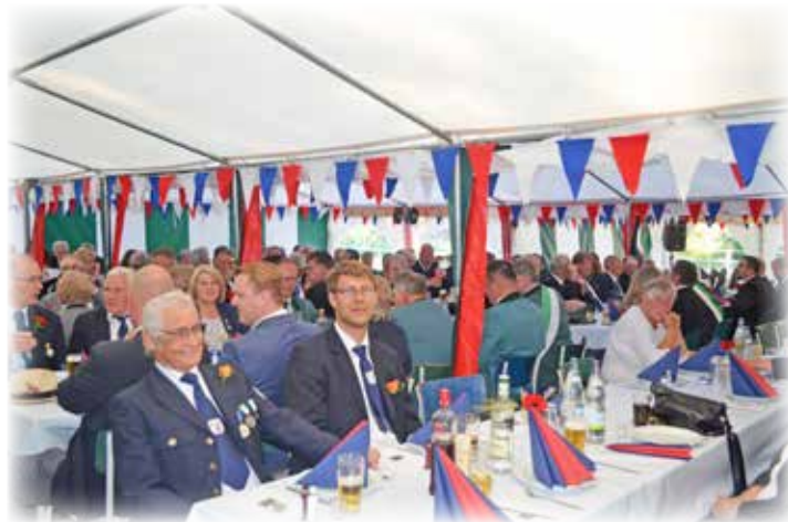
Fröhlich wurde im gut besuchten Festzelt gefeiert

top fein und akkurat ist, das Gildehaus – gerne scherzhaft neudeutsch „Eventschuppen“ genannt - im besten Zustand ist und auch die Gildebrüder aus Kaköhl über die Kreisgrenzen hinaus sehr beliebt und bekannt sind, kennt man sie doch als trinkfeste „Feierbiester“. So steht dann einem fröhlichen Gil-