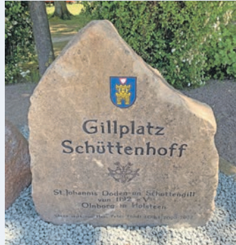
Der neue „Gildeplatz Schüttenhoff“ Stein am Schützenplatz