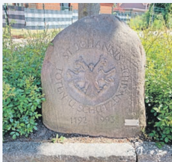
Der Gildestein in der Kleinen Schmützstraße