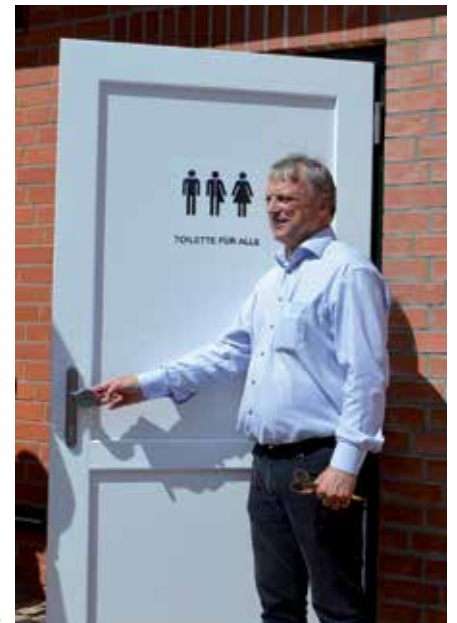
Bürgermeister Dirk Sohn vor der Tür mit dem Piktogramm für alle Geschlechter.

le Türe aufschließen- und abschließen am Morgen und Abend entfällt. Ab jetzt sind diese elektronisch gesteuert und öffnen sich um 6.00 Uhr morgens automatisch bzw. schließen sich um 22.00 Uhr. Aus umweltschutztechnischer Sicht ist es ein großer Fortschritt, dass nun keine Papierhandtücher mehr Verwendung finden, sondern moderne Luft-