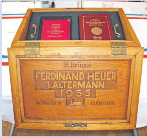
Die Hauptlade der Oldenburger St. Johannis Toten- und Schützengilde

Oldenburg. (jbr) Schon im Alten Testament ist von der Bundeslade die Rede, ebenso haben die Handwerksinnungen bis heute Läden. In der Hauptlade der St. Johannis Toten- und Schützengilde von 1192 e.V. befinden sich die wichtigsten Unterlagen und Utensilien. Vor der geöffneten Gilde finden die Versammlungen statt, oder es wird Gericht gehalten. Bei jeder offiziellen Zusammenkunft der Gilde wird mit der Armenbüchse für bedürftige Mitmenschen