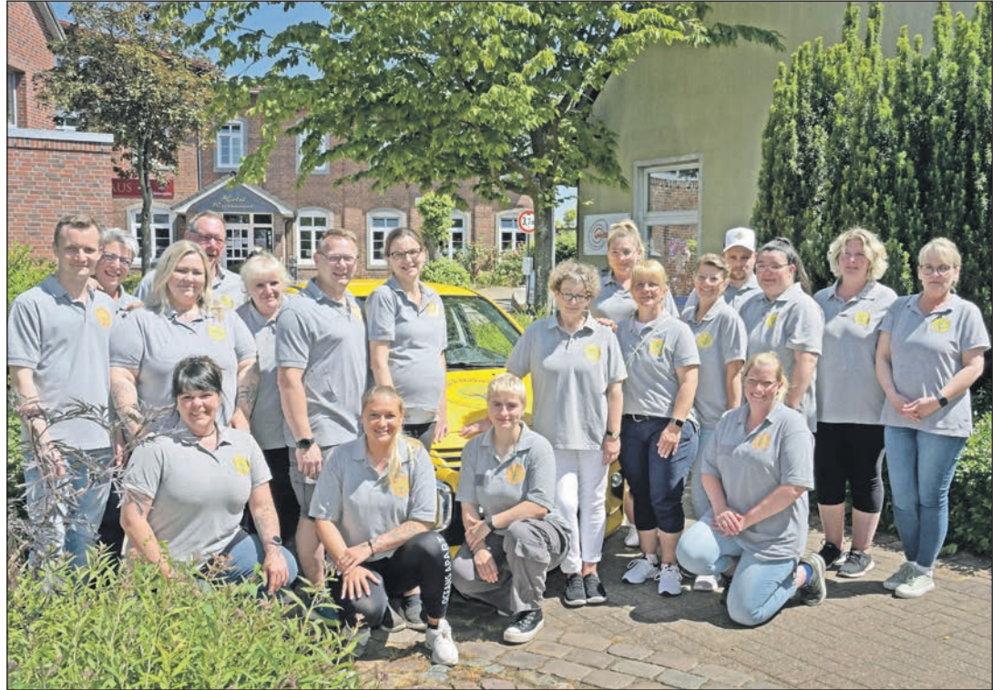
Ein starkes Team: die Mitarbeiter des Pflegedienstes Harmonie Zu Hause pflege-beraten-betreuen in Schönberg.

Zum vielseitigen Leistungsspektrum des Pflegedienstes Harmonie zählen die Behandlungspflege, etwa die Wundversorgung von Patienten, Insulingaben, das Blutzuckermessen oder das Anziehen von Kompressionsstrümpfen. Die Leistung der Körperpflege umfasst Duschen oder das Waschen im Bett bis hin zur Inkontinenz-