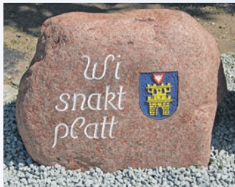
„Wi snackt platt“ am Schützenplatz