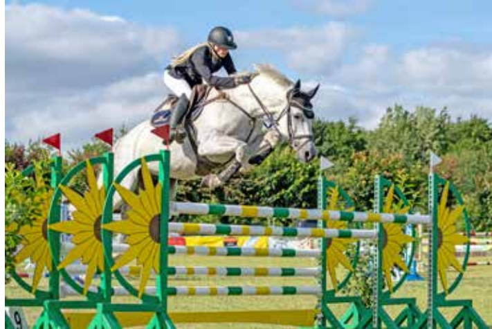
Mit dem neu aufgebauten Gras-Springplatz bietet der Verein wieder das Bestmögliche, für anspruchsvolle Wettkämpfe.

Nun geht es mit dem Sommerturnier in die zweite Runde. „Für den kommenden Termin steht der Gras-Springplatz wieder zur Verfügung, der nach dem Neuaufbau im Vorjahr für das erste Turnier des Jahres noch nicht beritten werden durfte. Dementsprechend können wir das gewohnte Programm an Springprüfungen anbieten,“ erläuterte