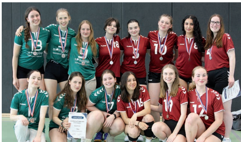
Ostholsteiner Volleyballerinnen - Links SVG Pönitz, rechts VfL Bad Schwartau

Heide. (pz) Heide, der Marktstadt im Nordseewind war in diesem Jahr der Austragungsort des Landescup im Volleyball der U20w. Für dieses Event haben sich auch zwei Mannschaften aus Ostholstein, der VfL Bad Schwartau und der SVG Pönitz, qualifiziert. Gleich in der Vorrunde trafen die beiden Mannschaften in der Gruppenphase aufeinander. Das Spiel im Nachbarschafts-Derby konnten die Pönitzer auf ihrer Seite mit 2:1 (30:32/25:17/15:12) verbuchen. Voller Dramatiker waren die nach-