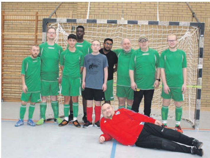
Die Sportfreunde Oldenburg belegten den 2. Platz

es nicht. Nach dem Finale, um 14.10 Uhr, standen die Platzierungen dieses Fun-Turnieres fest. Die Podiumsplätze belegten: 1. TSV Fissau, 2. Sportfreunde Oldenburg und 3. Integrationsmannschaft (Ansar and Friends). Auf den weiteren Plätzen folgen: 4. BSG zweite Herren, 5. Jugendhilfshaus Lensahn und Die Brücke Lübeck und Ostholstein, 6. Fußball Walking Team B und 7. Fußball Walking Team A. Dieser Sonntag endete nach erfolgter Bewegung gegen 14.30 Uhr.