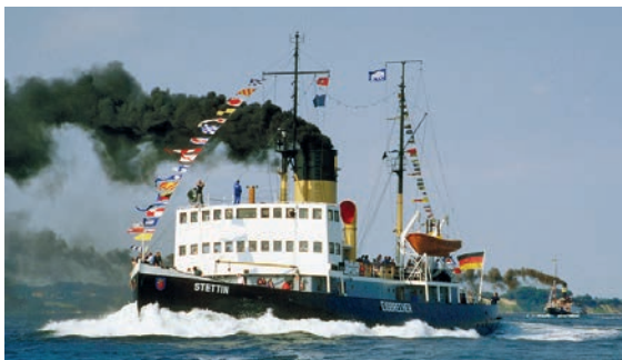
Unter Kurier-Flagge auf großer Volldampf-Kreuzfahrt geht es für unsere Leser zur berühmten Kieler Woche.

se ab Oldenburg und Lensahn startet die große Nord-Ostsee-Kanal-Kreuzfahrt in Rendsburg auf einer der weltweit am stärksten befahrenen Wasserstrassen der Welt mit einem zünftigen Bord-Frühstück für alle Leser und der Kurs der fünfstündigen Erlebnis-Kreuzfahrt führt mit vielen fachkundigen Erklärungen und Besichtigungen der Schiffs-Technik und der Brücke an Bord nach Kiel zur Schleusung in die Kieler Förde. Mit voller Kraft und kräf-