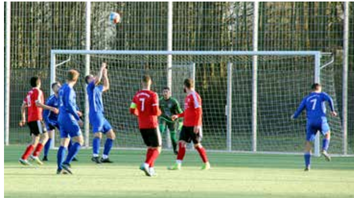
Die Lütjenburger dominierten das Freundschaftsspiel gegen Dobersdorf/Phagen mit vielen Toren in der zweiten Halbzeit.

Fünf Auswechslungen zum Start in die zweite Spielhälfte bei den Dobersdorfern, lediglich eine bei /m TSV. Die Gastgeber kamen immer besser ins Spiel, obwohl sich DSV/Hagen auch einige gute Möglichkeiten erkämpfte. In der 53. Minute setzte Hübner das Leder zum 3:1 in die Maschen. Nur eine Minute später dann das 4:1 durch Zimmermann. Als noch eine Viertelstunde zu spielen war begann das unerwartete „Schützenfest“ für die Heim-