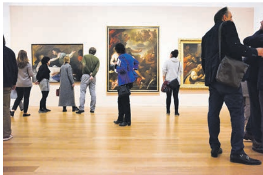
Welt-Kunst vom Feinsten erwartet unsere Leser in Potsdam und Berlin bei der großen Kunst-Sonder-Reise vom 17. bis 18. Juni 2023

Anmeldungen zu dieser ganz besonderen Zusatz-Kunst-Reise sind ab sofort möglich bei