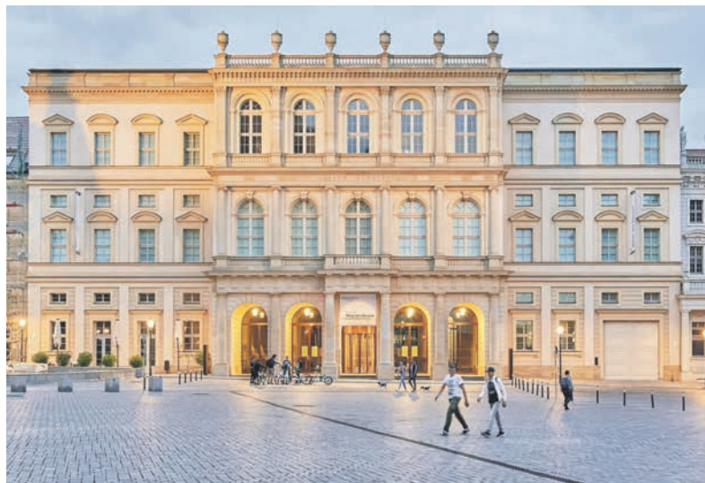
Europas spektakulärstes Kunst-Museum: Das „Barberini“ im Herzen von Potsdam

(t) Weltklasse-Kunst vom Feinsten genießen die Kurier-Leser:innen auf Grund großer Nachfrage bei der grossen Zusatz-Kunst-Weekend-Sonder-Reise direkt ab Oldenburg und Lensahn nach Potsdam und Berlin vom 17. bis 18. Juni 2023 zum Sonderpreis von nur 199,90 Euro mit Europas derzeit spektakulärstem Kunst-Museum in Potsdam mit dem Barberini-Museum mit der gerade neueröffneten großen Sonder-Ausstellung „Sonnen. Die Quelle des Lichtes in der Kunst“. Die einmalige Bilderschau versammelt mehr als 80 Kunstwerke von der Antike