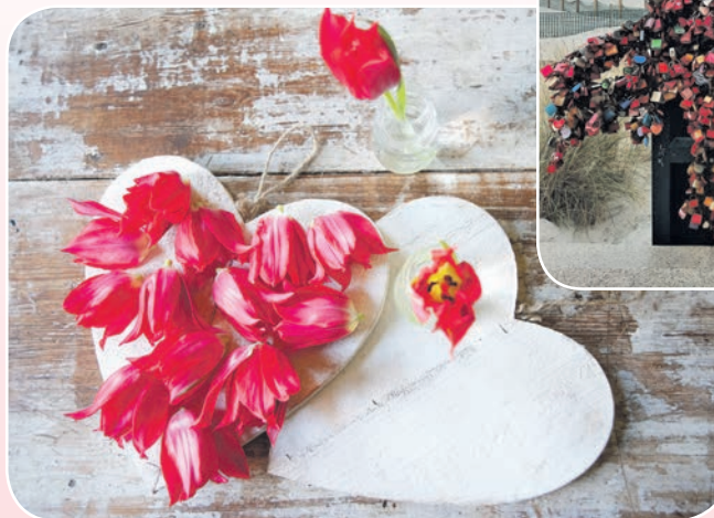
Nicht vergessen: Am 14. Februar ist Valentinstag

aber nicht direkt vor der Partnerin oder dem Partner mit einem Ring in der Hand auf die Knie fallen möchte, kann an diesem Datum seine Zuneigung durchaus auch anders bekunden. Das zeigen zahlreiche Traditionen aus