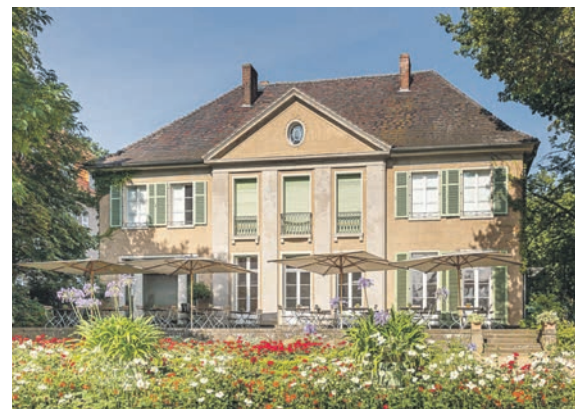
Die berühmte Liebermann-Villa am Wannsee entdecken unsere Leser mit einer großen Sonder-Führung (Liebermann)

den Kurier-Leser-Reisen des Burg-Verlages in Eutin, täglich von 9 bis 13 Uhr, unter Telefon 04521/701130 oder direkt per E-Mail leserreisen@der-reporter.info .