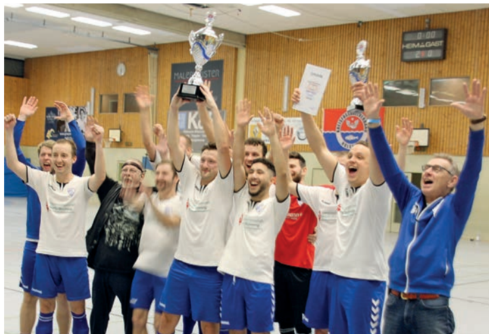
Ausgelassene Stimmung bei der Siegermannschaft TSV Plön

Sonntag. In der Gruppe 1 kamen die Plöner weiter und TS Einfeld. TSV Lütjenburg, ASV Dersau und der Preetzer TV schafften es nicht in die Finalsiege einzuziehen. In Gruppe 2 schieden die Probsteier, Bösdorf und Wentorf aus. Ins Halbfinale zogen TSV Plön, der VfR Neumünster, TS Einfeld und TuS Nortorf ein. Das Neunmeterschießen im kleinen Finale um Platz 3 gewann VfR Neumünster mit 2:1 gegen TS Einfeld. TSV Plön gegen TuS Nortorf, das war das Endspiel am Sonntagabend, auf das sich so viele Fußballfans gefreut hatten. Die Plöner hatten ein tolles Fußballwochenende erwischt um in der eigenen Halle den Sieg im Hallenmasters zu feiern. Spelausschussobmann Michael Reich überreichte gemeinsam mit dem Vorsitzenden des KfV Holstein, Aslan Gastrock, den begehrten neuen Pokal. Bedankt wurde sich natürlich bei den Schiedsrichtern Janson, Kudrna, Yilmaz, Brandt, Ganz, Otto, Jessen und Hellriegel. Die Plöner waren für