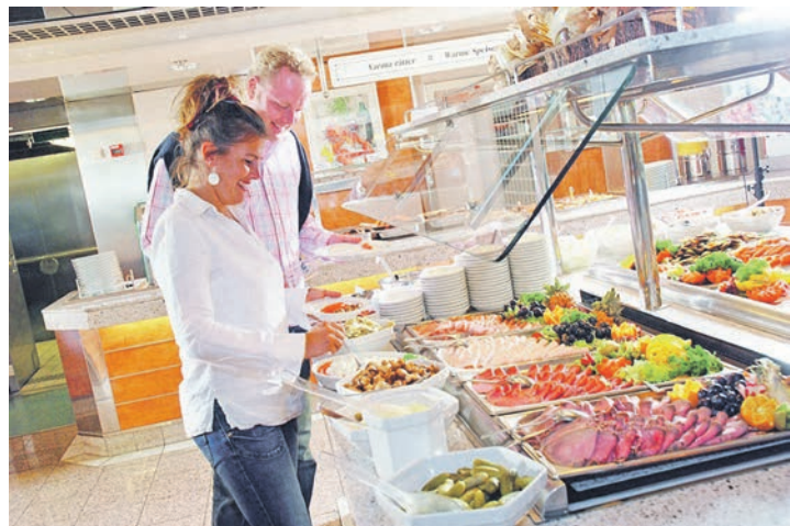
Mit schwedischen Spezialitäten werden unsere Leser an Bord der Großfähren auf der Hin- und Rückfahrt verwöhnt.

nach Schweden: Die Einschiffung von Bus und Fahrgästen erfolgt in Travemünde auf Entdecker-Kurs Nord. An Bord werden die Kurier-