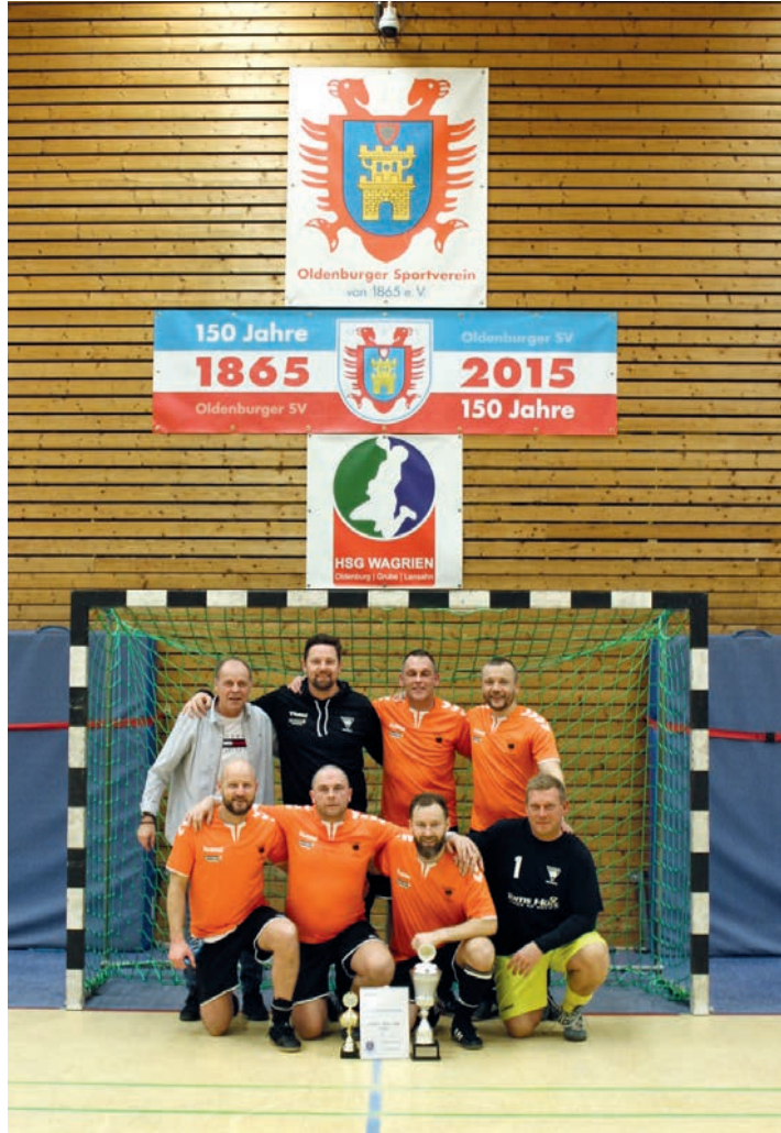
Das Sieger-Team aus Saksjøbing (Bild: L. Dittmann).

Oldenburg. (ld) Am Samstag, den 07.01.2023, fand er nach zwei Jahren Coronazwangs- pause wieder statt: Der beliebte