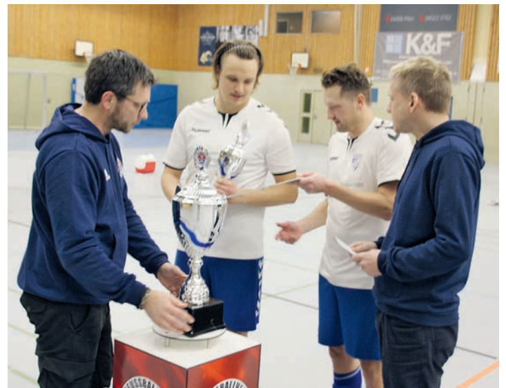
Pokalübergabe an den TSV Plön in eigener Halle