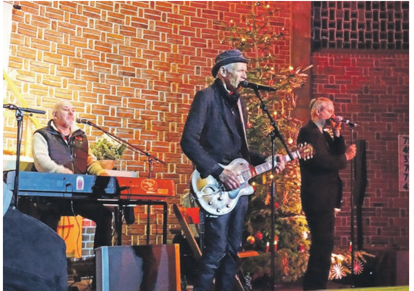
Stimmungsvolles Konzert in der Hohwachter Kirche

Und so konnten die vielen Zuhörerinnen und Zuhörer über 2 Stunden einen ganz besonderen Auftritt genießen, bei dem komplett die Musik im Vordergrund stand und es viel Szenenapplaus für die Soli gab. In kurzer Zeit wuchs die Band mit