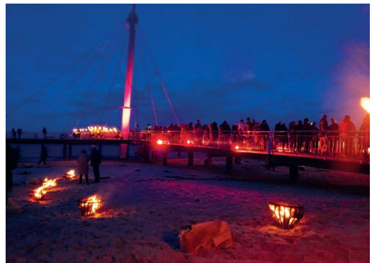
Auch zahlreiche Feuerkörbe sorgten zusätzlich für eine festliche Stimmung

Wünschen, Erwartungen und Hoffnungen dem Meer zu übergeben. Danach genossen die Besucherinnen und Besucher diesen schönen Neujahrsabend bei dem ein oder anderen Ge-