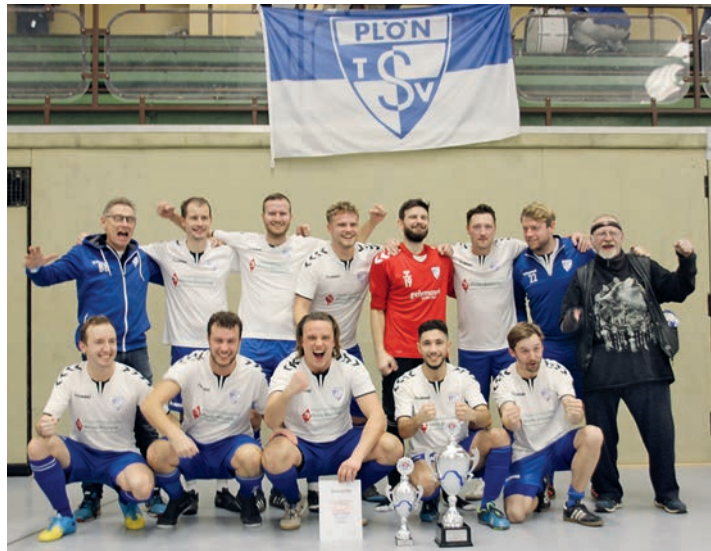
Die Gewinnermannschaft des TSV Plön

für die Endrunde qualifizieren in den Gruppen A, B, C, D und E. Die Spielstärke betrug: Torwart und vier aktive Spieler. Auf der Ersatzbank nur fünf Auswech-