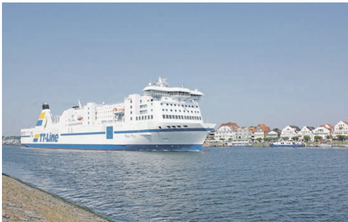
Zum einmaligen Jubiläumspreis Kurs Schweden mit den großen Jumbo-Fährschiffen der TT-Line.

Leser mit schwedischen Schlemmer-Spezialitäten preisinklusive rundum verwöhnt und Sie genießen die komfortable Überfahrt auf dem Jumbo-Liner mit kostenloser Benutzung der herrlichen Sonnendecks zum Entspannen. In Malmö erwartet die Kurier-Gäste sodann ein neues internationales Komfort-Top-Hotel im