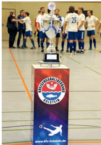
Der umkämpfte Pokal