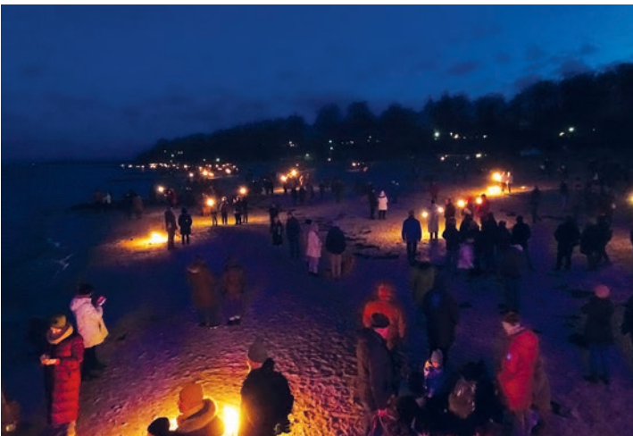
Viele Menschen fanden den Weg an den Ostseestrand, um stimmungsvoll den Neujahrsabend zu genießen

aber auch Urlauberinnen und Urlauber fanden sich ein, um mit Fackeln von Alt Hohwacht bis zur „Flunder“ zu wandern. Viele hatten auch zuvor die „Wunschsteine“ erworben, um diese mit den anvertrauten