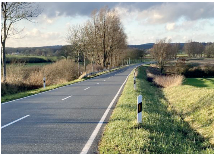
Die K45 zwischen Hohwacht und Sehlendorf

Kosten werden vom Land zu 70% und vom Kreis mit 30% getragen. Der Radweg macht nicht nur die Strecke erheblich sicherer, sondern wird auch mehr Möglichkeiten schaffen, die Landschaft und die Natur zu sehen. Geplant sind Bänke, ein Kranichbeobachtungsturm und Info-Tafeln.“