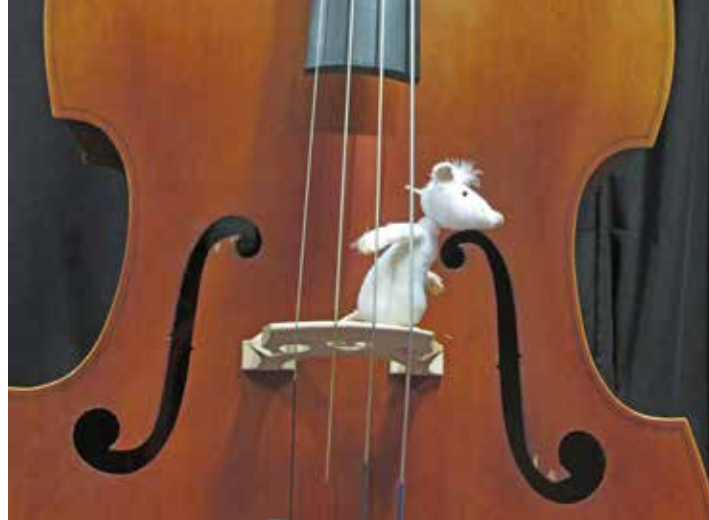
„Firiwizi Naseweis,,

Das Theaterstück ist diesmal ein poetisches Spiel um einen tönenden Kontrabass, welches ganz kleine Zuschauer auf besondere Weise verzaubert. Mit