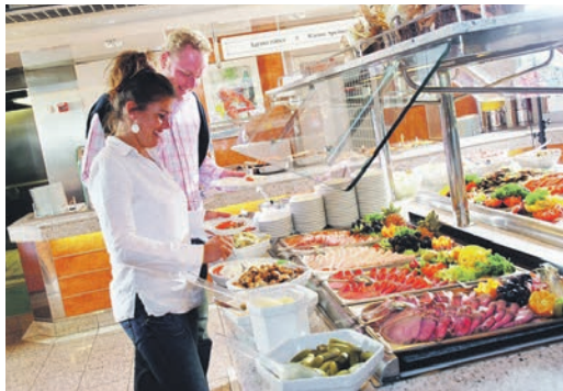
Mit schwedischen Spezialitäten werden unsere Leser an Bord der Jumbofährrschiffe verwöhnt

Zum großen Leistungspaket zum absoluten Jubiläums-Knüllerpreis von nur 199,90 Euro, gehören neben der Fahrt im erstklassigen Fernreisebus mit Waschraum/WC und Klimaanlage, ab Oldenburg und Lensahn, die „Ostsee-Kreuzfahrt“ von Travemünde nach Trelleborg mit TT-Line, inklusive der Einladung zum Mittagessen an Bord, mit einem schwedischen Spezialitäten-Teller. Anmeldungen sind ab sofort möglich im Leser-Reisen-Büro des Burg-Verlages in Eutin unter der Telefonnummer 04521-701130, täglich von 9 bis 13 Uhr, sowie per Mail unter „leserreisen@der-reporter.info“.