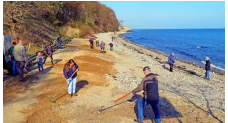
Großes Aufgebot am Eitz

Stürme des vergangenen Winters holten sich ihren Anteil von den Sommer-Bootsliegeplätzen. So galt es für alle Mann, tatkräftig mit anzupacken. Die Fa. LÜDTKE aus Oldenburg sorgte dankenswerterweise für eine prompte Lieferung des notwendigen Sandes und Kies für die Restaurierung. Innerhalb kürzester Zeit war das bereitliegende Material an den Liegeplätzen verteilt und glatt geharkt. Schließlich konnten die Boote von ihrem Winterplatz an den Eitzer Strand verbracht werden, wo sie bis in den Herbst ihren Platz haben. Von hier aus starten die Eitzer Sportfischer in die Hohwachter Bucht zum Angeln und sorgen bei interessierten Gästen für einige