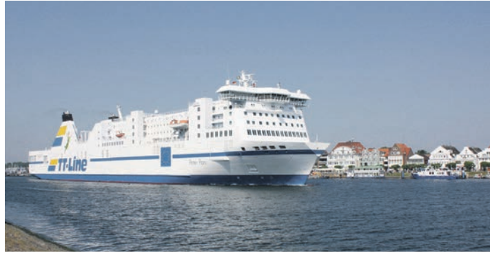
„Leinen los!“ zur Kurier-Kreuzfahrt zum besonderen Jubiläum „60 Jahre TT-Line auf der Ostsee“.

Oldenburg/H. (t) Ein sommerlicher Jubiläums-City-Trip voller Erlebnisse zum einmaligen Superpreis von nur 199,90 Euro erwartet die Kurier-Leser zum Top-Termin vom 15. bis 17. September 2022 mit einer 3-tägigen „Jubiläums-Kreuzfahrt“ mit Bus und Jumbofähren nach Schweden: Die Einschiffung von Bus und Fahrgästen erfolgt in Travemünde auf Entdecker-Kurs Nord. An Bord werden die Kurier-Leser mit schwedischen Schlemmer-Spezialitäten, die bereits im Reisepreis inklusive sind, rundum verwöhnt. Sie genießen die komfortable Überfahrt auf dem Jumbo-Liner mit kostenloser Be-