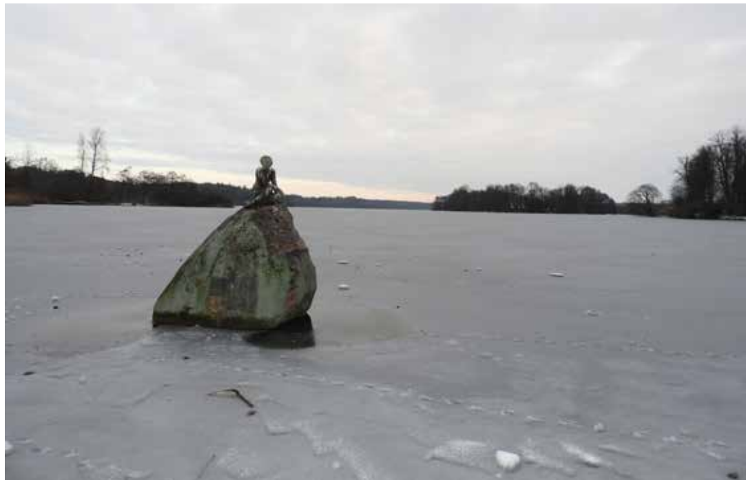
Trügerisch: Auch das Eis auf dem Großen Eutiner See trägt nicht.

schwallweise Wasser auf die Oberfläche tritt: nicht betreten. Wenn Sie bereits auf dem Eis sind: Flach hinlegen, um das Gewicht auf eine größere Fläche zu verteilen, zum Ufer robben (möglichst wenig ruckartige Bewegungen).