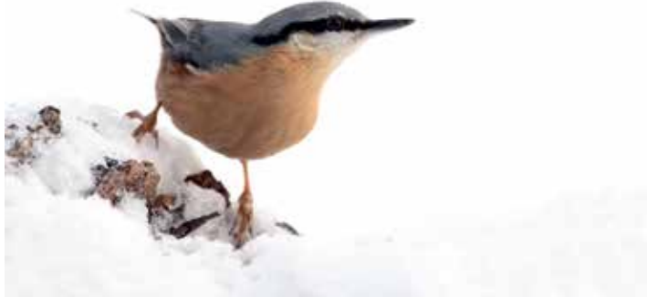
Ein Kleiber.

Hannover, Berlin. (nabu) Über 236.000 Menschen haben am Wochenende vom 8. bis 10. Januar an der 11. „Stunde der Wintervögel“ teilgenommen – ein sattes Plus von 65 Prozent zum Vorjahr. Auch in Niedersachsen haben mit fast 23.500 Teilnehmenden noch einmal gut 52 Prozent mehr mitgemacht als im landesweiten Rekordjahr 2019. Der NABU und sein bayerischer Partner, der Landesbund für Vogelschutz (LBV), freuen sich mit der heutigen Verkündung des Endergebnisses über die bundesweite Rekord-Teilnahme.