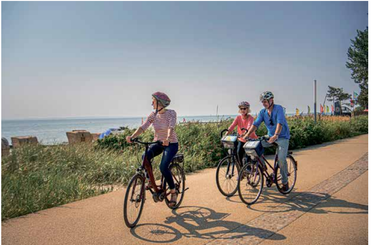
Der Ostseeküstenradweg gewinnt den Bike&Travel Award 2021 in der Kategorie „die beliebtesten Genussstouren“.

stein-Tourismus e. V. Diese und weitere Routen sind online unter www.ostsee-radfahren.de sowie bei Outdooractive und komoot zu finden.