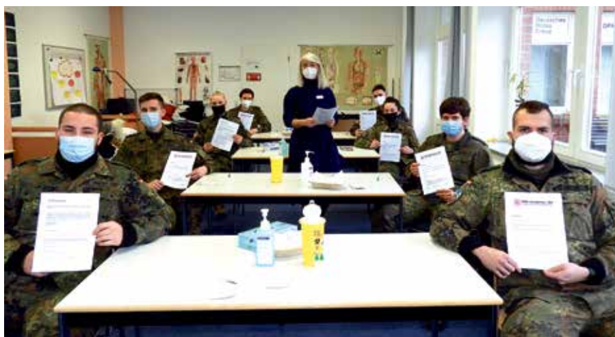
Bestanden: Mit ihren Zertifikaten konnten die Soldat*innen schon am nächsten Tag ihre Test-Arbeit aufnehmen.