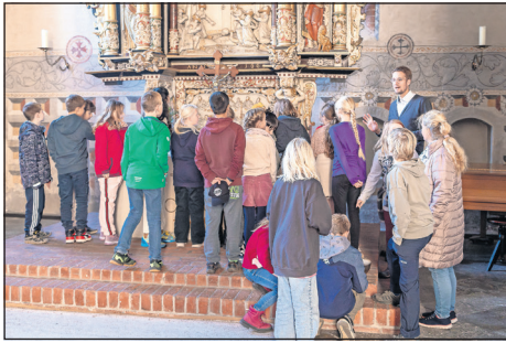
Die Kinder lauschten aufmerksam den Erklärungen des Pastors vor dem Altar der Stadtkirche.

Eine tolle Möglichkeit, Unterricht praktisch in einem historischen Gebäude zu erleben, bot sich den Kindern einer 4. Klasse der Grundschule Neustädter Bucht.