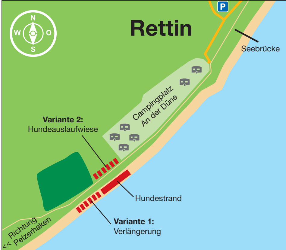
Der Ortsbeirat Rettin hat zwei Varianten erarbeitet: Die Verlängerung des Hundestrandes oder eine neue Hundeauslaufwiese. Ziel ist es, die Kapazität für die wachsende Zahl an Hundehaltern mit ihren Vierbeinern zu erhöhen und Gäste zu halten.

DER REPORTER Jetzt mit Push-Funktion „App-Nutzer haben mich schon gelesen“