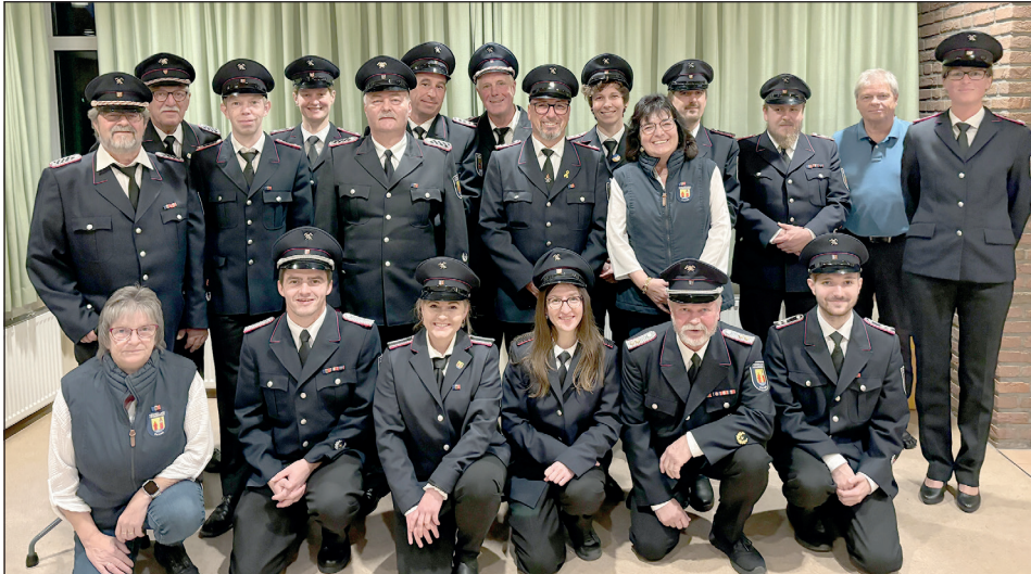
Ehre, wem Ehre gebührt - die Kameradinnen und Kameraden der Freiwilligen Feuerwehr Dahme.