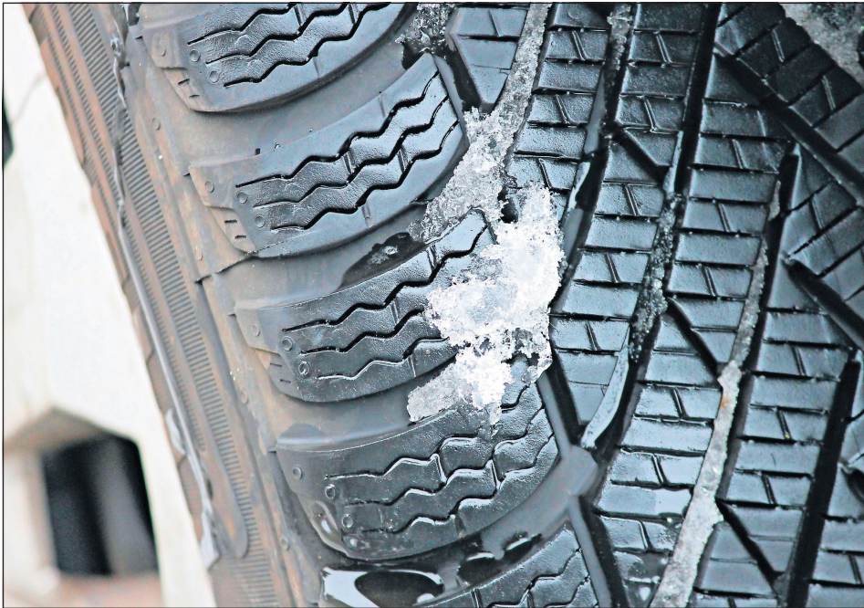
Bei „Glätteis, Schneeglätte, Schneematsch, Eis- oder Reifglätte“ sind in Deutschland laut der Straßenverkehrs-Ordnung Winterreifen Pflicht.

Alle Jahre wieder: Spätestens beim ersten Schneefall rennen Autofahrer den Werkstätten die Türen ein. Nur, um noch einen Termin für den Reifenwechsel zu ergattern. Auch sonst sind viele Pflichten, Vorschriften und Empfehlungen in punkto Winterreifen im Laufe des Jahres schnell vergessen. Was Autofahrer jetzt wissen müssen.