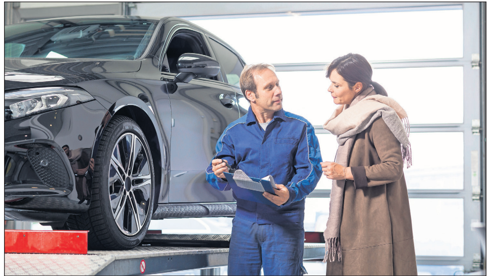
Der Winter steht vor der Tür, das Auto sollte vor dem Temperaturabfall noch einmal durchgecheckt werden.

Sie sind im Winter die Problemzonen. Eis verschwindet schonend am besten mit Ent-