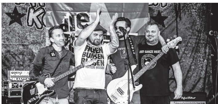
Samstag, 19. Oktober - Punkrock Meuterei mit Chapter X, Die Erwins, Frau Paul und Bei Bedarf, Kulturwerkstatt Forum e.V., Neustadt

Öffnungszeiten: Fr. - Mi. 11.30 - 15 Uhr und 17 - 21 Uhr, Donnerstag Ruhetag