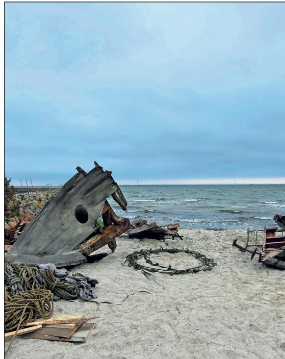
Am Strand wurde ein Schiffswrack und etliche Requisiten aufgebaut.

Grömitz. Mit der Verfilmung des historischen Bestsellers feierte der „Der Medicus“ 2013 große Erfolge. Nun folgt die lang erwartete Fortsetzung der Geschichte um den jungen Mediziner Rob Cole, gespielt von Tom Payne. Für diese Fortsetzung hat die Produktionsfirma „Zeitsprung Pictures“ aus Köln unsere wunderschöne Region als einen der Drehorte ausgewählt. Der Strand von Grömitz hinter dem Yachthafen diente als Kulisse für die Szene, die später im Film das Anlanden nach dem Schiffbruch zeigen wird. Ob der Strand von Grömitz tatsächlich im Film gut erkennbar sein wird, bleibt spannend. Das Filmteam hatte einen Greenscreen dabei und außerdem einiges präpariert. Da der Medicus im 11. Jahrhundert spielt, mussten alle Hinweise auf eine moderne Infrastruktur verdeckt werden. Die Dreharbeiten sind inzwischen abgeschlossen und die Filmcrew wieder abgereist. Sie hatten auch im Vorfeld darum gebeten, ihr Kommen nicht öffentlich bekannt zu machen, um möglichst ungestört zu sein. Diese Rechnung ging nicht ganz auf, da viele Grömitzerinnen und Grömitzer sowie Urlauberinnen und Urlauber dort bei bestem Wetter entlang spazierten und interessiert das Treiben verfolgten. (ko)