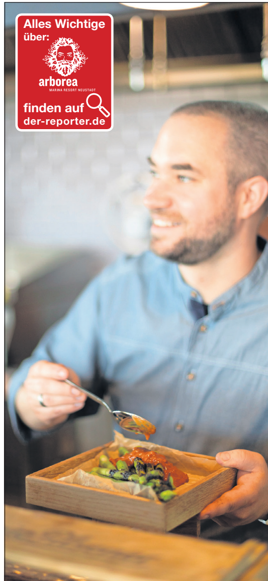
Die Köche lassen sich bei der Küchenparty über die Schulter schauen.

Die exklusive Küchenparty findet am 29. Oktober im arborea Marina Resort, in der ancora Marina, statt. Von 18 Uhr bis Mitternacht erwartet die Gäste ein abwechslungsreiches kulinarisches Erlebnis in stilvoller Atmosphäre. Tickets sind für 99 Euro (inklusive aller Getränke und Speisen) erhältlich. Aufgrund der begrenzten Teilnehmerzahl wird eine frühzeitige Reservierung empfohlen. Weitere Informationen und den Ticketkauf finden Interessierte unter arborea-resorts.com . (red)