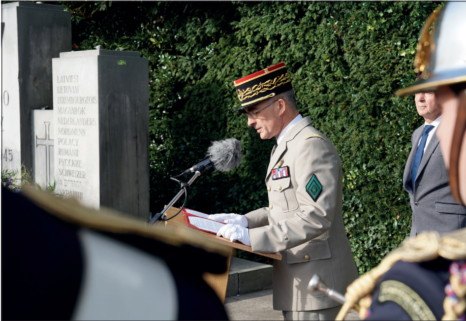
General de Cacqueray hielt sowohl eine Ansprache auf deutsch als auch auf französisch.

Neustadt. Am vergangenen Samstag besuchte eine Delegation der Pariser Feuerwehr, angeführt von General de Cacqueray, Neustadt und den Cap Arcona Gedenkfriedhof, um den Unteroffizier Sergent-Chef Durin zu ehren, der am 3. Mai 1945 beim Untergang der Cap Arcona ums Leben kam. Ihm gelten Ehre und Respekt, bekräftigte der General in seiner Ansprache am Cap Arcona Friedhof. Außerdem dankte er der Stadt Neustadt für die Gastfreundschaft und die Unterstützung bei der Durchführung der Ehrung.