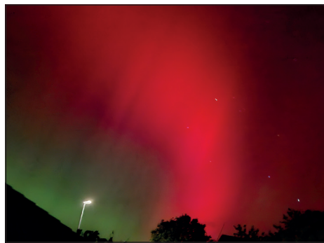
Angela Buzhalja erwischte eine tiefrote Nuance und schickte uns dieses Foto.