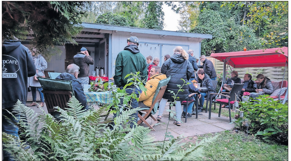
Der Austausch stand im Mittelpunkt des Festes.