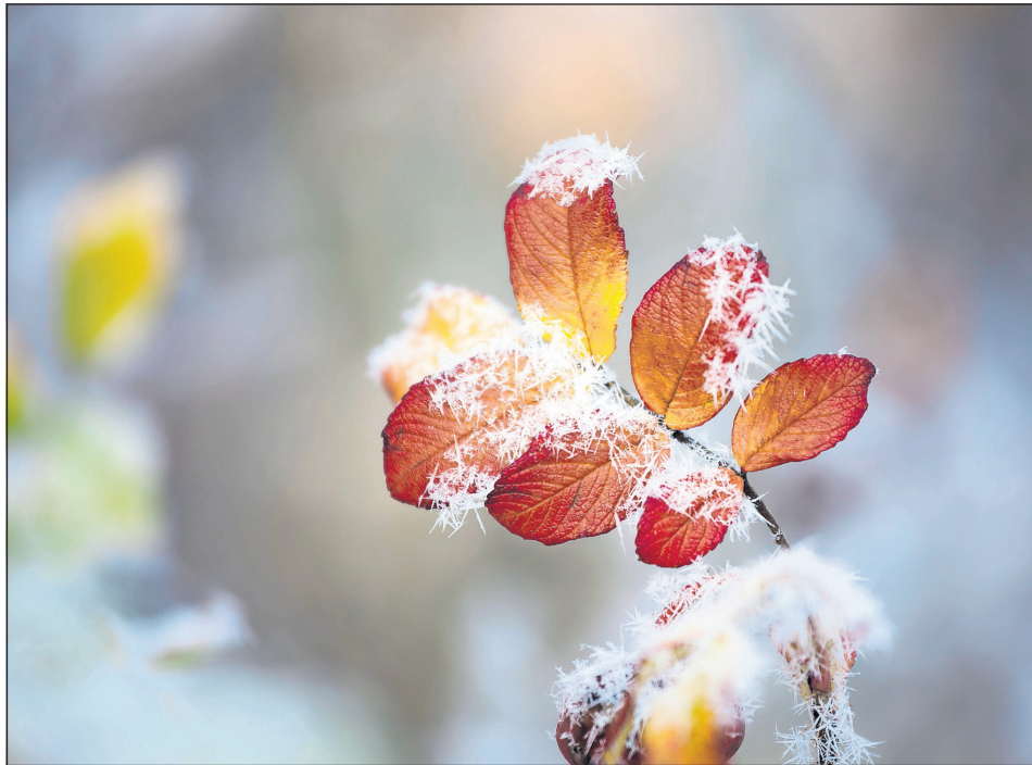
Der Herbst bringt die stillen Tage des Erinnerns an unsere Verstorbenen.

Verstorbene Angehörige und Freunde bleiben unvergessen. Besonders in den nächsten Wochen, wenn die sogenannten stillen Tage beginnen, denken wir intensiver an unsere Verstorbenen.