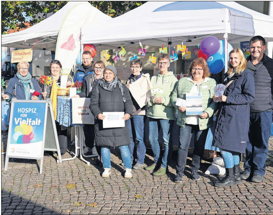
Die Vertreterinnen und Vertreter des Palliativ- und Hospiznetzwerks Ostholstein führten viele Gespräche, beantworteten alle Fragen zum Thema und schafften es so, Berührungsängste abzubauen.

„Sterben und Tod sind immer noch tabuisierte Themen“