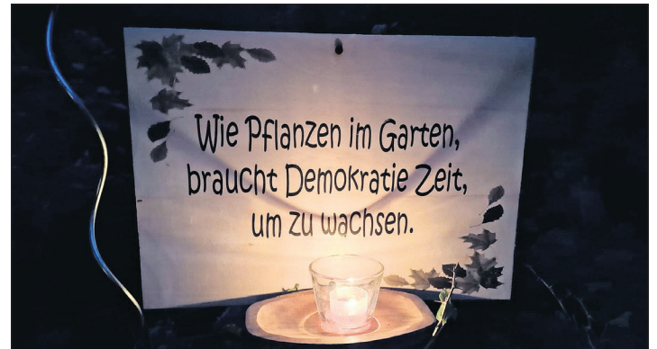
Überall im Garten standen Schilder mit inspirierenden Sprüchen.