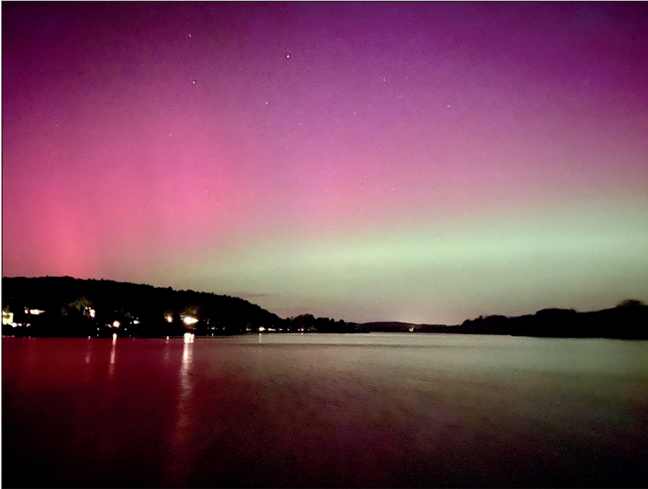
Diese Aufnahme stammt von Knud Gomlich und zeigt den Kellersee.

Ostholstein. In der Nacht von Donnerstag auf Freitag konnten die Ostholsteinerinnen und Ostholsteiner ein seltenes und atemberaubendes Naturschauspiel beobachten: Polarlichter zogen über den Himmel und tauchten die Nacht in leuchtende Farben. Das faszinierende Phänomen, das normalerweise eher in nördlichen Regionen zu sehen ist, zeigte sich diesmal auch in unserer Region und begeisterte zahlreiche Schaulustige.