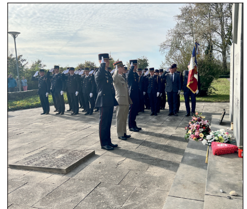
Die Gedenkveranstaltung fand beim Ehrenfriedhof im Stutthofweg statt.