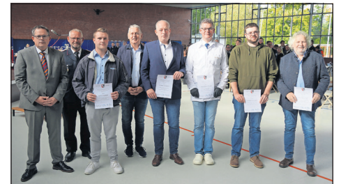
Auch Gastronomen und Gewerbetreibende wurden für ihren Einsatz von der Gemeinde ausgezeichnet.

aussprechen. Besonders imponiert hat mir der Zusammenhalt, den wir im Ort erleben durften, was gebraucht wurde, war da. Gastronomen und Gewerbetreibende haben die Einsatzkräfte und Helfer ungefragt versorgt. Ich bin stolz, Bürgermeister einer so tollen Gemeinde, die so zusammenhält, sein zu dürfen“, lobte Bürgermeister Sebastian Rieke. (ab)