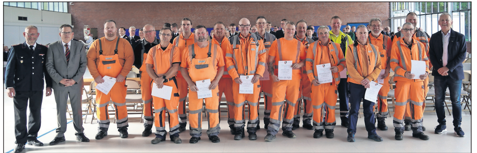
Die geehrten Mitarbeiter des Bauhofes der Gemeinde Grömitz.