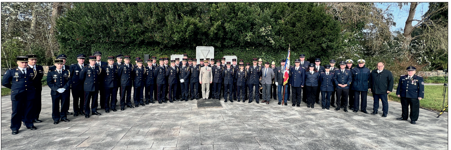
Gruppenfoto der Gäste mit den Gastgebern.