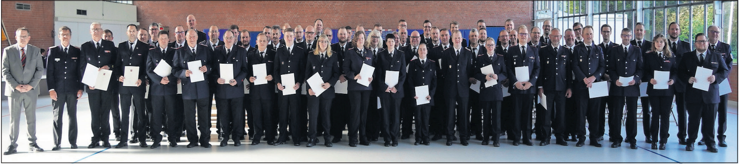
Die Kameradinnen und Kameraden der Gemeindefeuerwehr erhielten vom Land Schleswig-Holstein das Flut-Ehrenzeichen 2023.