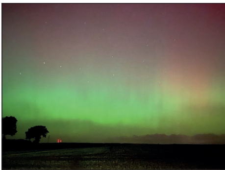
Nils Gehrke hat das Farbspiel am Himmel ebenfalls fotografisch festgehalten.

Besonders beeindruckend waren die grünen, violettten und roten Farbschleier, die sich über den Himmel legten und eine fast magische Stimmung verbreiteten. Viele Leserinnen und Leser haben diesen einzigartigen Moment festgehalten und uns ihre schönsten Aufnahmen zugeschickt. Die Redaktion von der reporter bedankt sich herzlich für die Vielzahl an tollen Fotos, die die beeindruckende Lichtshow dokumentieren. (ko)