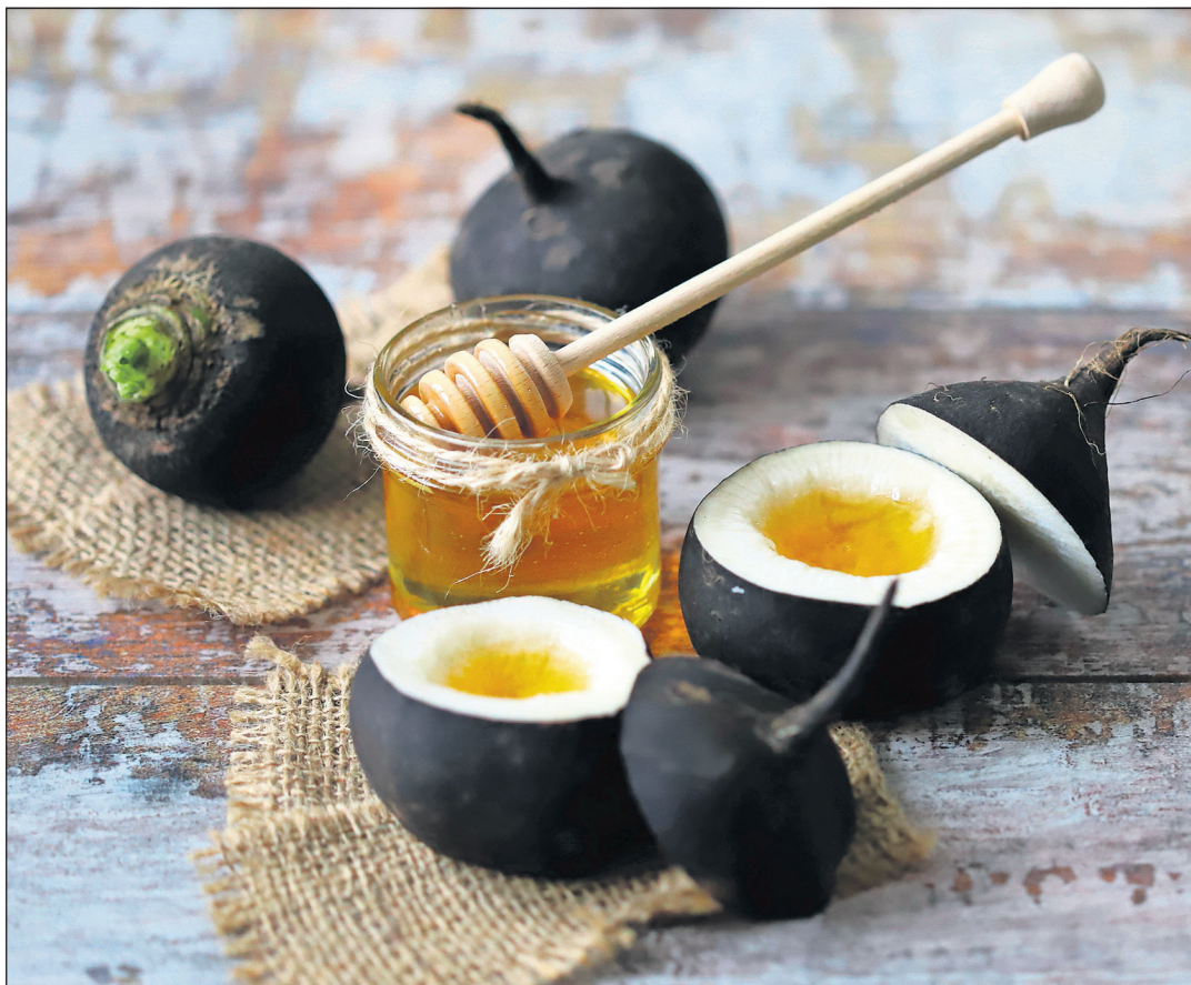
Aus Rettich und Honig kann ein Hustensaft hergestellt werden.

In der Erkältungszeit setzen viele Menschen auf altbewährte Hausmittel, um leichte Erkältungssymptome wie Husten, Schnupfen oder Heiserkeit zu lindern. Hier sind fünf Mittel, die sich seit Generationen bewährt haben und bei leichten Erkältungssymptomen schnell Linderung verschaffen können.