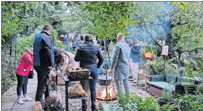
Die Gäste genossen die entspannte Atmosphäre.

ment des Erfolges. „Ehrenamtliche sind die Gärtner unserer Demokratie - ohne sie gäbe es weder Blüten noch Früchte.“ Den Höhepunkt des Abends bildete eine spektakuläre Feuershow, die von der Stadtjugendpflege gespendet wurde. Die Flammen loderten in den Nachthimmel und bildeten den perfekten Abschluss für ein Fest, das die Wärme, den Zusammenhalt und die Kraft des Ehrenamts in der Gemeinschaft gefeiert hat. (red)