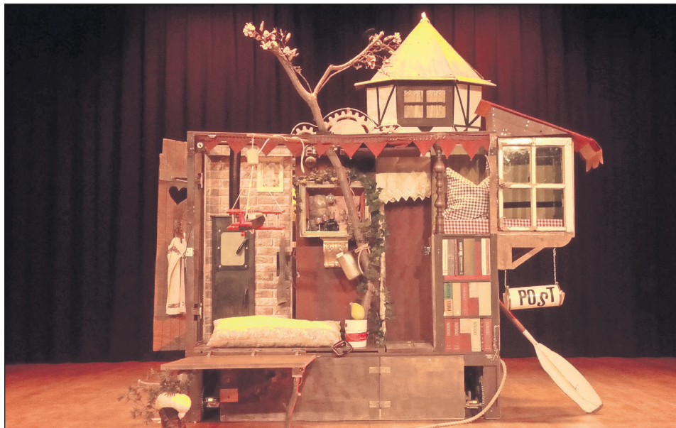
Das Theaterstück ist geeignet für Kinder von vier bis 10 Jahren.

Neustadt. Am Samstag, dem 9. März um 15 Uhr begrüßt die Kulturwerkstatt Forum die „compagnie nik“. Das Kinder- und Jugendtheater bringt die Geschichte „Serafin und seine Wundermaschine“ nach Motiven des Bilderbuches von Philippe Fix zur Aufführung. Serafin arbeitet als Fahrkartknipser in der U-Bahn. Aber viel lieber ist er Träumer und Erfinder, bastelt und fantasiert mit seinem besten Freund Plum. Als die beiden eines Tages eine völlig heruntergekommene Villa finden, sind sie überglücklich: Endlich können sie all ihre Ideen verwirklichen und so leben, wie sie es sich vorstel-