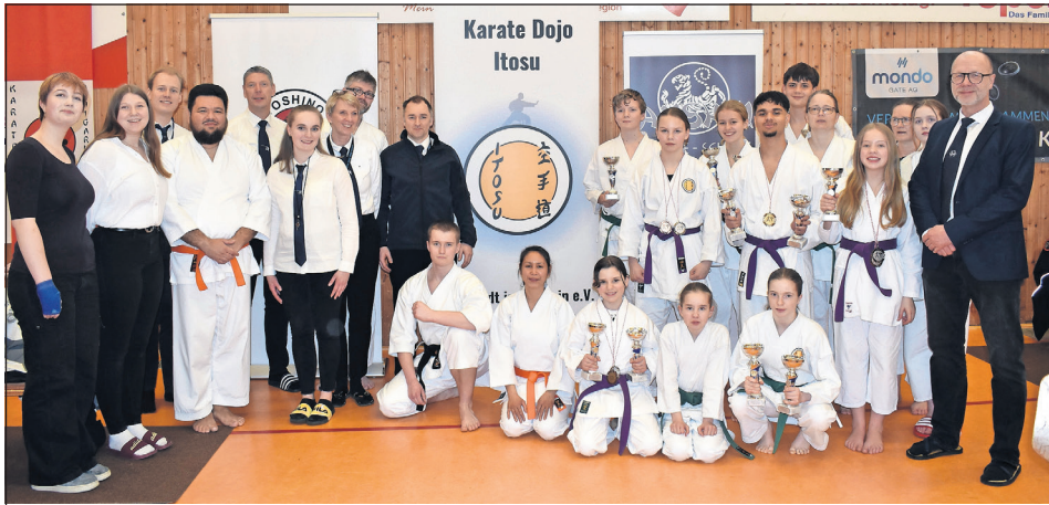
Das Karate Dojo Itosu Neustadt freute sich über das erfolgreiche Wochenende beim 15. Ostseecup.

Neustadt. Am vergangenen Wochenende kamen wieder über 160 Starter und 35 Teams aus 14 verschiedenen Dojos aus dem gesamten Bundesgebiet zum 15. Ostseecup in die Gogenkrog-Halle zusammen. Neben dem Wettkampf standen das harmonische Miteinander und der gemeinsame Austausch im Vordergrund.