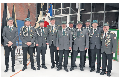
Ernennung der Funktionsträger.