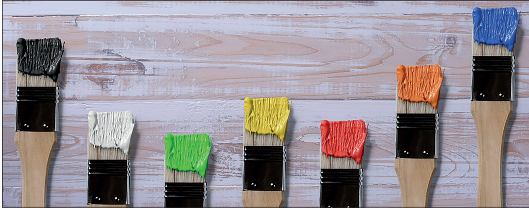
Als Maler und Lackierer arbeitet man mit den verschiedensten Farben, Werkzeugen und Techniken.

Wer seine beruflichen Herausforderungen in gestalterischer Kreativität sucht, wird im Maler- und Lackiererhandwerk fündig werden. Kaum ein anderer Berufszweig eignet sich besser dafür. Denn wer kann schon von sich behaupten, täglich mit den buntesten Farben zu arbeiten, Räume zu verändern, Fassaden zu gestalten und den Lebensbereich von Menschen zu verschönern? Etwas für die Zukunft zu schaffen, das mit Glück Jahrzehnte überdauert?