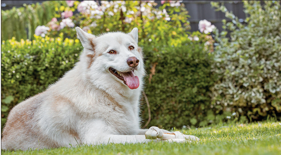
Besonders Hunde mit dichtem Fell freuen sich über einen kühlen, schattigen Ruheplatz im Garten.

Ein eigener Garten stellt nicht nur für Menschen einen besonderen Rückzugsort und das persönliche kleine Stück Natur dar. Auch ihre Hunde haben Freude am privaten Grün. Vor allem aktive Hunderassen können sich dort neben der Gassi-Runde zusätzlich austoben und die frische Luft genießen. Und ruhigere Zeitgenossen finden im Garten sicherlich ein gemütliches Plätzchen zum Ausruhen. Bei geteilter Gartennutzung von Zwei- und Vierbeinern sollten Hundebesitzer jedoch einiges beachten. Hier sind die wichtigsten Tipps: