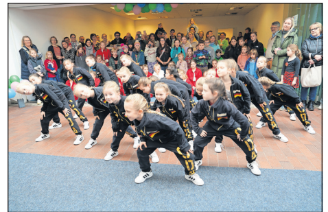
Bereits die Jüngsten der Central Dance Academy zeigten ihr Können.