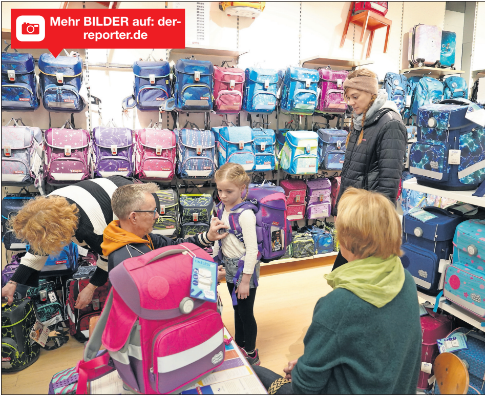
Der richtige Sitz des neuen, mitwachsenden Schulranzens ist entscheidend, schließlich sollen die Unterrichtsmaterialien für ganze vier Jahre darin transportiert werden.

Neustadt. In der eska Passage kam am vergangenen Samstag so richtig Stimmung auf, denn das Kaufhaus hatte zur Schulparty eingeladen. Zahlreiche Kinder und deren Eltern, Großeltern, Onkel und Tanten sind der Einladung gefolgt und haben an den vielen tollen Aktionen teilgenommen, am Glücksrad gedreht und sich einen neuen Schulranzen für den Schulstart oder -wechsel ausgesucht. Hier haben die Mitarbeiter und Mitarbeiterinnen des eska-Kaufhauses wieder mit fachkundiger Beratung zur Seite gestanden und ganz genau hingeschaut, ob der Schulranzen in seinen Anforderungen