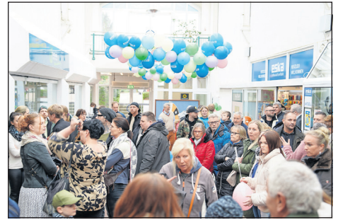
Richtig viel los: Die eska Passage war gut gefüllt, besonders als die Central Dance Academy aus Grömitz ihren Auftritt hatte.

Besonders voll wurde es, als die Central Dance Academy aus Grömitz ihre Tänze zeigte und eindrucksvoll ihr Können präsentierte. Kaffee und Kuchen gab es vom Förderverein des Kindergartens „Am Binnenwasser“ und das Kinder- und Jugendnetzwerk war ebenfalls vertreten. Ausführliche Füllerberatung, die Vorstellung von LÜK, das Lernspiel, Kinderschminken sowie die Präsenz der Freiwilligen Feuerwehr und des Zoos Arche Noah aus Grömitz rundeten das Programm ab. (ko)