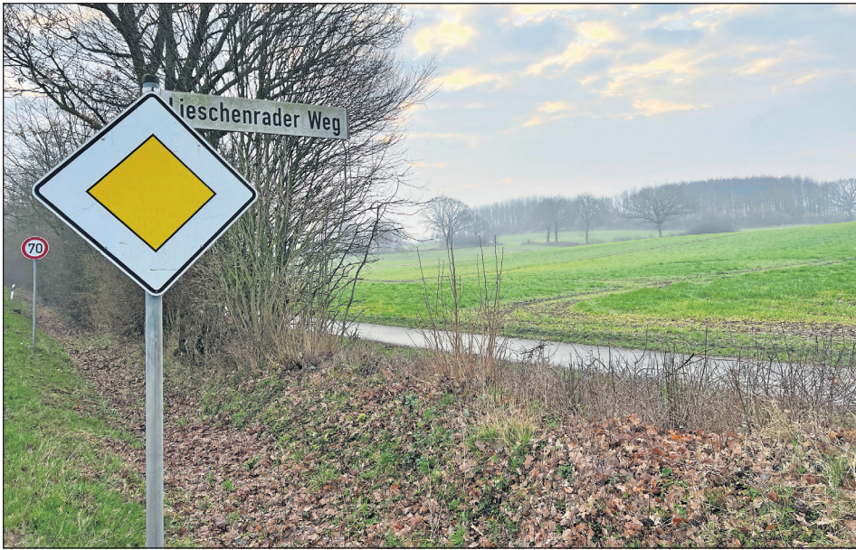
Die Grüngutsammelstelle im Lieschenrader Weg wird nun überraschend doch wieder geöffnet. Der genaue Zeitpunkt steht allerdings noch nicht fest.

Neustadt. Eigentlich fehlte nur noch eine letzte Formalität, um die städtische Grüngutsammelstelle für die Öffentlichkeit endgültig zu schließen, so wie 2023 beschlossen. Doch dann kam alles anders. Denn die Mitglieder des Planungs-, Umwelt- und Bauausschusses (PUBA) stimmten in ihrer letzten Sitzung am 22. Februar mehrheitlich gegen die Aufhebung der Benutzungs- und Gebührensatzung. Folge: Die Stadt ist gehalten, den Betrieb der Sammelstelle auch in diesem Jahr fortzusetzen. Eigentlich laut Satzung ab dem 1. März, dies sei jedoch wegen der überraschenden Entscheidung der Ausschussmitglieder nicht möglich. „Wann wir die Grüngutsammelstelle wieder öffnen können, werden wir noch bekanntgeben“, informierte der Bürgermeister bei der letzten Stadtverordnetenversammlung am vergangenen Donnerstag. Bis dahin bitte man die Neustädterinnen und Neustädter, die privaten Annahmestellen zu nutzen.