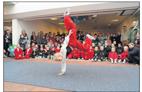
Die Schulparty war ein voller Erfolg. Es gab eindrucksvolle Moves, stolze Eltern und glückliche Kinder.