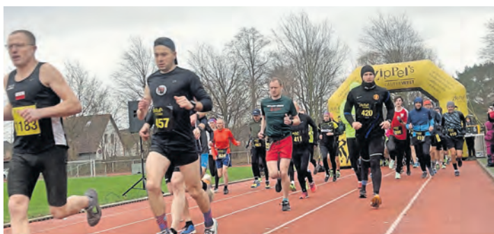
Sonntag, 14. Januar - reporter Lauf, Gogenkrogplatz, Neustadt