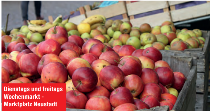
Dienstags und freitags Wochenmarkt - Marktplatz Neustadt

16.30 bis 17.30 Uhr - Schatzkiste Kindergruppe ab 5 Jahren , An der Bäderstr.77, Süsel