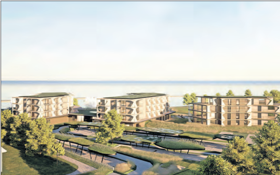
Das Falkensteiner Family-Resort soll oberhalb des Yachthafens entstehen. Baubeginn ist im Sommer nächsten Jahres geplant. (Grafik: NOA)

Anfang 2023 wurde der Tourismus-Service Grömitz erneut von der Gemeindevertretung beauftragt, die Suche nach einem passenden Hotelpartner für den Neubau oberhalb des Yachthafens aufzunehmen, nachdem im Herbst 2022 der alte Investor abgesprungen war.