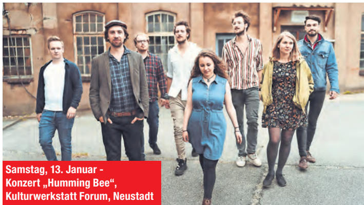
Samstag, 13. Januar - Konzert „Humming Bee“, Kulturwerkstatt Forum, Neustadt

11 Uhr - "Anatomie eines Falls" im KoKi, Kinocenter V.d. Kremper Tor, Neustadt