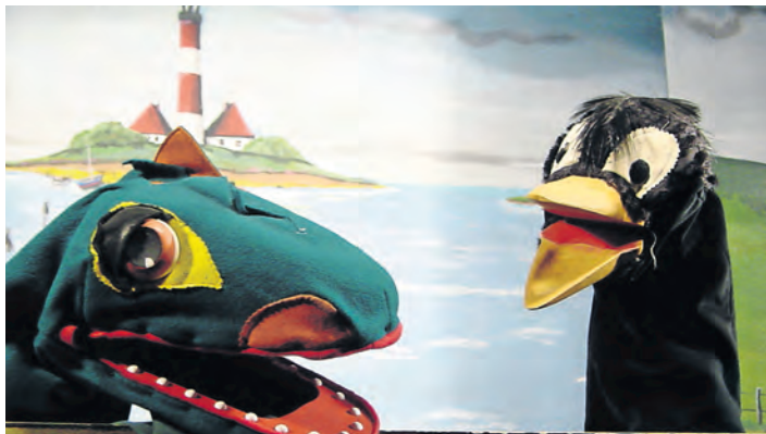
Mittwoch, 17. Januar - Kindertheater, Friedrich-Hiller-Schule, Schönwalde

16.45 bis 18.45 Uhr - Wassergymnastik Seniorenbeirat , Ameos Klinikum, Neustadt