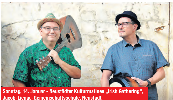
Sonntag, 14. Januar - Neustädter Kulturmatinee „Irish Gathering“, Jacob-Lienau-Gemeinschaftsschule, Neustadt

Öffnungszeiten: Fr. - Mi. 11.30 - 15 Uhr und 17 - 21 Uhr, Donnerstag Ruhetag