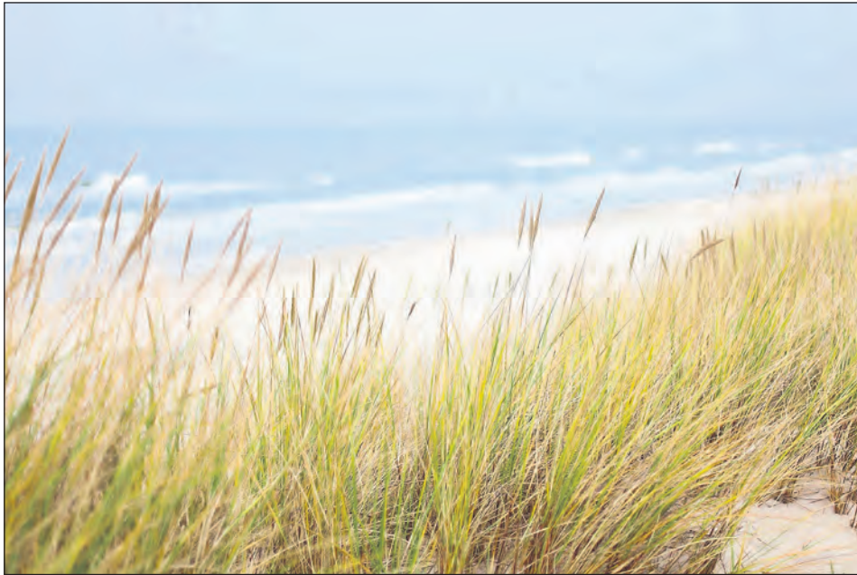
Der Natur lauschen - Gute Hör-Vorsätze 2024.

Für viele Menschen ist wieder richtig Hören und Verstehen zu können, oft gleichbedeutend mit mehr Miteinander und mehr Lebensfreude, weiß die Hörmanufaktur Neustadt und Eutin.