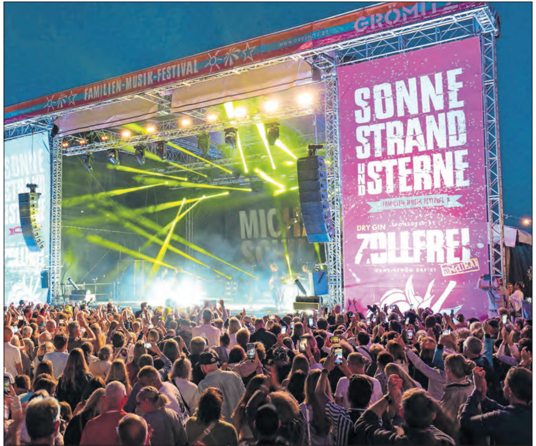
Höhepunkt 2024 ist das Familien-Musikfestival „Sonne, Strand und Sterne“ im Strandbereich neben der Seebücke.

Sonne, Strand und Sterne: Vom 3. bis 7. Juli findet das Familien-Musikfestival „Sonne, Strand und