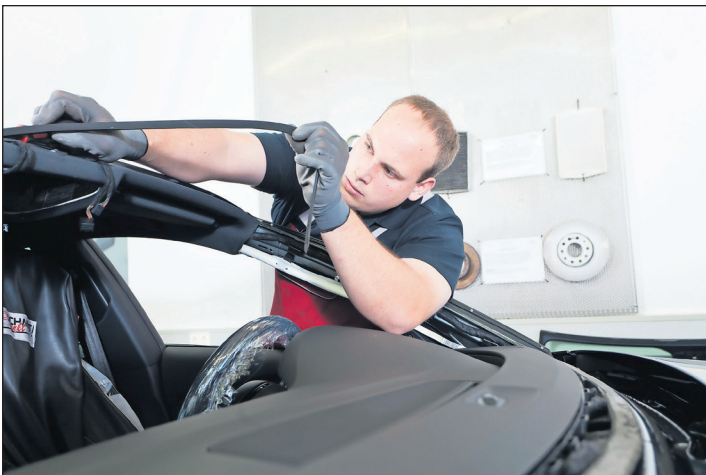
Bei größeren Steinschlägen ist ein Austausch der Frontscheibe unumgänglich.

Es gibt Schäden, vor denen kann man kein Auto schützen. Wie Steinschläge in der Windschutzscheibe. Doch was ist dann zu tun?