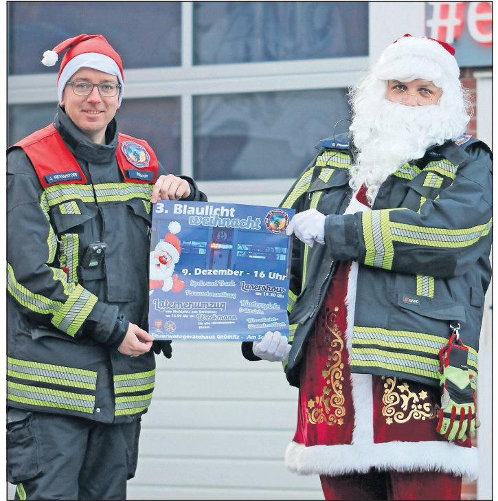
Die Freiwillige Feuerwehr Grömitz freut sich auf die Blaulichtweihnacht und hofft auf viele Teilnehmerinnen und Teilnehmer.

begleitet wird. Teilnehmende Kinder werden im Anschluss mit einem leckeren Weckmann belohnt. Alle Gäste können sich zudem erstmals auf eine Lasershow um 19.30 Uhr freuen. Im Rahmen der Fahrzeugschau können zwei Neuzugänge besichtigt werden. Das Löschgruppenfahrzeug Katastrophenschutz und das Mehrzweckfahrzeug „Drohne“ stehen für Fotos zur Verfügung. Die Feuerwehr weist darauf hin, dass die Anzahl von Parkplätzen am Tag der Veranstaltung begrenzt ist. Ein großer Dank geht an Fritz Ketzler (Weckmänner) und GORDANS Gastro- und Eventservice (Lasershow) für die Unterstützung der Veranstaltung. (red)