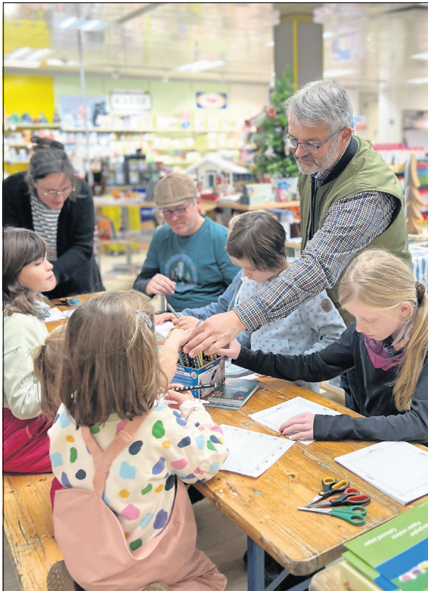
Im Anschluss an die Lesung wurde fleißig gebastelt.