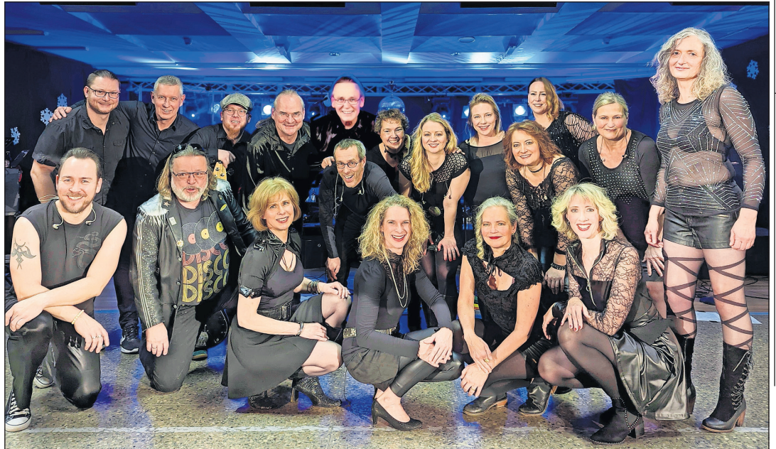
„Soateba“ überzeugt mit starken Stimmen, choreografischen Einlagen und abwechslungsreichen Bühnenausfits.

Die Öffnungszeiten des Neustädter Wintertreffs sind sonntags bis mittwochs von 11 bis 20 Uhr, donnerstags von 11 bis 23 Uhr (Musik bis 22 Uhr) sowie freitags und samstags von 11 bis 22 Uhr. (red)