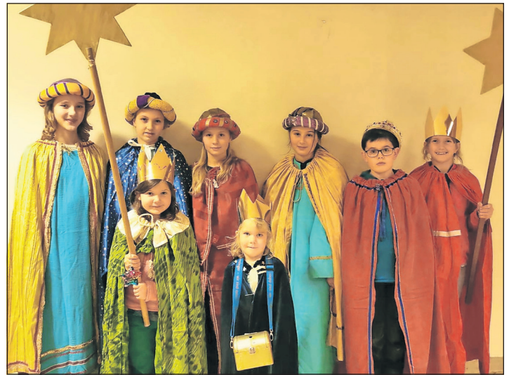
Die kleinen Könige segnen die Familien und Häuser in Neustadt und Umgebung.

Sonntag, dem 7. Januar die Familien und Häuser in Neustadt und Umgebung segnen. Hierzu kleben sie den Segen 20°C+M+B+24 - Christus mansionem benedicat an die Türen, singen Lieder und sammeln Spenden ein. Es werden alle Haushalte besucht, die sich in die Liste in der katholischen Kirche eingetragen beziehungsweise ich im Pfarrbüro unter Tel. 04561/17287 oder gemeindebuero.neustadt@pfarrei-st-vicelin.de angemeldet haben. (red)