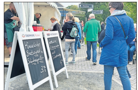
Himmlische Bratwurst oder göttliche Erbsensuppe. Das kulinarische Angebot versprach Erfüllung.