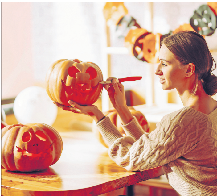
Der Brauch hat seinen Ursprung in Irland.

werden. Oldfield bat um einen letzten Trunk, woraufhin sich der Teufel in ein Geldstück verwandelte. Oldfield steckte das Geldstück ein, hatte jedoch ein Silberkreuz im Geldbeutel, woraufhin der Teufel nicht mehr entkommen konnte. Sie schlossen einen