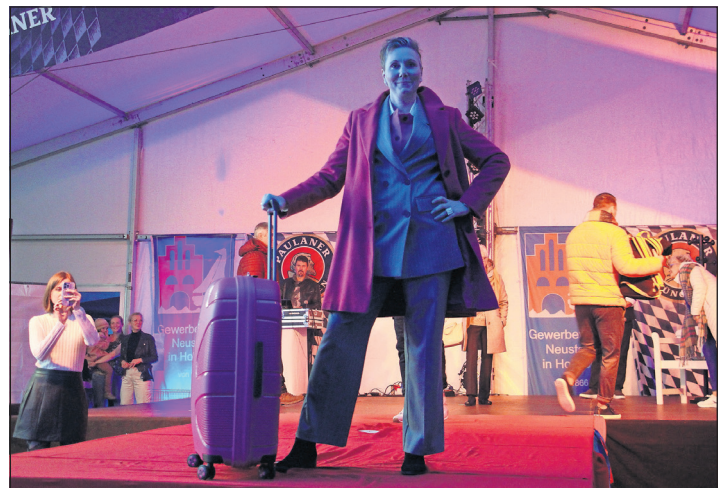
Vom Mantel bis zum Koffer. Die Models zeigten eine große Bandbreite der aktuellen Modelle.