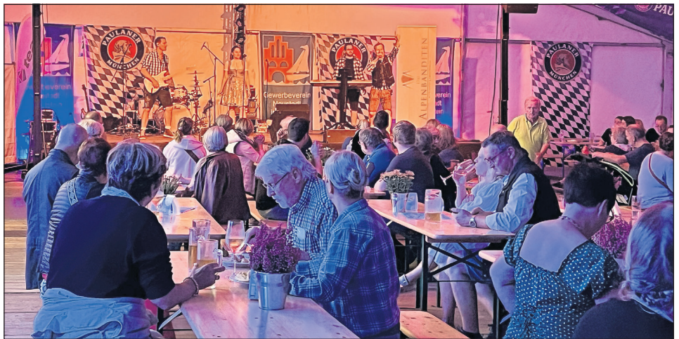
Auch bei den zünftigen Oktoberfesten mit Livemusik herrschte super Stimmung im Festzelt.