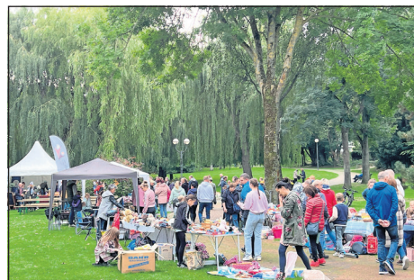
An den Flohmarktständen wurde schon am Vormittag kräftig gehandelt und gefeilscht.