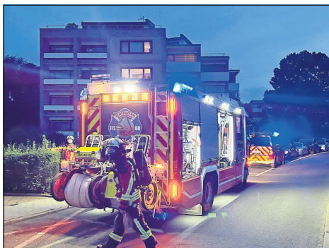
Von außen waren keine offensichtlichen Anzeichen von Rauch, Feuer oder Brandgeruch zu sehen.