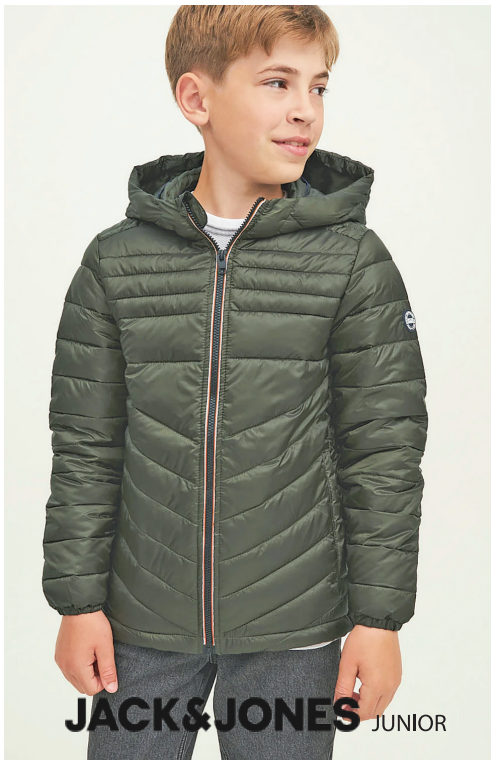
JACK & JONES JUNIOR