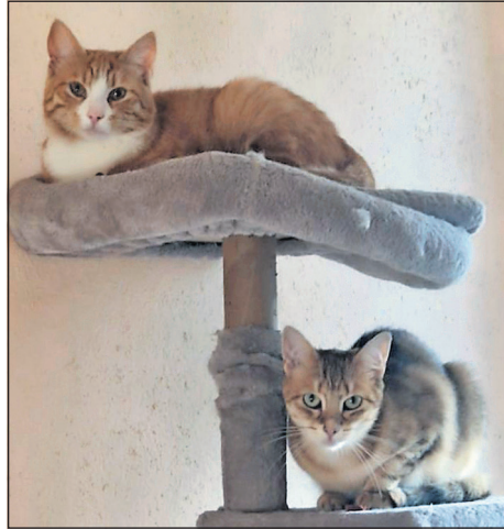
Sind ein tolles Team: Lucy und Bobby.

Wer diesen beiden Schönheiten ein neues Zuhause geben möchte, melde sich bitte bei Tiere in Not e.V. Heiligenhafen-Fehmarn unter Tel. 0176/46109011. (he/red)