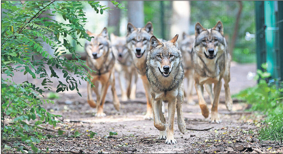
Wölfe in Deutschland: Frank Faß vom Wolfcenter Dörverden wirft mit den jungen Studierenden einen Blick auf dieses faszinierende Rudeltier.

Neustadt. Wölfe leben als soziale Tiere in engen Familienverbänden und unterstützen sich gegenseitig. Doch wer gehört eigentlich zu einem Rudel und wie entsteht es? Diese Fragen beantwortet Wolfsexperte Frank Faß vom Wolfcenter Dörverden bei der Kinderuni am Samstag, dem 7. Oktober um 10.30 Uhr in die Aula der Jacob-Lienau-Schule in der Schulstraße.