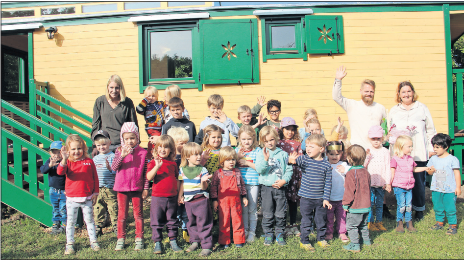
Die Naturgruppe mit ihren Betreuern vor dem schicken Bauwagen.

Lensahn. 16 Kinder des Waldorfkinder Gartens Morgenstern haben auf dem Museumshof Lensahn ein neues Zuhause gefunden. Die neu installierte „Naturgruppe“ hat ihr Domizil auf einem abgetrennten Bereich des Prienfeldhofes, wo