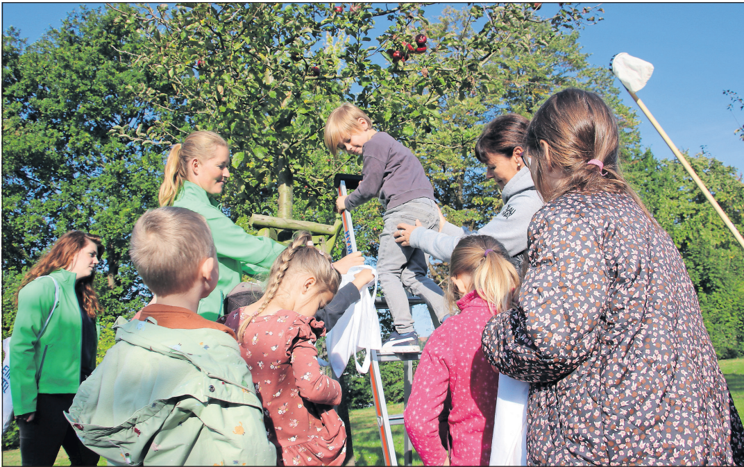
Die „Schuleulen“ aus der Kita Am Kaiserholz kamen mit der Hilfe ihrer Erzieherinnen und den Stadtwerke-Mitarbeiterinnen auch an die Äpfel ganz oben im Baum heran.

Neustadt. Die Obstbäume stehen momentan in voller Pracht. Überall zwischen den Zweigen funkeln dicke rote Äpfel, so auch bei den Bäumen auf der Streuobstwiese am Heisterbusch.