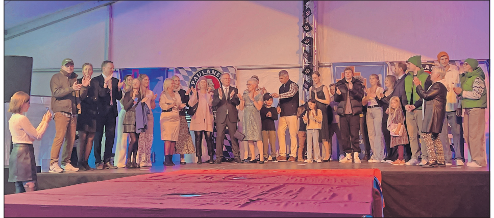
27 Models und viele weitere Unterstützerinnen und Unterstützer hinter den Kulissen zeigten die schönsten Outfits für Herbst und Winter.