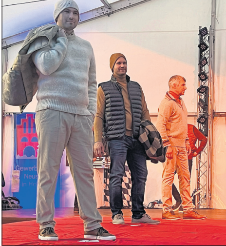
Gezeigt wurde Herren-, Damen- und Kindermode für Jungen und Mädchen und die schönsten Trends für Jugendliche.

Neustadt. Auch die Jubiläums-Modenschau am Sonntagabend war eine rundum gelungene Veranstaltung im Rahmen des Gewerbevereinsjubiläums. Vor ausverkauftem Haus präsentierten 27 Models