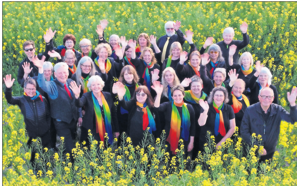
Unter dem Dach der VHS Eutin und der Kreismusikschule Ostholstein singt der Chor seit 1997 mit viel Spaß und Leidenschaft.

In einer Pause besteht die Möglichkeit, sich zu stärken und mit den Chormitgliedern ins Gespräch zu kommen. Der Eintritt ist frei. Der Chor freut sich über Spenden für die Chorarbeit. (red)