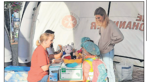
Für die Kleinsten eröffnete extra eine Teddybärklinik, in der das geliebte Kuscheltier zur ärztlichen Untersuchung vorbeigebracht werden konnte.

Rund 22.000 Notfallpatientinnen und -patienten behandelt die Schön Klinik Neustadt pro Jahr. Auch komplexen und schwerwiegenden Notfälle kann hier rund um die Uhr hoch qualifiziert geholfen werden, dafür stehen eine zertifizierte Stroke-Unit für Schlaganfälle, eine zertifizierte Chest-Pain-Unit zur Behandlung von unklarem Brustkorbschmerz, eine zertifizierte Heart Failure Unit zur Behandlung von Herzschwäche und ein zertifiziertes Traumazentrum zur Versorgung von Schwerstverletzten zur Verfügung. Über den direkt angeschlossenen Hubschauberlandeplatz können Patientinnen und Patienten aus der ganzen Lübecker Bucht und dem Umland schnellstmöglich angefliegen werden.