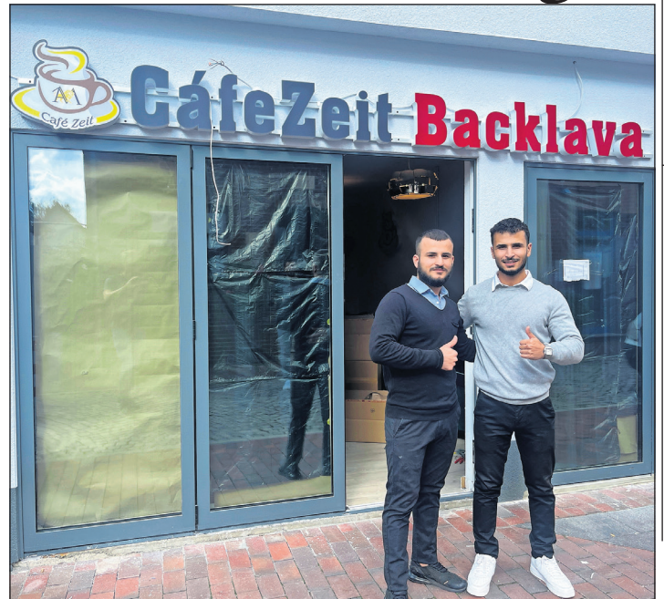
Neustadt. Im ehemaligen Optik-Peters in der Hochtorstraße 7 in Neustadt eröffnet am morgigen Sonntag, dem 24. September ab 12 Uhr Familie Abdullah ihr „Café Zeit“. Leckere Getränke und selbstgemachter Kuchen sowie das arabische Gebäck „Baklava“ erwarten die Gäste. Familie Abdullah freut sich auf viele neugierige Besucherinnen und Besucher. (red)