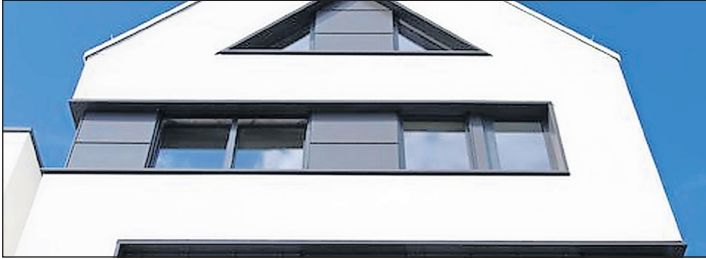
Putzstrukturen werten die Fassade auf und verleihen dem Zuhause ein individuelles Gesicht.

Der Fassade mit Putz eine individuelle und langlebige Struktur verleihen