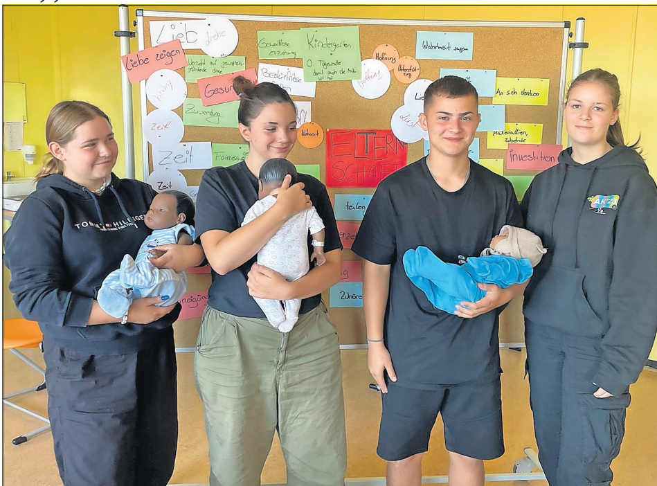
Die Babypuppen mussten zu jeder Tages- und Nachtzeit betreut werden.

Grömitz. Babies in der Schule? Ja, genau. Im Rahmen des Projektes „Eltern auf Probezeit“ hatten Schülerinnen und Schüler der 10. Klasse kürzlich die Möglichkeit, eine Woche lang eine Babypuppe zu betreuen. So wurden die Babies mit in den Alltag der Jugendlichen integriert und auf einmal kam dann der Neuankommeling mit zur Fahrschule, war bei Treffen von Freunden oder auf dem Reiterhof dabei. Die Gruppe erlernte den Umgang mit einem