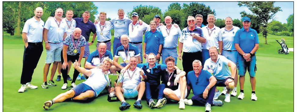
Die Spieler der beiden Mannschaften.

Die 12 Spieler waren schnell gefunden, da ein Ryder Cup zwischen zwei oder mehreren Golfclubs nicht unbedingt üblich ist. Der Gastgeber von Fehmarn konnte an diesem Tag sein Können besser abrufen als das Team