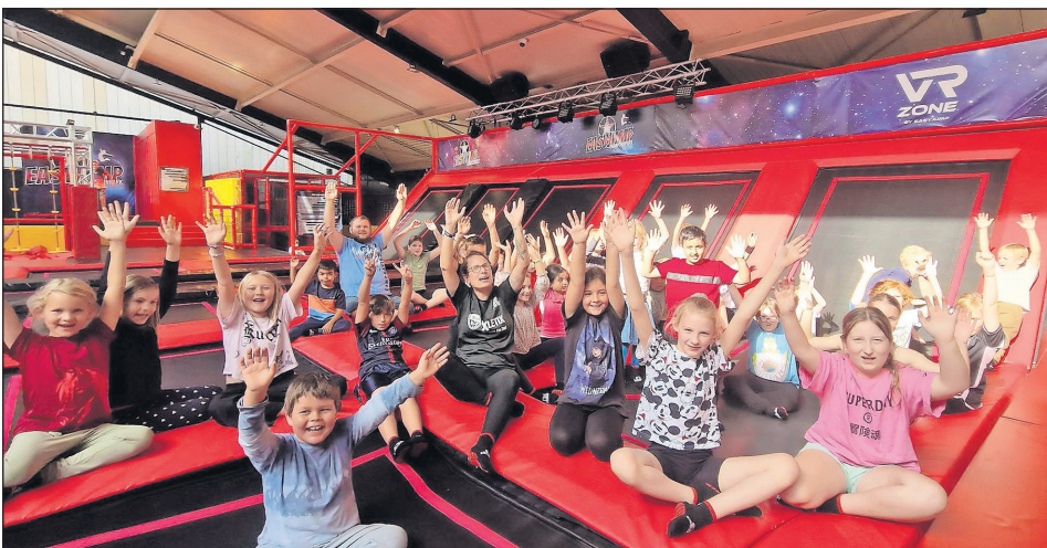
Hatten sichtlich Spaß: die Kinder und Jugendlichen aus der Gemeinde Grömitz.