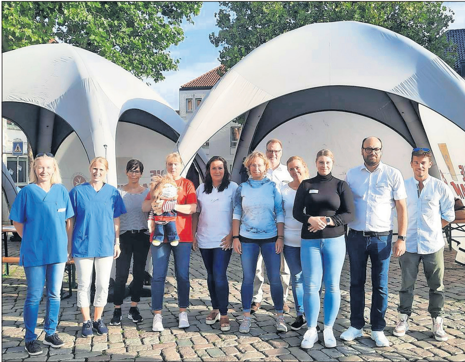
Die Hauptakteure des Aktionstages.

Stabile Seitenlage und Herzdruckmassage können Leben retten und die Minuten überbrücken, bis der Rettungswagen eintrifft. Zum Auftakt der bundesweiten „Woche der Wiederbelebung“ hatte die Schön Klinik Neustadt am Montag auf dem Marktplatz in der Innenstadt dazu eingeladen, sich ganz ohne Berührungsängste mit lebensrettenden Maßnahmen vertraut zu machen.