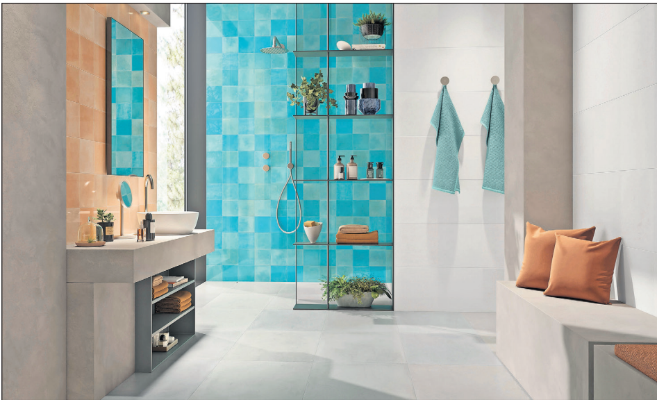
Kräftige Farben lockern den urbanen Loft-Look von Fliesen in Betonoptik auf.

Eine reduzierte Farbpalette mit grauen, schwarzen und weißen Grundtönen kennzeichnet den urbanen Loft-Stil. Fliesen in Beton- oder Estrichoptik greifen den Industriecharakter auf, der sich mit Elementen wie freiliegenden Rohren und metallischen Accessoires unterstützen lässt. Dabei ist die keramische Oberfläche im Unterschied zu gegossenen Bodenflächen nicht anfällig für Risse oder Flecken. Einen gestalterischen Gegenpol bietet Holz. Dessen natürlicher Look wird auch im Bad immer beliebter, denn er schafft eine wunderbar wohnliche Atmosphäre. Dabei entscheiden sich die meisten Bauherren für keramische Holzoptiken. Die aktuellen Holzdekore sehen nicht nur täuschend echt aus, sie fühlen sich mit plastisch gemaserten Oberflächen auch so an. Damit lässt sich ein authentisches Holzfeeling ins Bad holen, ohne Kompromisse bei der Reinigung und Langlebigkeit einzugehen. Um das „Natur-Bad“ noch entspannender zu gestalten, empfiehlt sich der Einsatz einer dezenten indirekten Beleuchtung. (djd)