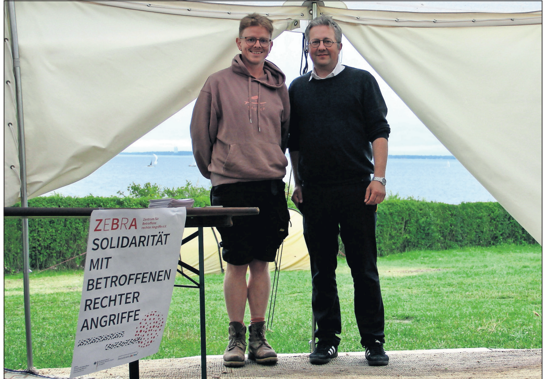
Spendenübergabe mit Blick auf die Lübecker Bucht.

Das Zentrum für Betroffene rechter Angriffe (Zebra e.V.) hat kürzlich einen Vortrag zu rechter Gewalt und der Perspektive derer, die sie erleben, an der Steilküste zwischen Neustadt und Pelzerhaken gehalten. Anlass für den Vortrag mit anschließender Diskussions- und Fragerunde in der Jurte mit Blick auf die Lübecker Bucht war die Übergabe einer Spende von 2.673,90 Euro des Campingplatzes Seeblick an den Verein.