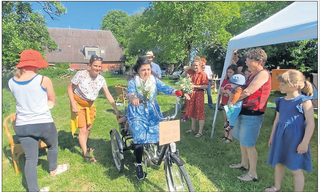
Ein Geschenk von den Nachbarn. Das Fahrradfahren musste die afghanische Frau aber in Deutschland erst lernen, denn in Afghanistan werden Frauen, die Fahrrad fahren, geächtet.

Die Integration und Akzeptanz der Gemeinschaft zeigt sich auf Partys und Veranstaltungen, zu denen wir herzlich eingeladen werden. Bei diesen Zusammenkünften geht es nicht nur ums Feiern; sie dienen auch dazu, Fäden der Einheit zu weben, die uns als eine große Familie verbinden. Ob es sich um ein Fest oder ein einfaches Treffen handelt, wir werden immer mit einem Lächeln, herzlichen Gesprächen und einem echten Interesse an unserem Herkunft empfangen.