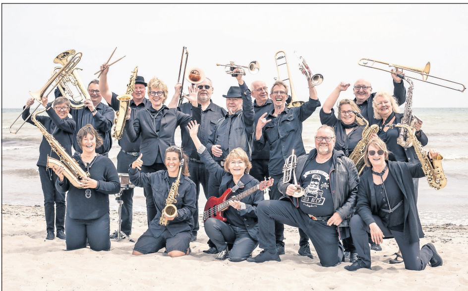
Das Repertoire von „Die Bandfelder“ reicht von Rock über Pop bis hin zu Jazz und Oldies.