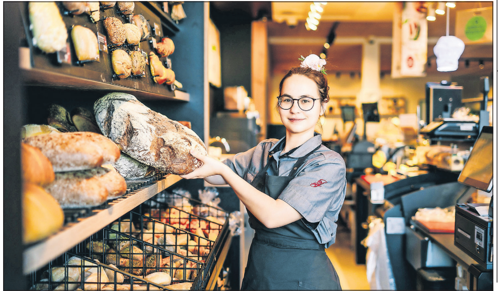
Frische und Qualität kombiniert zum „Echten Genuss“. Dafür steht Junge.

Am 15. September, dem Eröffnungstag, lohnt es sich, schon früh bei Junge im Dünenpark zu sein. Ab 7.30 Uhr erhalten die ersten 100 Gäste kostenfrei eine JungeCard, deren Guthaben für ein Heißgetränk nach Wahl (klein oder mittel) verwendet werden kann - bei-