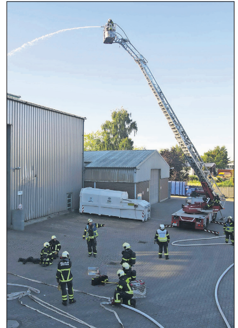
Rasches Handeln und koordinierter Einsatz waren bei der Großübung gefordert.

Die Freiwillige Feuerwehr Neustadt und alle weiteren freiwilligen Feuerwehren in der Region verdienen höchsten Respekt für ihren unermüdlichen Einsatz. Der Zweckverband Ostholstein (ZVO) bedankt sich für den Einsatz der Freiwilligen Feuerwehr Neustadt und wird auch zukünftig seine volle Unterstützung für solche wichtigen Aktivitäten in unserer Region gewähren. (red)