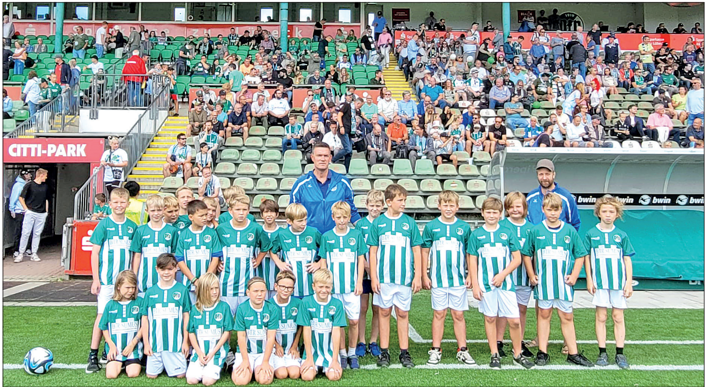
Der Fußball-Nachwuchs des TSV Lensahn vor der Lohmühlen-Haupttribüne.

Der Saisonauftakt zur 3. Fußball-Bundesliga am vergangenen Samstag fand unter Mitwirkung des TSV Lensahn statt. Nachwuchskicker aus E1-, G-, F- und D-Jugend waren als Einlaufkinder zu Gast auf der Lübecker Lohmühle.