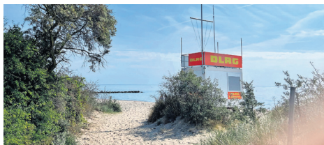
Bliesdorf hat unter anderem auch einen wunderschönen Strand.