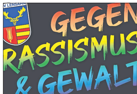
Tafel TSV Lensahn mit der Aufschrift „Gegen Rassismus & Gewalt“.

Am vergangenen Wochenende, dem 4. und 5. August, haben bislang unbekannte Täter eine Tafel des TSV Lensahn mit der Aufschrift „Gegen Rassismus & Gewalt“ demontiert und entwendet. Die Polizei sucht Zeugen.