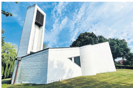
Ein prägnantes Gebäude in Bliesdorf: Die Kapelle am Ortseingang gehört zur Kirchengemeinde Altenkrempe.