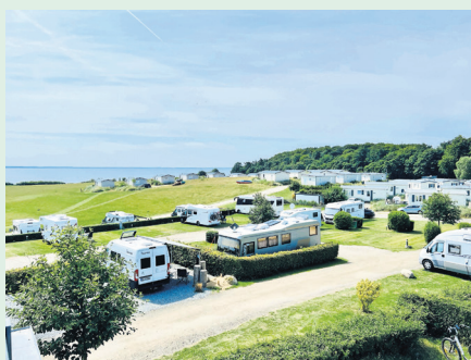
Der Campingplatz Walkyrien liegt oberhalb des idyllischen Naturstrandes von Bliesdorf.