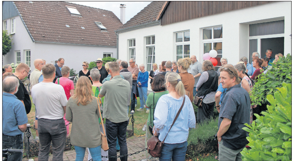
Rund 50 Gäste aus verschiedensten sozialen Einrichtungen der Stadt nahmen an der Eröffnungsfeier teil.

17 Uhr per telefonischer Anmeldung unter 04561/7145805, oder per Mail an sucht.nst@ats-oh.de .