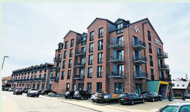
Wir machen mit euch eine kleine Tour durch das wunderschöne 4-Sterne Hafenhôtel Meereszeiten in Heiligenhafen.

Wir haben bei unserem Aufenthalt neben einer Privatführung durch das ganze Hotel eine traumhaft schöne Suite mit Blick auf den Yachthafen ergattert und uns dort nach unseren Dreharbeiten herrlich entspannen können. Das Meereszeiten