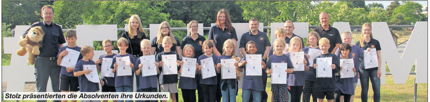
Stolz präsentierten die Absolventen ihre Urkunden.

Ein besonderes Löwentreffen fand kürzlich am Gerätehaus Grömitz statt. 17 Mädchen und Jungen der Kinderfeuerwehr stellten sich der Abnahme der Kinderflamme Stufe 1.