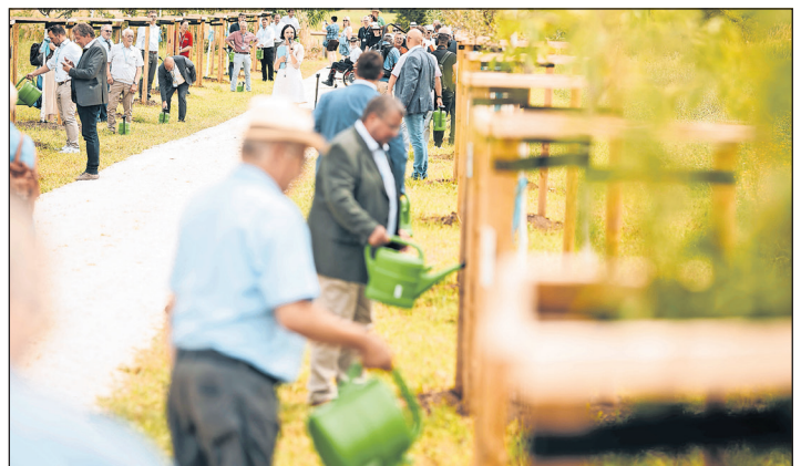
Das Pflanzen der Bäume ist ein Zeichen der Freundschaft zwischen den verschiedenen „Neustadts“.