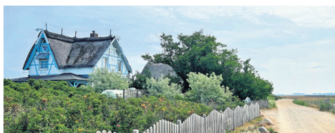
Es gibt ein blaues Haus und „das Blaue Haus“ auf dem Graswarder. Die Ostsee-Perlen haben auch darüber alles herausgefunden.