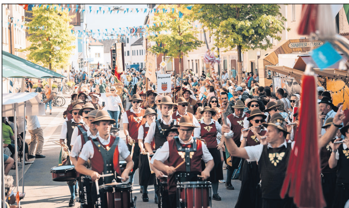
Jedes Neustadt präsentierte sich mit seinen eigenen traditionellen Trachten oder in Teamkleidung.