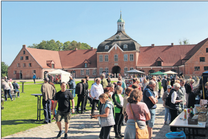
Großer Andrang im letzten Jahr. Gerechnet hatte man mit 800 Besuchenden, gekommen waren circa 2.000.

einkassen spülen. Im Gegensatz zum letzten Mal soll diesmal eine ganze Meile mit Essen und Trinken aufgebaut werden, die zur Not auch mit einem externen Catering-Unternehmen aufgestockt werden kann, um lange Wartezeiten zu verhindern.