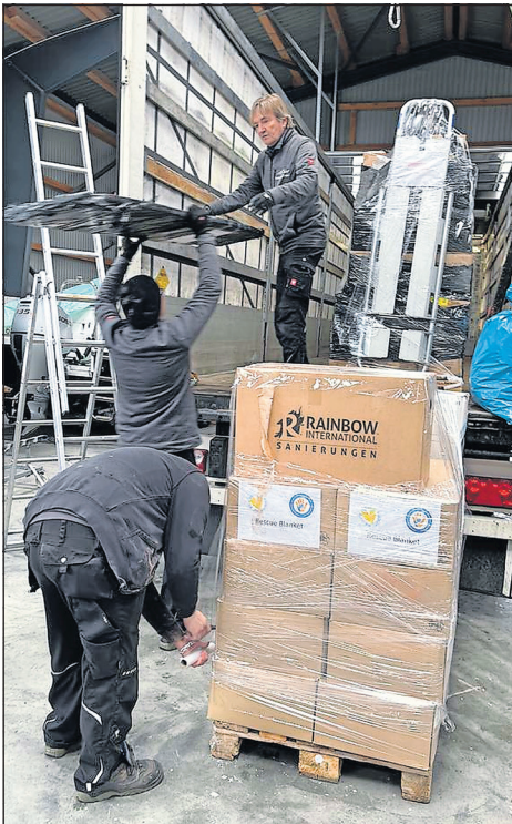
Der Transport beinhaltet nur Artikel, die gezielt vor Ort gebraucht werden.