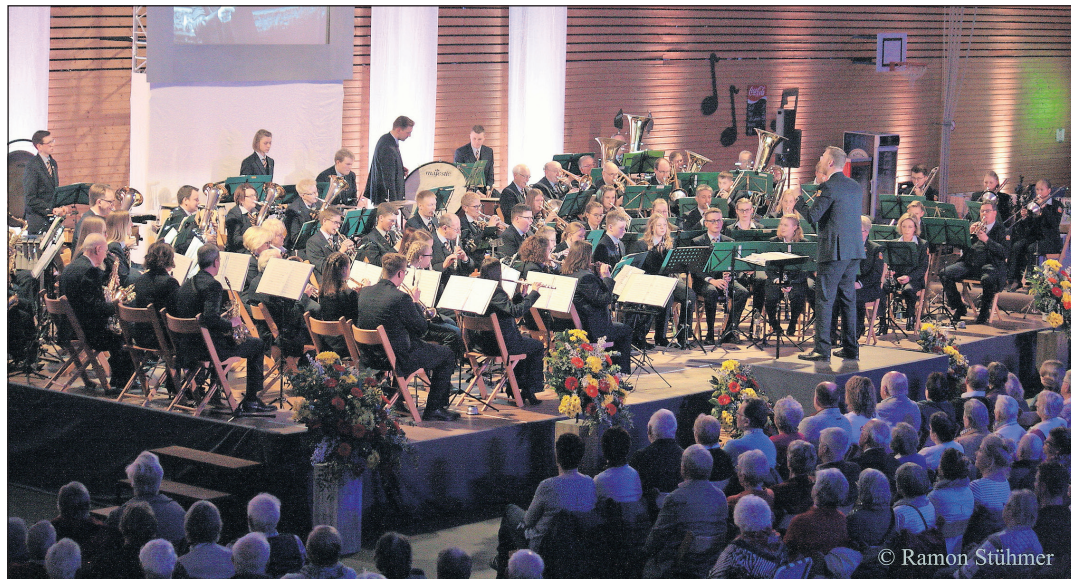
Die Frühjahrskonzerte des Blasorchesters Lensahn stehen im Zeichen der Liebe.

Der Kartenvorverkauf für die Frühjahrskonzerte des Blasorchesters Lensahn hat begonnen. In diesem Jahr steht alles im Zeichen der Liebe - mit „Music was my first love“ hat das bekannte Orchester ein romantisch verspieltes, in Teilen auch nostalgisches Konzertprogramm einstudiert, das sich sehen, beziehungsweise hören lassen kann.