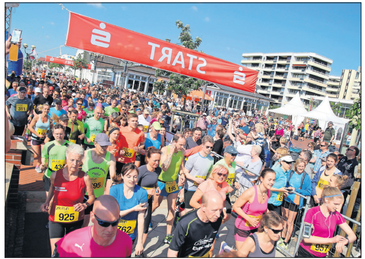
Start und Ziel ist auf dem Seebückenvorplatz.

Anmelden können sich begeisterte Läufer und Läuferinnen noch bis zum 9. Mai online unter www.sun-run.de oder telefonisch beim Tourismus-Service Grömitz unter 04562/256238. Nachmeldungen ab dem 10. Mai werden telefonisch bei Jan-Eric Hertwig vom TSV Grömitz Tel. 01525/3784649 aufgenommen. Die Organisationsbeiträge betragen 15 Euro für den Halbmarathon, 14 Euro für beide 5-km-Läufe sowie 7 Euro für den Schülerlauf. Ein Sun-Run-Überraschungsgeschenk ist bereits im Preis inkludiert. Die Startnummern-Ausgabe erfolgt am 14. Mai von 14 bis 18 Uhr sowie am 15. Mai von 8 bis 12.30 Uhr in der Passage der Grömitzer Welle.