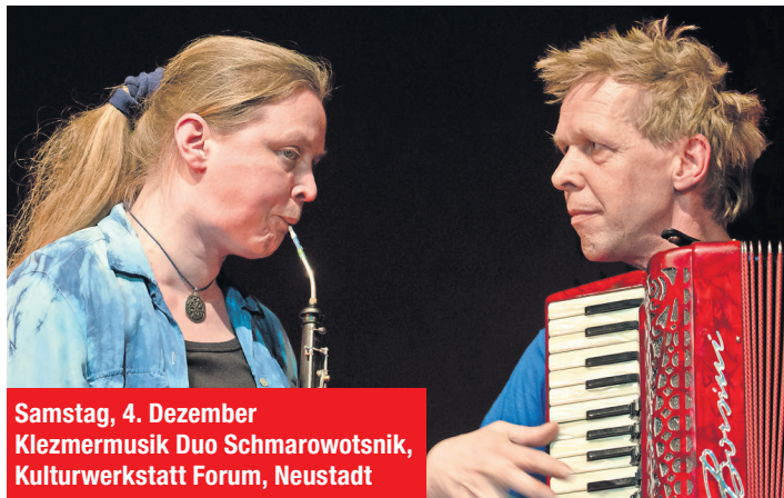
Samstag, 4. Dezember Klezmermusik Duo Schmarowotsnik, Kulturwerkstatt Forum, Neustadt