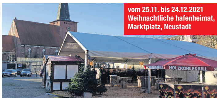
vom 25.11. bis 24.12.2021 Weihnachtliche Hafenheimat, Marktplatz, Neustadt