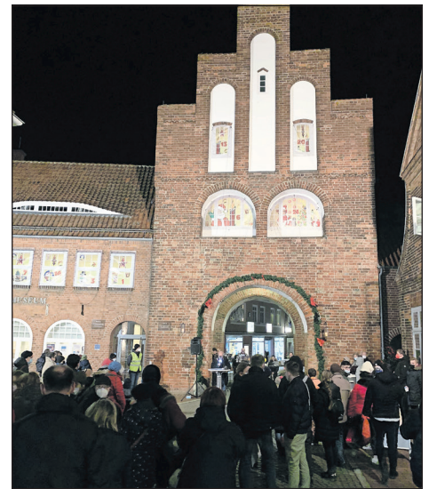
Am 1. Dezember versammelten sich viele begeisterte Neustädter am Kremper Tor.

Alle weiteren Termine gibt es auf www.riesen-adventskalender.de .