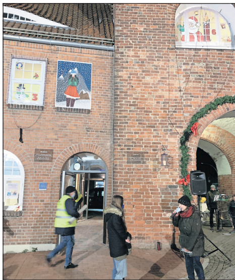
Das erste „Türchen“ wird enthüllt.

Am Donnerstagmorgen wurde der städtische Bauhof mit der Überprüfung aller Malplatten am Kremper Tor beauftragt. Es wurden zusätzliche Sicherungsmaßnahmen eingeleitet. „Wir wünschen dem Kind gute Besserung und hoffen sehr, dass es ihm ganz schnell wieder besser geht. Wir sind bereits mit der Einrichtung in Kontakt und nehmen auch mit der Familie direkten Kontakt auf“. In den vergangenen 13 Jahren sei ein solcher Fall nicht vorgekommen, so der Bürgermeister. Die Stadt Neustadt werde alles daran setzen, dass sich ein solches Ereignis nicht noch einmal wiederholt. (ko)