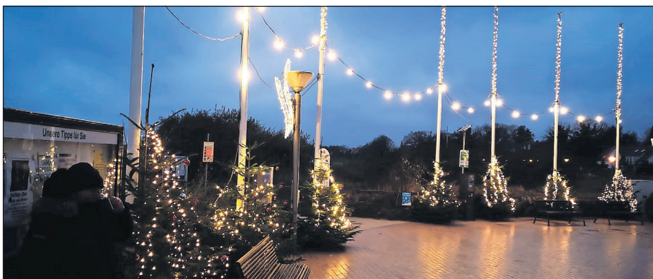
Weihnachtlicher Seebrückenvorplatz in Pelzerhaken.

an die Wasserrettung Pelzerhaken übergeben werden. Gerne können die Einwohnerinnen und Einwohner sowie die Gäste weiterhin ihren eigenen Weihnachtsschmuck in die Bäume hängen, um die Weihnachtsbäume noch schöner zu machen. (red)