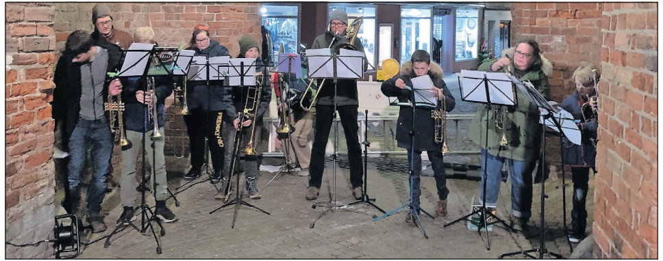
Der Posaunenchor der Kirchengemeinde sorgt für die musikalische Untermalung.