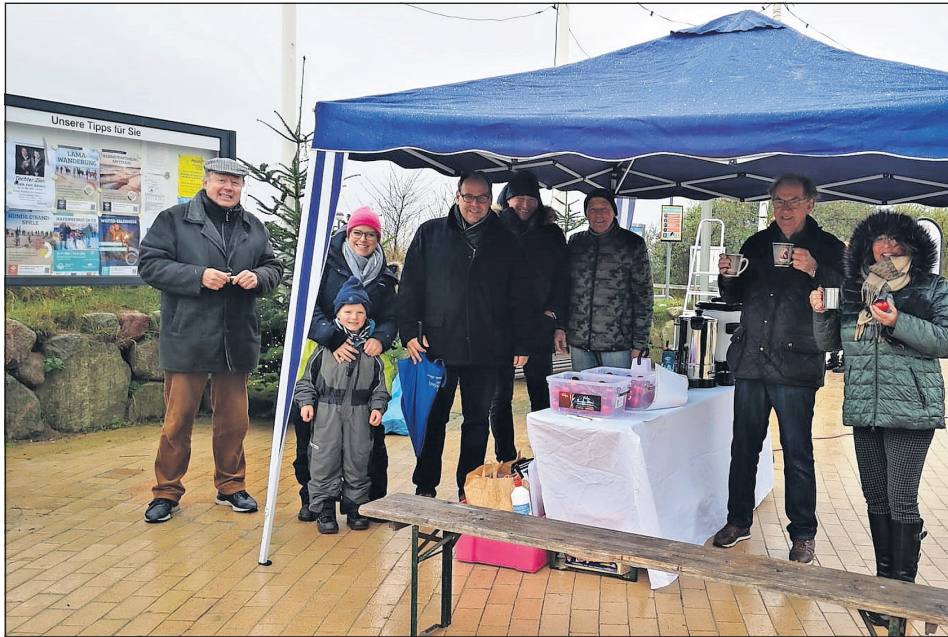
Teilnehmer der Aktion „Wir machen Pelzerhaken weihnachtlich“.

Pelzerhaken. Trotz eher schlechten Wetters am vergangenen Samstag haben sich viele Bürgerinnen und Bürger an den Seebrückenvorplatz zur Aktion „Wir machen Pelzerhaken weihnachtlich“ getraut. Es wurden Spenden gesammelt und dadurch können nun 415 Euro