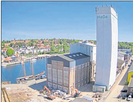
Die zweite Kamera zeigt den Blick auf den HaGe-Speicher.