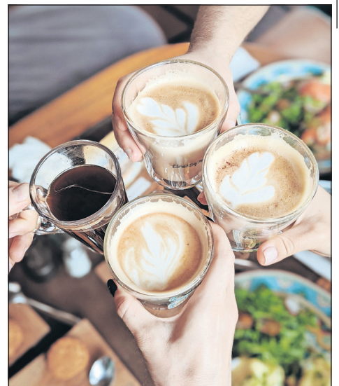
Hoch die Tassen: Endlich lässt es sich wieder bei duftendem Kaffee und einem ausgiebigen Frühstück treffen.

Der menschliche Körper verbraucht fast die Hälfte der Grundumsatzkalorien in der Nacht. Ein ausgewogenes Frühstück kurbelt den Stoffwechsel an, liefert Energie und macht einen Menschen leistungsfähiger. (red)