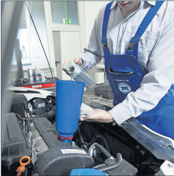
Das für das Fahrzeug zu verwendende Motoröl wird vom Hersteller vorgegeben.

Ein bisschen Ölverbrauch ist bei jedem Auto normal, ab und zu gießt man einen Schluck nach. Nur: Nicht jedes Öl passt zu jedem Motor, und die Sortenvielfalt nimmt weiter zu. Wie findet man die richtige? Die Heimwerker-Abteilungen vieler Supermärkte gleichen einem Museum, dort stehen noch immer die gleichen Ölsorten wie vor 30