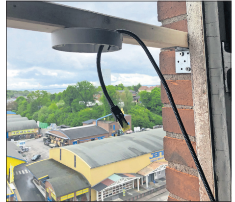
Die Kameras sind in schwindelerregender Höhe am Petersen-Speicher angebracht.