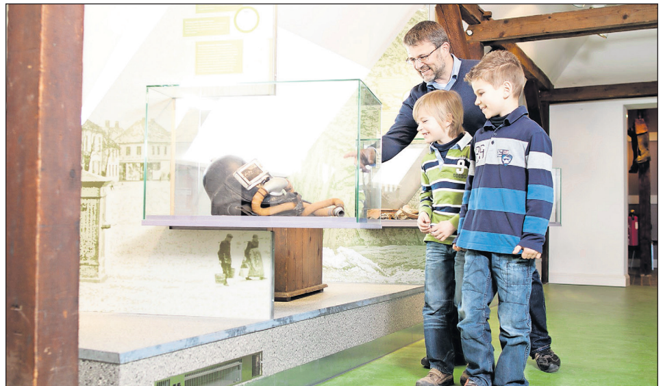
Bei der „zeitreise für Kinder“ erfährt man, wie Menschen früher gelebt, gearbeitet und ihre Zeit verbracht haben.

Neustadt. Wie groß war Elch „Waldemar“? Warum können wir uns freuen, dass es moderne Bohrer in Zahnarztpraxen gibt? Warum war für die Steinzeitmenschen der Feuerstein so wichtig? Gabi erzählt und zeigt am Montag, dem 31. August wie Menschen früher gelebt, gearbeitet und ihre Zeit verbracht haben. Die „zeitreise für Kinder“ beginnt um 15 Uhr im zeITTor Museum. Die Teilnahme an der Führung kostet mit Gästekarte 2,50 Euro, ohne Gästekarte 3,50 Euro und ist für Kinder und Jugendliche bis 18 Jahre frei. Um die Gefahr einer Ansteckung zu minimieren, müssen während der Führung die Abstands- und Hygieneregeln eingehalten werden. Es können maximal 12 Kinder teilnehmen. Bei Bedarf kann ein Ausweichtermin verabredet werden. Gemäß dem entsprechenden Erlass des Landes Schleswig-Holstein müssen teilnehmende Gäste ihre Kontaktdaten hinterlassen. Das Tragen einer Gesichtsmaske ist für Teilnehmende ab einem Alter von 6 Jahren Pflicht. (red)