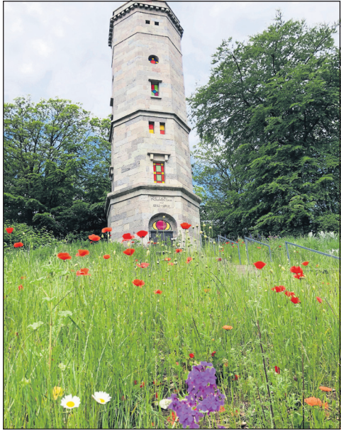
Der denkmalgeschützte Elisabethenturm auf dem Bungberg strahlt derzeit mit zahlreichen wilden Sommerblumen um die Wette.

Sommerliche Temperaturen am Himmelfahrtswochenende erwartet