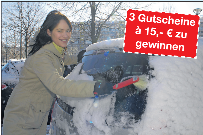
Vor dem Start müssen alle Scheiben am Auto frei sein von Schnee und Eis.

Dass es im Winter glatt werden kann, ist kein Geheimnis. Doch worauf ist während der kalten Jahreszeit noch zu achten, welche Fehler gilt es zu vermeiden? Es ist eigentlich nicht zu glauben, aber die ersten Schneefälle bringen es an den Tag: Es gibt immer noch Leute, die ohne Winterreifen herumgondeln und so den Verkehr zum Erliegen bringen. Ein teurer Spaß, denn die Ordnungshüter nehmen sich gezielt solche Fälle vor.