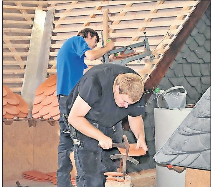
Handwerkliches Geschick ist eine wichtige Voraussetzung für den Dachdeckerberuf.

Dachdecker decken bei Weitem nicht nur Dächer, um sie wind- und wetterfest zu machen. Ebenso dichten die Handwerker Flachdächer mit modernen Techniken ab oder führen Abdichtungen von Balkonen und Terrassen aus. Sie gestalten Außenwände mit vorgehängten Fassadenbekleidungen, unterstützen Hausbesitzer bei der energetischen Sanierung und informieren über Fördermittel. Und technische Neuerungen wie der Einsatz von Drohnen oder das digitale Verarbeiten von Gebäudedaten werden künftig den Beruf mehr und mehr bestimmen. Zudem treten Dachdecker als Klimaschützer auf, wenn sie Gründächer anlegen und damit zum Beispiel die Staubbelastung in Innenstädten verringern. Sie sind gefragte Fachkräfte und kompetente Ansprechpartner - und das vom Keller bis zur Dachspitze. Als Klimaschützer haben die Dach-