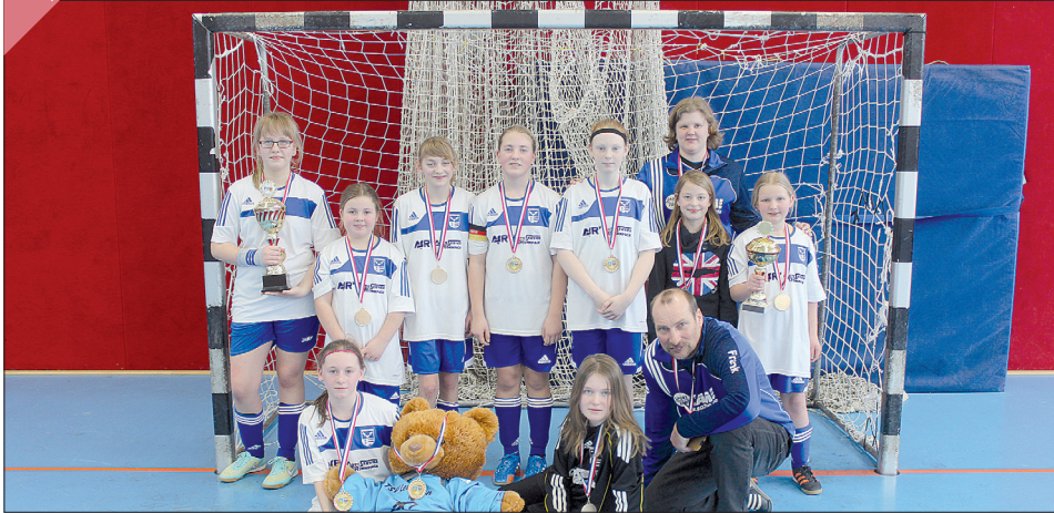
Der TSV Lensahn ist Futsal-Kreismeister bei den D-Juniorinnen.